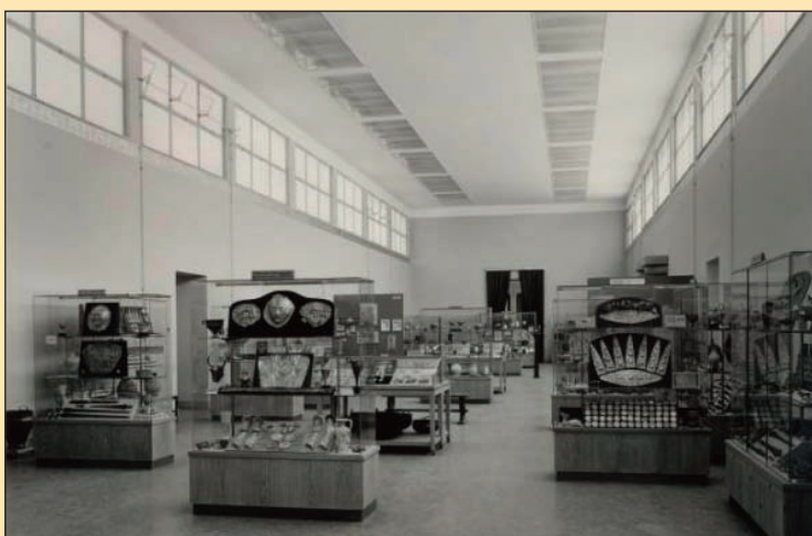
2. Η Μυκηναϊκή Αίθουσα μετά το 1957.

την Ύστερη Εποχή του Χαλκού (3η-2η χιλιετία π.Χ.). Στον πρώτο όροφο του Μουσείου σε ειδική αίθουσα (αρ. 48) εκτίθενται τα ευρήματα από το Ακρωτήρι Θήρας, την «Πομπηία του Αιγαίου». Η Προϊστορική Συλλογή δίνει στους πολυπληθείς επισκέπτες της τη δυνατότητα να παρακολουθήσουν μια πορεία μέσα στο χρόνο και τη συλλογική μνήμη, με κύρια σημεία αναφοράς τους θησαυρούς των πολύχρυσων Μυκηνών, τα χρυσά κύπελλα του Βαφειού, τις πινακίδες Γραμμικής Β γραφής, τα αιγιματικά μαρμάρινα κυκλαδικά ειδώλια, τη «νεολιθική οικία» και τους θησαυρούς της Τροίας και της Πολιόχνης και, βέβαια, τις περίφημες τοιχογραφίες της Θήρας.