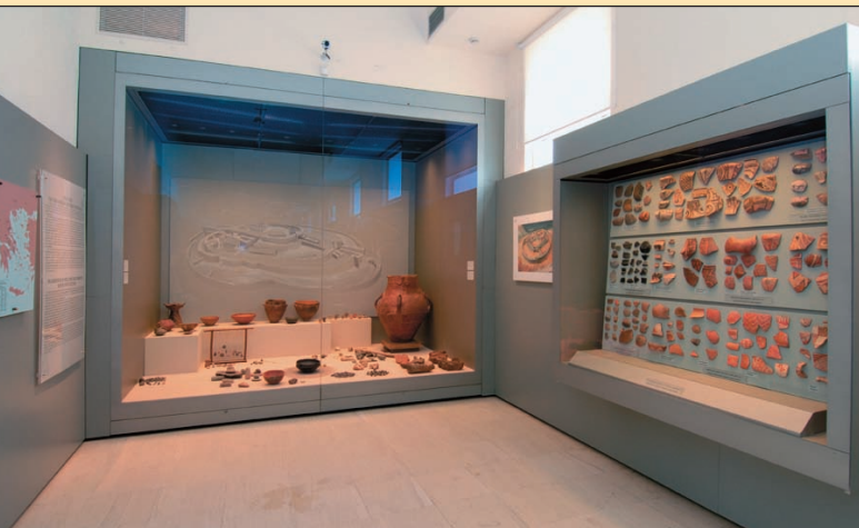
5. Νεολιθική Αίθουσα. Η νεολιθική «οικία» και η εξέλιξη της νεολιθικής κεραμικής, 2004.