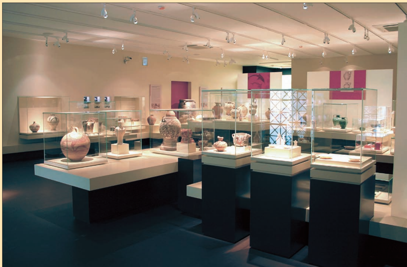
7. Αίθουσα της Θήρας. Γενική άποψη από την είσοδο, 2005.

Στην Κυκλαδική Αίθουσα, παρουσιάζονται στην είσοδο τα γνωστά έργα, όπως το γυναικείο άγαλμα, εικόνα θεότητας, οι δύο μουσικοί, ο αυλητής και ο αρπιστής από την Κέρο, από τα λίγα ανδρικά μαρμάρινα ειδώλια, και η προθήκη με την εξέλιξη των πρωτοκυκλαδικών ειδωλίων. Στη νέα έκθεση διακρίνονται δύο βασικές ενότητες. Στην πρώτη ανήκουν τα έργα του πρωτοκυκλαδικού πολιτισμού της 3ης χιλιετίας π.Χ., κτερίσματα τάφων της Πάρου, της Νάξου, της Σύρου, της Αμοργού και άλλων νήσων των Κυκλάδων, τα οποία εκτίθενται κατά χρονολογική σειρά και κατά ταφικά σύνολα. Σε μια προθήκη συγκεντρώνονται τα λιγοστά κατάλοιπα των οικισμών της ίδιας περιόδου και δημιουργούνται ειδικές θεμα-