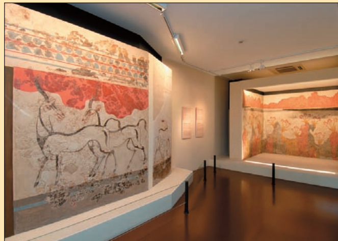
9. Αίθουσα της Θήρας. Γενική άποψη των τοιχογραφιών της Άνοιξης και των Αντιλόπων.