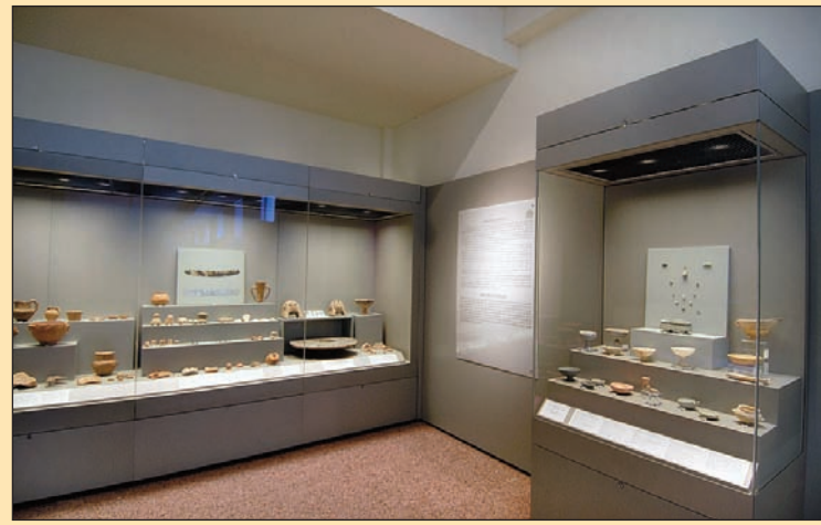
6. Κυκλαδική Αίθουσα. Οι πρωτοκυκλαδικοί οικισμοί και τα λίθινα σκεύη, 2004.

βαριά βικτωριανή αυστηρότητα εβάρυε επάνω στα αρχαία», η κυριαρχία του υπερβολικού διάκοσμου της αίθουσας δεν επέτρεπε την ανάδειξη των αρχαίων. 3 Τότε η Μυκηναϊκή Αίθουσα απέκτησε τη μόνιμη μεταπολεμική μορφή της. Συστηματικές εργασίες βελτίωσης της έκθεσης σε όλες τις αίθουσες της Προϊστορικής Συλλογής πραγματοποιήθηκαν κατά το διάστημα 1992-1995 από την Κ. Δημακοπούλου. 4