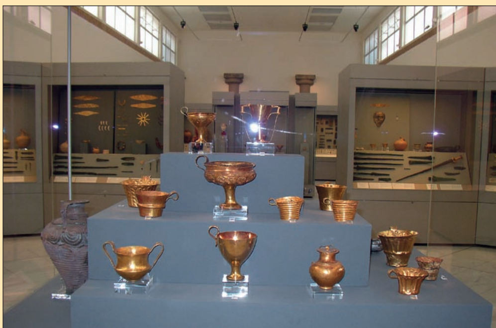
4. Μυκηναϊκή Αίθουσα. Χρυσά και αργυρά σκεύη από τους βασιλικούς τάφους, 2004.