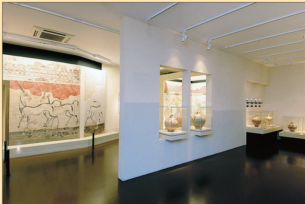
8. Αίθουσα της Θήρας. Οι τοιχογραφίες και τα αγγεία των δελφινιών, 2005.

τικές προθήκες για τη λιθοτεχνία (εικ. 6), τη μεταλλοτεχνία, τις εξωτερικές σχέσεις και επιρροές του κυκλαδικού πολιτισμού, όπου παρουσιάζονται και έργα από την Ακρόπολη των Αθηνών. Στη δεύτερη ενότητα παρουσιάζονται τα ευρήματα από τις ανασκαφές του σημαντικού οικισμού στη Φυλακωπή Μήλου που χρονολογούνται από την Πρωτοκυκλαδική ΙΙΙ περίοδο έως το τέλος της Μυκηναϊκής εποχής, ανάμεσα τους και γνωστές τοιχογραφίες του 16ου αι. π.Χ.