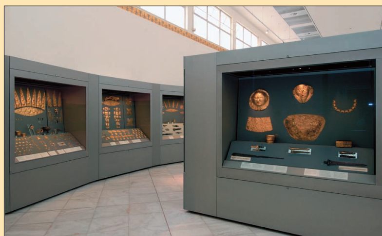
3. Μυκηναϊκή Αίθουσα. Η ενότητα των βασιλικών τάφων των Μυκηνών, 2004.

Η πρώτη παρουσίαση των θησαυρών από την ανασκαφή του Ταφικού Κύκλου Α των Μυκηνών πραγματοποιείται ήδη το 1877 στην Εθνική Τράπεζα. Το 1880 οργανώνεται, με την επιμέλεια του Παναγ. Σταματάκη, επίτητη της ανασκαφής του Ε. Σλήμαν στις Μυκήνες, και με τη χρηματοδότηση της Αρχαιολογικής Εταιρείας, η πρώτη συστηματική έκθεσή τους στο Πολυτεχνείο. Κατά τα έτη 1892-1893, τα μυκηναϊκά αρχαία μεταφέρονται στο Εθνικό Αρχαιολογικό Μουσείο, παρουσιάζονται στην κεντρική του αίθουσα από τον Παναγιώτη Καββαδία, τότε Διευθυντή του Μουσείου, και περιλαμβάνονται στον αρχαιολογικό οδηγό που ο ίδιος εξέδωσε το 1894. Με υπερηφάνεια αναφέρεται ο Καββαδίας στους τοιχογραφημένους τοίχους και την οροφή της Μυκηναϊκής Αίθουσας, όπως παρουσιάζονται σε φωτογραφία του 1910 (εικ. 1). Τα ποικίλα διακοσμητικά θέματα αναπαράγουν μοτίβα της μυκηναϊκής τέχνης, σύμφωνα με τα σχέδια του αρχιτέκτονα G. Kaverau. Ο Χρ. Τσού-