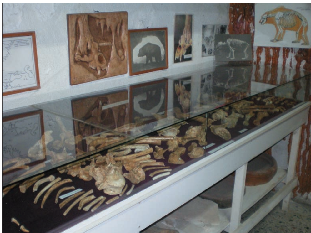
2. Εκθέματα του Παλαιοντολογικού και Λαογραφικού Μουσείου Αλμωπίας.

τον 6ο αι. π.Χ. Ο γεωγράφος του 2ου αι. μ.Χ., Κλαύδιος Πτολεμαίος, αναφέρει στη Γεωγραφική Υφήγηση τα ονόματα δύο άλλων πόλεων (III, 12, 21) και ο Ιεροκλής, στον Συνέκδημο (638, 10), στον κατάλογο των πόλεων της Μακεδονίας του 6ου αι. μ.Χ., αναφέρει το όνομα Αλμωπία για όλη την περιοχή. Από τους ξένους περιηγητές του 19ου αι., ο Άγγλος συνταγματάρχης W.M. Leake, είναι ο πρώτος που συνδέει τον αρχαίο τόπο με τη σημερινή Αλμωπία, ύστερα από περιοδεία του στη βόρεια Ελλάδα.