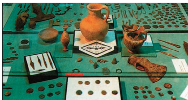
4. Η αρχαιολογική συλλογή του Παλαιοντολογικού και Λαογραφικού Μουσείου Αλμωπίας.

Διαμονή: Καταλύματα και πολλές σύγχρονες ξενοδοχειακές μονάδες με όλες τις σύγχρονες ανέσεις λειτουργούν καθ' όλη τη διάρκεια του έτους στο κοντινό χωριό Λουτράκι και στην Αριδαία και ανήκουν σε όλες τις κατηγορίες τιμών.