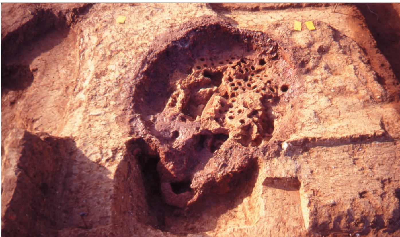
5. Ο κεραμικός κλίβανος της Αψάλου.