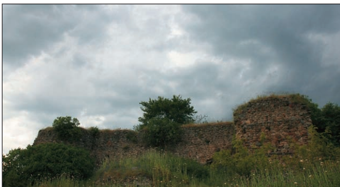
3. Το κάστρο Μογλενών στη Χρυσή.

νων. Μόλις το 1980, το Κάστρο της Χρυσής κηρύχθηκε ως αρχαιολογικός χώρος. Μέσα στο κάστρο έχει ανασκαφεί τμήμα εκκλησίας του 10ου αιώνα.