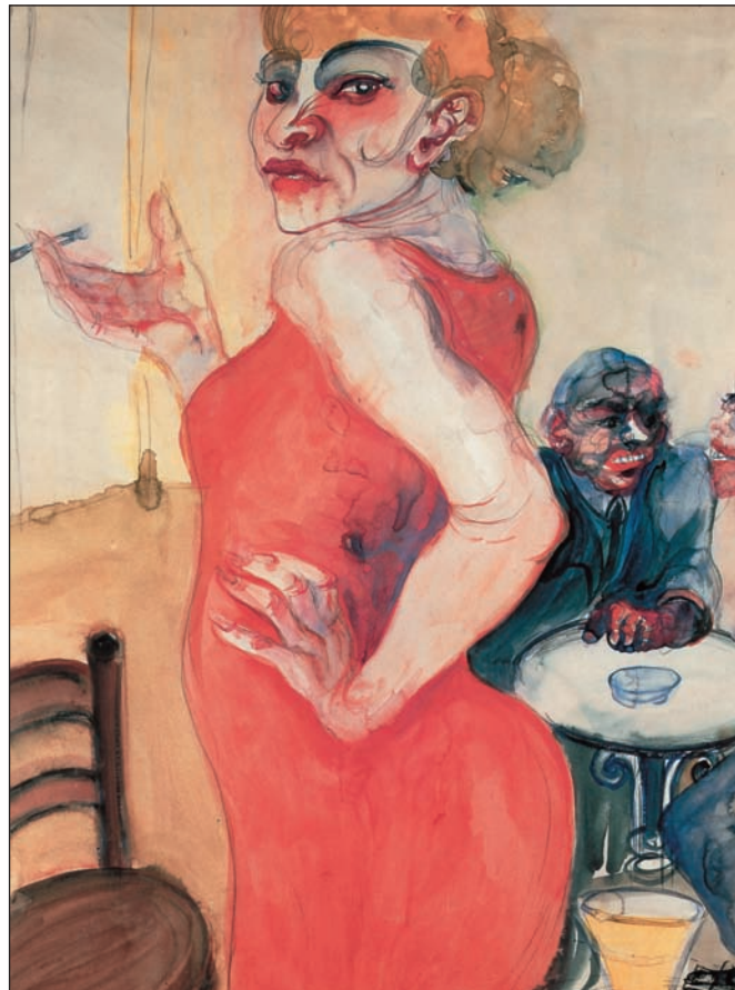
3. Elfriede Lohse-Wächtler, «Λίση», 1931. Ακουαρέλα, 68x49 εκ. Συλλογή Marvin και Janet Fishman, Μιλγουόκι.

Αν ο 19ος αιώνας μπορεί να χαρακτηριστεί νευρωτικός, το δεύτερο μισό του 20ού δικαιούται το χαρακτηρισμό του