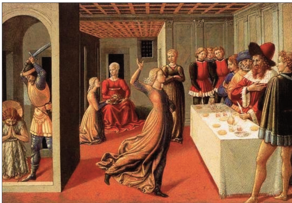
1. Benozzo Gozzoli, «Ο χορός της Σαλώμης», 1461-62. Ζωγραφική σε ξύλο, 23,8x34,3 εκ. National Gallery of Art, Ουάσινγκτον.

Σκοπός της διαφήμισης είναι η καταστροφή του νοήματος [...] Μέσω της διαφήμισης υφάινεται ένας κόσμος χωρίς κανένα απολύτως νόημα, που επιάρεται για