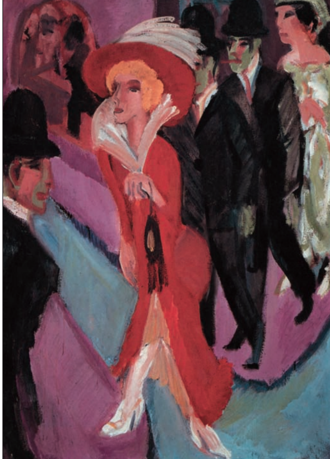
2. Ernst Ludwig Kirchner, «Δρόμος με κοκκινοντυμένη πόρνη», 1924-25. Λάδι, 120x90 εκ. Ιδιωτική Συλλογή.

την ίδια του την ανοησία. Ο κόσμος αυτός αποκλείει τον πόνο, το πένθος, το δέος, την αγάπη, την ντροπή [...] Ο κόσμος γίνεται ακατανόητος, ένα σπαστικό σύνολο από απολαύσεις που συσσωρεύονται άσκοπα, δημιουργώντας ένα κενό που συνεχώς μεγαλώνει. Ιερέας αυτού του κενού είναι η διαφήμιση [...] Κηρύττει την δικτατορία της μορφής κι έτσι, για πρώτη φορά στην Ιστορία, ο κόσμος μοιάζει να έχει πιαστεί στο δίκτυο του ιστού της παραίσθησης. 2