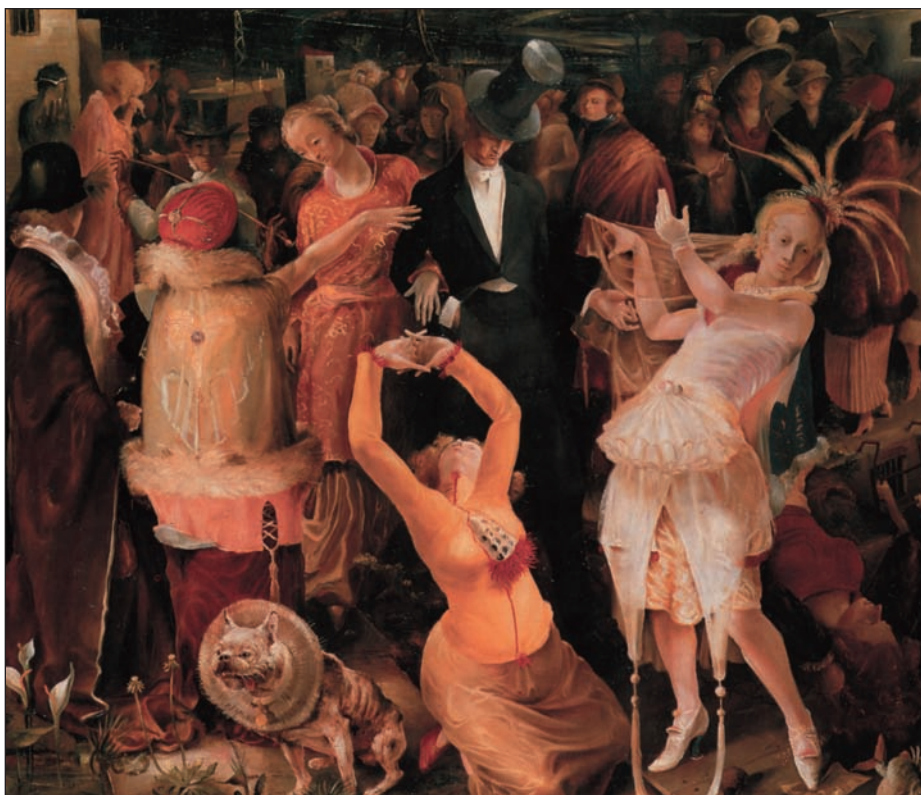
6. Gert Wollheim, «Αποχαιρετισμός στο Ντύσελντορφ», 1924. Λάδι σε μουσαμά, 160x185 εκ. Kunstmuseum Düsseldorf im Ehrenhof, Ντύσελντορφ.

Πρώτη δημοσίευση του άρθρου στο βιβλίο μου Περάσματα στην απέναντι όχθη , Εν πλω, Αθήνα 2007, σ. 225-238.