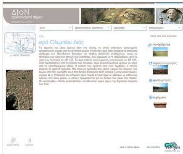
3. Παράδειγμα οθόνης παρουσίασης ενός μνημείου του αρχαιολογικού χώρου, του ιερού του Ολυμπίου Διός.

Τη γεωγραφική πρόσβαση συμπληρώνουν τέσσερις ενότητες: Δίον, Αρχαιολογικός περίπατος, Ευρήματα, Πληροφορίες. Η ενότητα «Δίον» περιλαμβάνει εισαγωγική παρουσίαση, πληροφορίες για τη γεωγραφική θέση, την ιστορία, το χρονικό των ανασκαφών, για το αρχαιολογικό πάρκο και το αρχαιολογικό μουσείο και παρουσίαση του ανασκαφικού έργου. Με εξαίρεση την τελευταία υποενότητα, που περιέχει βίντεο με συνέντευξη του ανασκαφέα, καθηγητή Δ. Παντερμαλή, οι υπόλοιπες περιορίζονται σε ένα πολύ σύντομο κείμενο και συνοδευτικές εικόνες με λεζάντες, πάντα με κίνηση. Η ενότητα «Αρχαιολογικός περίπα-