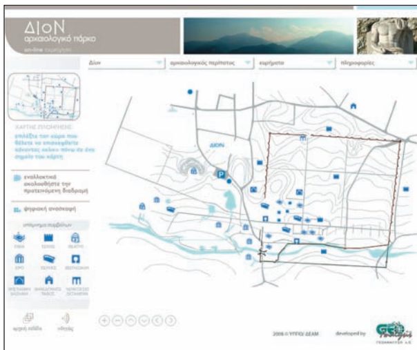
2. Η κύρια πρόσβαση στην online περιήγηση στο αρχαίο Δίον, από το διαδραστικό τοπογραφικό διάγραμμα του αρχαιολογικού πάρκου.

του αρχαιολογικού χώρου ή ειδικά για την εφαρμογή πολυμέσων: βίντεο, φωτογραφικά άλμπουμ με κίνηση (slideshow), κείμενα, αφηγήσεις, τοπογραφικό διάγραμμα του αρχαιολογικού πάρκου, φωτογραφίες των μνημείων και των ευρημάτων, διαδραστικά πανοράματα, σχεδιαστικές και τρισδιάστατες φωτορεαλιστικές αναπαραστάσεις μνημείων, αεροφωτογραφίες του αρχαιολογικού χώρου.