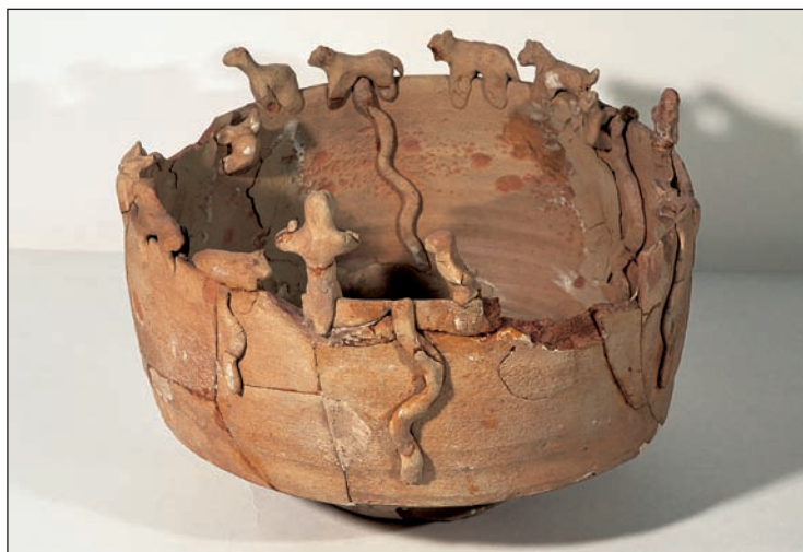
5. Τελετουργικό αγγείο.

Οι αρχαίοι φαίνεται ότι είχαν ειδικές αίθουσες για την παραγωγή Σόμα/Χαόμα, όπου τα δάπεδα και οι τοίχοι ήταν πλήρως καλυμμένοι με λευκό γύψο. Οι αίθουσες αυτές αποκαλούνταν συμβατικά «λευκές αίθουσες». Ήταν σκαμμένες στο κέντρο των ναών Τογκολόκ-1 και Τογκολόκ-21, καθώς και στο τέμενος της Γκονούρ. Πιθανότατα σε όλους τους ναούς δίπλα στις «λευκές αίθουσες» υπήρχαν συγκροτήματα τύπου «αυλή