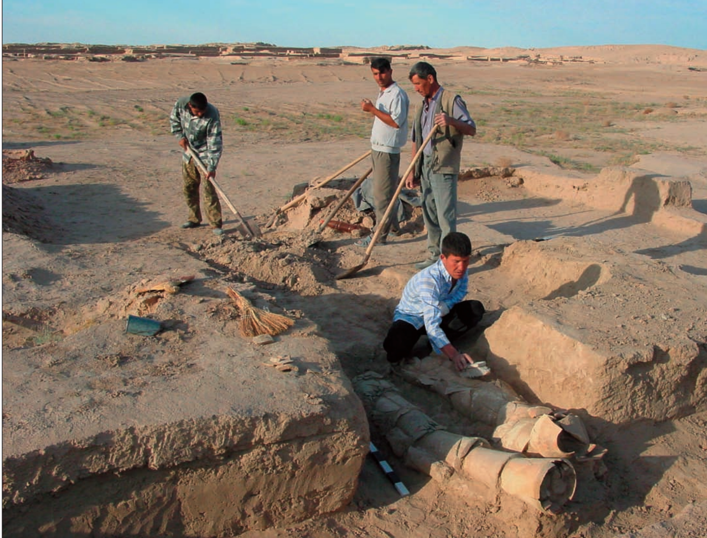
3. Kobur, στο πεδίο 8 της ανασκαφής.

«μεγάλη δεξαμενή» υποχωρούσε προσπαθούσαν να σταματήσουν τη «διαρροή» κατασκευάζοντας δίπλα και κάτω από αυτήν ορισμένες τάφρους με τελετουργικές εστίες. Και αντίθετα με τις συνηθισμένες εστίες δύο θαλάμων αυτές κατασκευάζονταν απευθείας στο έδαφος.