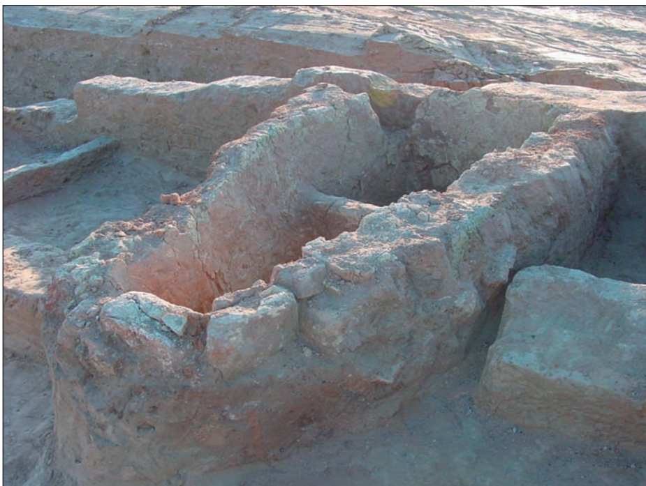
2. Απίσχημη εστία.

Σε κάθε έναν από τους βωμούς είχαν σκαφτεί θάλαμοι (διαστάσεων 2x2 μ.) σε βάθος πάνω από ένα μέτρο. Ο μικρότερος, τέταρτος βωμός ήταν τοποθετημένος κάθετα στους υπόλοιπους, κάτι που εξηγείται από την έλλειψη χώρου. Μπορεί να υποθέσει κανείς ότι οι βωμοί ήταν εσκεμμένα «κρυμμένοι» από τα αδιάκριτα βλέμματα των μυημένων, αφού βρί-