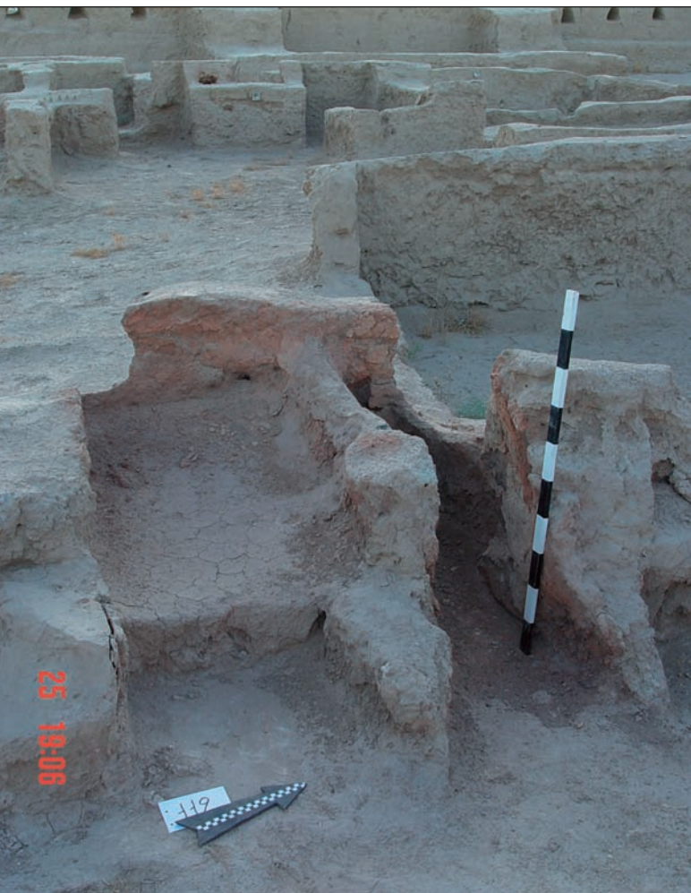
1. Τελετουργική δίχωρη εστία.

περιοχές αυτές, όμως, έγιναν σταδιακά ιδιαίτερα πυκνοκατοικημένες και τα μεταναστευτικά φύλα μετακινήθηκαν ακόμη μακρύτερα προς την Ανατολή και εγκαταστάθηκαν τελικά στη λεκάνη του αρχαίου δέλτα του ποταμού Μουργκάμπ, που πηγάζει στο Αφγανιστάν, στην οροσειρά Χίντου Κους, τον Παροπάμισο των αρχαίων. Έπειτα από ένα σύντομο διάστημα, δεκάδες και στη συνέχεια εκατοντάδες οικισμοί χτίστηκαν στα γόνιμα εδάφη του δέλτα. Τα πλησιέστερα χωράφια χρησιμοποιήθηκαν για την καλλιέργεια δημητριακών, όπως σάρι και κριθάρι, και τα πολυάριθμα κοπάδια εξημερωμένων βοδιών έβρισκαν άφθονη τροφή στα λιβάδια. Σταδιακά διαμορφώθηκε στην περιοχή μια νέα ανατολική χώρα ομοσπονδιακού τύπου με πολύ ανεπτυγμένο πολιτισμό.