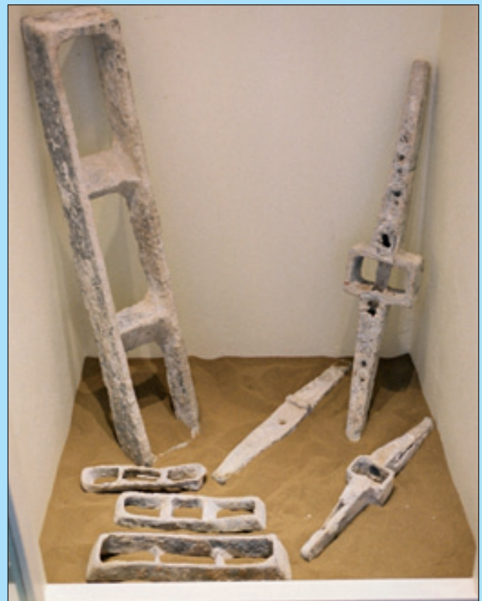
3. Μολύβδινοι στύποι και σύνδεσμοι αγκυρών (κάτω φωτογραφία) και αναπαράσταση αγκυρών (επάνω φωτογραφία).

κιλία μορφών και μεγεθών, αφού αποτελούσαν το κυριότερο είδος δοχείου για μεταφορές. Η αντικατάστασή τους από το «βουτσίον», το ξύλινο βαρέλι, έγινε σταδιακά κατά τους τελευταίους αιώνες του Βυζαντίου.