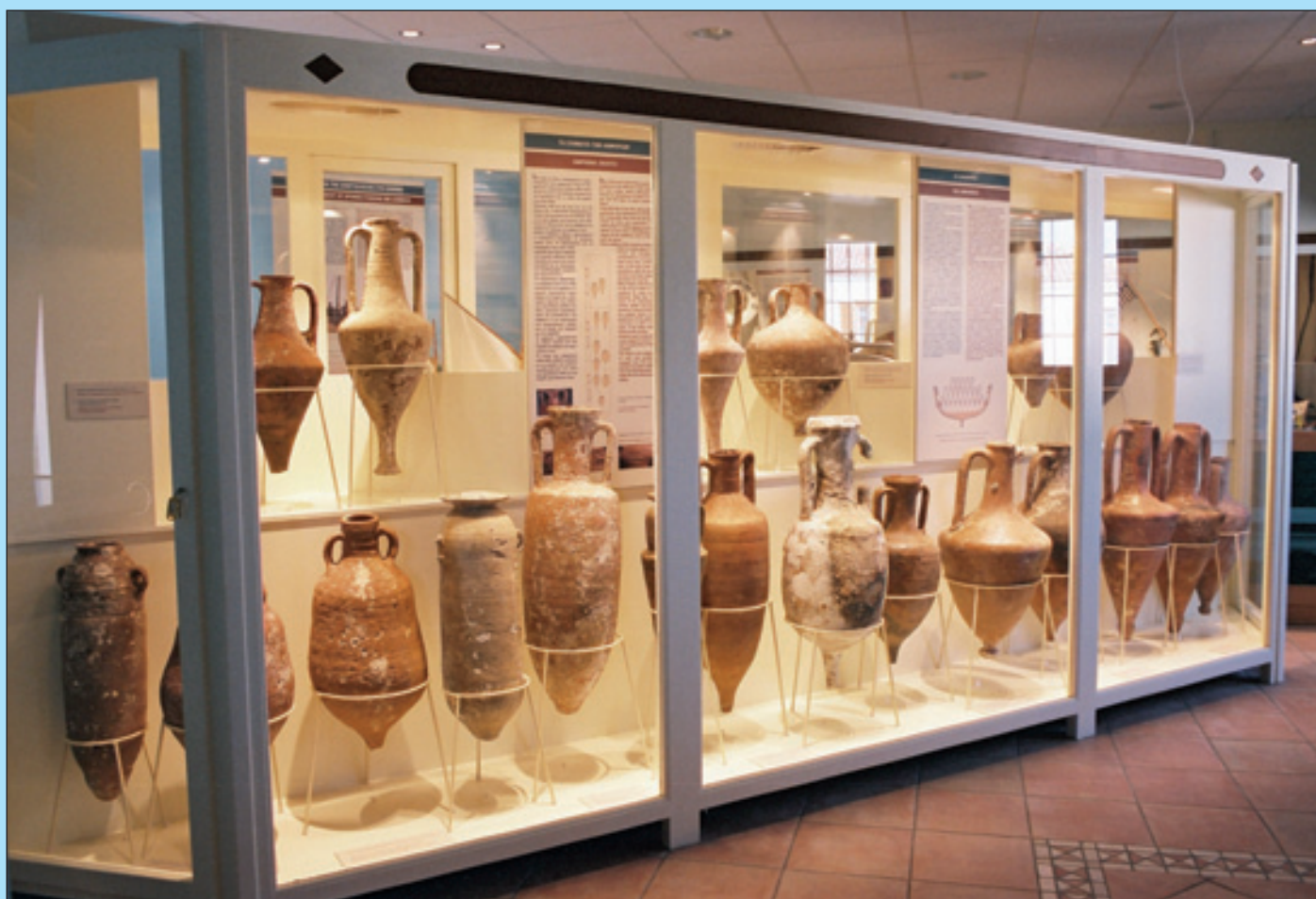
4. Οι αμφορείς της Αρχαιολογικής Συλλογής Νέας Κούταλης, όπως εκτίθενται σύμφωνα με την περιοχή προέλευσής τους και τη χρονολογία τους.

Αναφέρεται ότι η εμπορική ναυτιλία της Κούταλης υπέστη τεράστιο πλήγμα τον Ιανουάριο του 1862, όταν σε μια χιονοθύελλα βυθίστηκε αύτανδρο το καράβι του Μπούμπα στο ταξίδι του από την Κούταλη στην Κωνσταντινούπολη. Στο ναυάγιο χάθηκαν οι περισσότεροι από τους έμπειρους κουταλιανούς καπεταναίους που πήγαιναν να βρουν τα αγκυροβολημένα στην Κωνσταντινούπολη καράβια τους. Το τραγικό γεγονός στερήσε το νησί από ανθρώπους που θα μπορούσαν να προσαρμόσουν τη ναυτιλία του στη νέα τεχνολογία της αυτοκίνησης. Το εμπορικό ναυτικό του νησιού δεν μπόρεσε να αναλάβει και η ποντοπόρα ναυτιλία της Κούταλης χάθηκε μαζί με τα ιστιοφόρα.