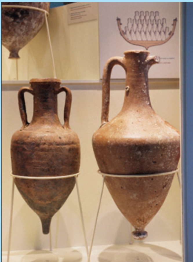
5. Ροδιακοί αμφορείς από την Αρχαιολογική Συλλογή της Νέας Κούταλης.

Οι Κουταλιανοί, μετά την παρακμή του εμπορικού τους στόλου, επιδόθηκαν κυρίως στη σπογγαλιεία και την αλιεία που ασκούσαν ήδη από παλιά. Είναι γνωστό ότι η Κούταλη αποτελούσε τη μεγαλύτερη αγορά νωπών ψαριών στην Προποντίδα, αφού συγκέντρωνε τα αλιεύματα των γειτονικών περιοχών. Καθημερινά διακινούνταν από εκεί μεγάλες ποσότητες ψαριών προς την Κωνσταντινούπολη και άλλα αστικά κέντρα της Οθωμανικής Αυτοκρατορίας. Στο νησί υπήρχαν ακόμη βιοτεχνίες για το πάστωμα ψαριών, τα οποία επίσης εξαγόταν.