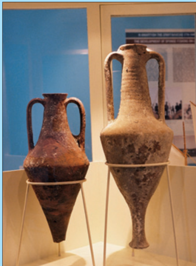
6. Θασιακοί αμφορείς από την Αρχαιολογική Συλλογή της Νέας Κούταλης.

Στη Νέα Κούταλη, όπως και σε άλλα χωριά της Λήμνου,