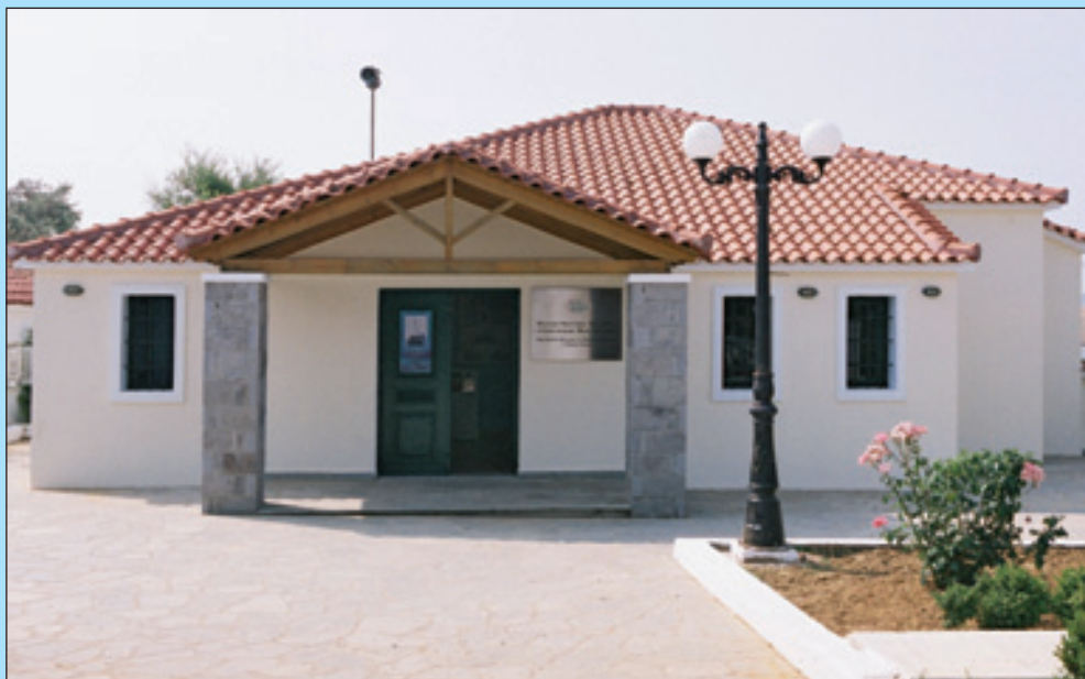
1. Το Μουσείο Ναυτικής Παράδοσης και Σπογγαλιείας Νέας Κούταλης.

«Διορίστηκα το 1945 εδώ στην Κούταλη στη Λήμνο... Τα βράδια στο καφενείο μόνος μου, εικοσιπεντάρης τότε, μου φλόγιζαν τη φαντασία μου οι δύτες, τι έβλεπαν και τι συνα-