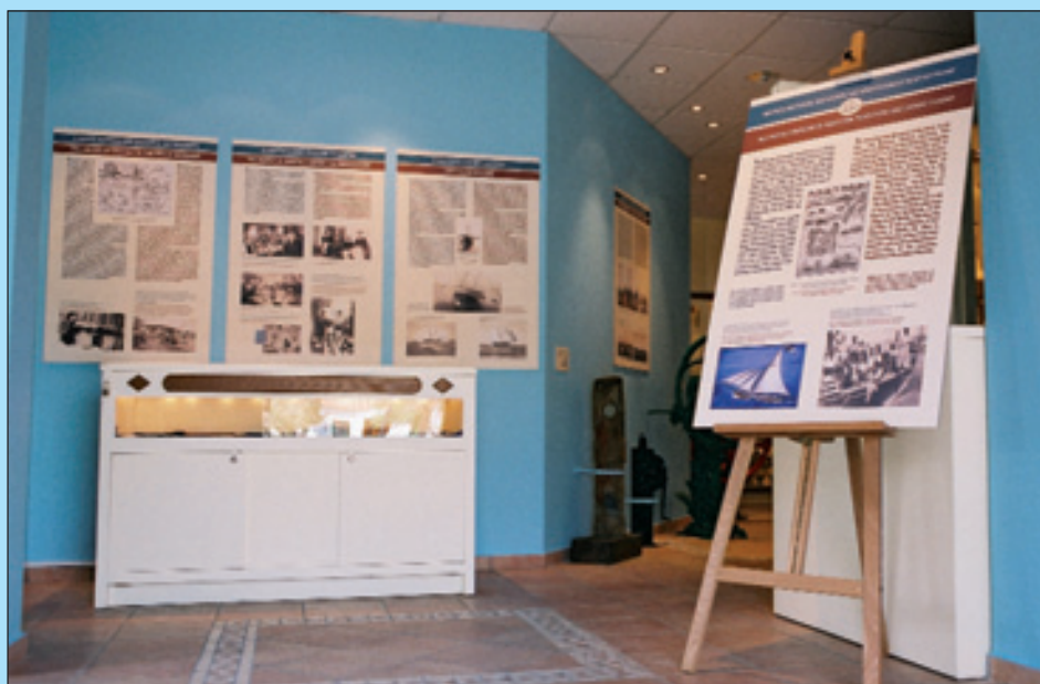
7. Εσωτερική άποψη του Μουσείου Ναυτικής Παράδοσης και Σπογγαλείας Νέας Κούταλης.

οι Κουταλιανοί είχαν περίπου τριάντα πέντε σφουγγαράδικα που ήταν όλα «αχταρμάδες», κατασκευασμένα στην Ύδρα, στη Σύμη, στην Κάλυμνο και στον Πειραιά.