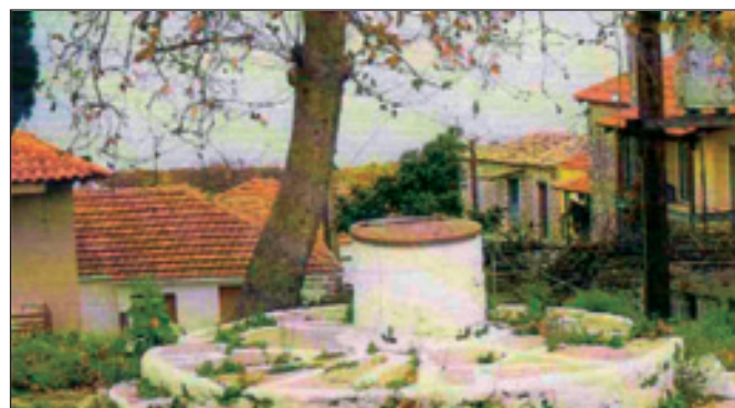
9. Κορακονησία. Το Πηγάδι του Οσίου Ονουφρίου.