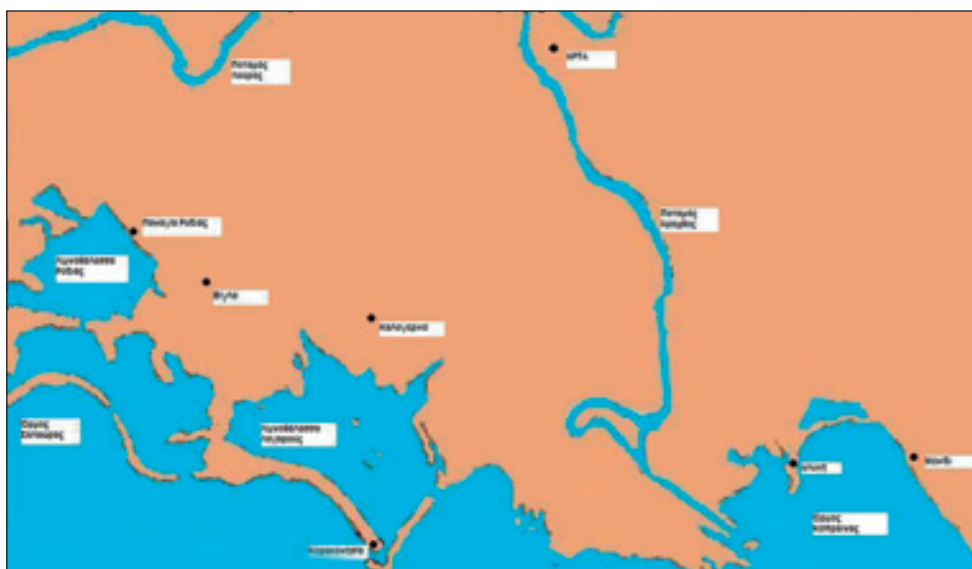
1. Τοπογραφικό ευρύτερης περιοχής Κορακονησίας.

Κυριακός από την Αγκώνα της Ιταλίας, περιγράφει ένα κυνήγι του δεσπότη Καρόλου II Τόκκο στην Κορακονησία και αναφέρει ότι ο Κάρολος και η συνοδεία του παρακολούθησαν τη λειτουργία που έγινε στο ναό της Παναγίας και φιλοξενήθηκαν στη μονή. Η Μονή Κορακονησίας είχε μεγάλη κτηματική περιουσία στις απέναντι ακτές της Αιτωλοακαρνανίας και ήταν γνωστή για τα χελοκοφινοβίβα (εκτροφεία χελιών) που είχε στον Αμβρακικό. Στη διένεξη που είχαν οι μοναχοί της με τους κατοίκους της Βόνιτσας για τα εκτροφεία αυτά, αναφέρεται σε επιστολή του ο πατριάρχης Ιερεμίας Α', το 1530.