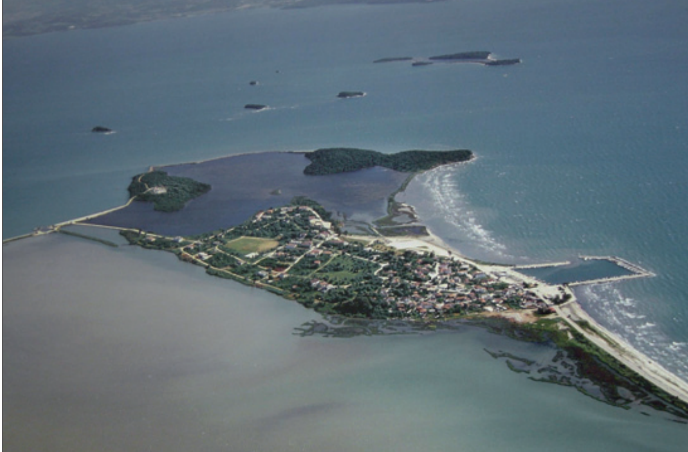
2. Κορακονησία. Άποψη από αέρος.

Μια σειρά από έγγραφα 4 που προέρχονται από το μοναστήρι της Αγίας Παρασκευής στο Μυρτάρι της Βόνιτσας και τα οποία χρονολογούνται από τις αρχές του 16ου έως και τον 18ο αιώνα, μας δίνουν αρκετές πληροφορίες για την κτηματική περιουσία της Μονής Κορακονησίας, η οποία περιελάμβανε δάση, κτήματα, αμπέλια κ.λπ. στην περιοχή της Βόνιτσας.