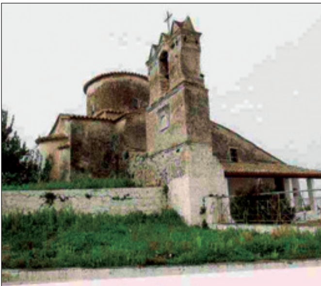
4. Παναγία Κορακονησίας. Βορειοανατολική πλευρά.

του Κόλπου ή η αλυκή Αγίου Νικολάου Βόνιτσας στη νότια πλευρά του. Για τις αλυκές της Κόπραινας στις αρχές του 20ού αιώνα, βλ. Κ.Α. Στασινόπουλος, Το άλας και οι αλυκές της Ελλάδος , Αθήνα 1906, σ. 51. Το αλάτι, θαλασσινό προϊόν δευτερογενούς παραγωγής, είναι από τα πλέον αποδοτικά εμπορεύματα. Η Βενετία ήδη από τον 14ο-15ο αι. είναι, ως γνωστόν, ο μοχλός του εμπορίου του άλατος, σε βαθμό που να ελέγχει την προσφορά και τη ζήτηση. Το αλάτι της περιοχής του Αμβρακικού ήταν ποιοτικά ανώτερο από το κερκυραϊκό αλάτι, που κάποτε οι Βενετοί αντάλλαζαν με σιτηρά. Για το τοπωνύμιο Σαλαώρα (η), βλ. Σεραφείμ Ξενοπούλος-Βυζάντιος (συμπληρώσεις Γιάννη Τσουτσίνου), Δοκίμιον ιστορικής τινός περιλήψεως της ποτέ αρχαίας και εγκρίτου ηπειρωτικής πόλεως Άρτης , Άρτα 1962, σ. 10, σημ. 23. Για τις αλυκές του Αμβρακικού, βλ. Ελένη Γιαννακοπούλου, «Το αλάτι, μεσογειακό προϊόν ανταγωνισμού: Η περίπτωση της Δυτικής Ελλάδας (15ος-19ος αιώνας)», Το Ελληνικό Αλάτι, Η Τριήμερο Εργασίας, Μπιλήνη, 6-8 Νοεμβρίου 1998 , Πολιτιστικό Τεχνολογικό Ίδρυμα ΕΤΒΑ, Αθήνα 2001, σ. 138-139 και 140-141.