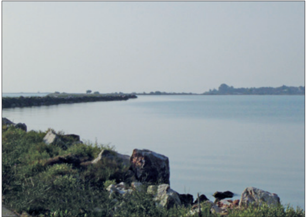
3. Κορακονησία. Το «Ράμμα».

1 Σαλαώρα (η): Σαλ-αγορά, δηλαδή αγορά αλατιού, που παραγόταν στις αλυκές του Αμβρακικού, όπως αυτή της Κόπραινας, που λειτουργούσε από τον 15ο έως και τις πρώτες δεκαετίες του 20ού αιώνα στη βόρεια πλευρά