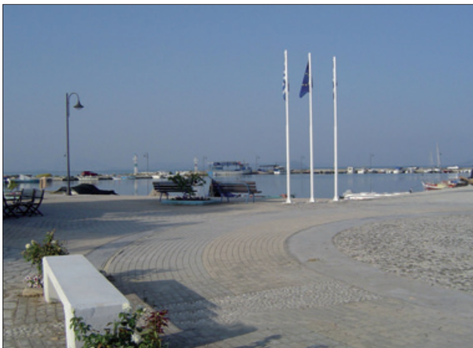
8. Κορακονησία. Το λιμανάκι.

11 Για τη λανθασμένη απόδοση του ονόματος ως «Κορωνησία», βλ. Ηλ. Βασιλάς, Ηπειρωτική Εστία 4 (1955), σ. 467-468.