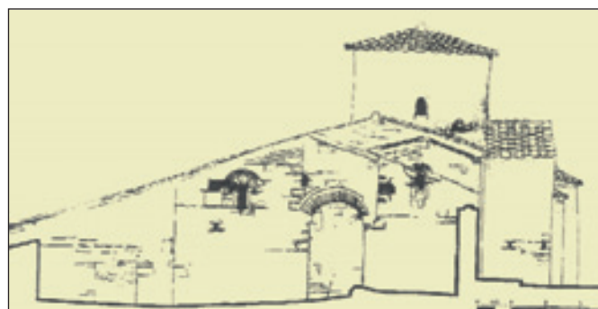
7. Παναγία Κορακονησίας. Νότια όψη.

2 Σεραφεΐμ Ξενόπουλος-Βυζάντιος, Δοκίμιον Ιστορικών Περί Άρτης και Πρεβέζης , Αθήνα 1884, Άρτα 20033, σ. 43, 46.