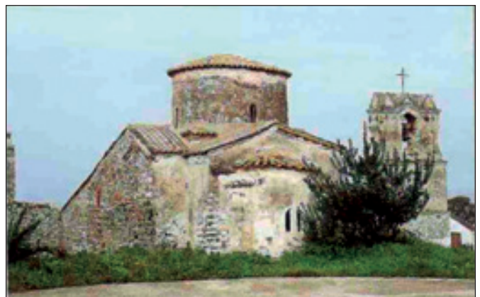
5. Παναγία Κορακονησίας. Νοτιοανατολική πλευρά.