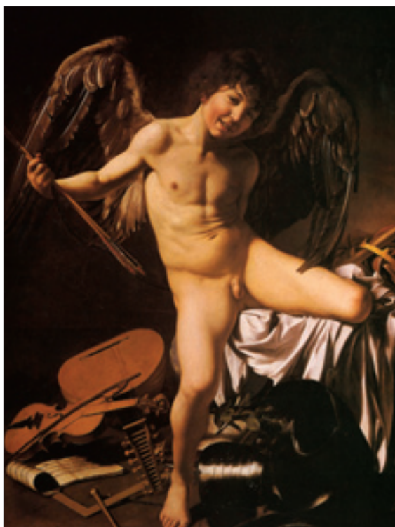
1. Caravaggio, «Έρωτας», περ. 1601-2, λάδι, 191x148 εκ., Staatliche Museen, Βερολίνο. Ονομάζεται επίσης «Νικηφόρος Έρωτας» και «Θριαμβευτής Έρωτας». Ποδοπατάει εκφράσεις του πολιτισμού (τέχνες, επιστήμες, εξουσία) και θριαμβεύει πάνω τους.

Σ' αυτόν λοιπόν το θεό θα αφιερώσουμε τρία συνεχόμενα τεύχη του περιοδικού, αρχής γενομένης από αυτό που κρατάτε στα χέρια σας. 2 Σ' αυτόν τον τόσο ανθρώπινο, τον πιο ανθρώπινο μάλλον απ' όλους τους θεούς, διότι αδιαφορεί εάν τα πρόσωπα που έλκονται είναι του ίδιου ή διαφορετικού φύλου, αδιαφορεί για την ηλικία, ακόμα και για την εξωτερική μορφή – «εγώ νομίζω πως εδώ, σ' αυτή τη γη τη μαύρη, εκείνο είναι ομορφότερο, ό,τι ποθεί ο καθένας», θα πει η Σαπφώ, 3 δείχνοντάς μας ότι ο έρωτας αποτελεί περισσότερο μια φυσική ζωική δύναμη παρά μια πολιτισμική σύμβαση, παρόλο που του φορτώσαμε και απ' αυτές. Βρίσκεται κοντά σε κάτι αρχέγονο, δηλαδή στην ίδια τη