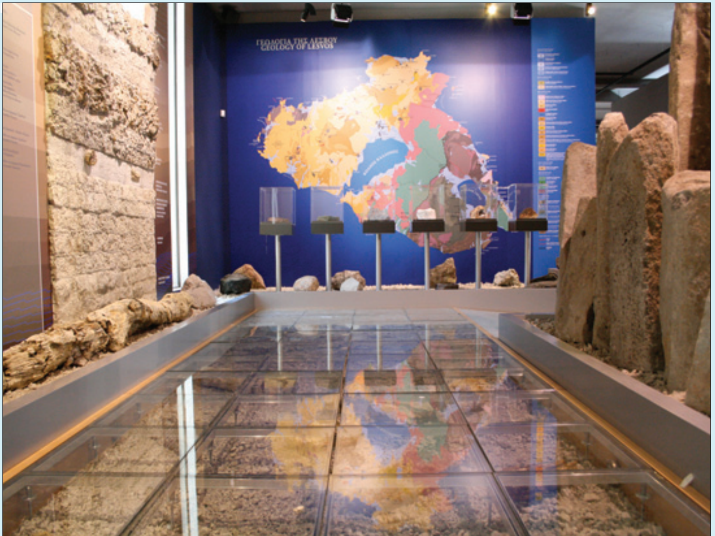
6. Αίθουσα εξέλιξης του Αιγαίου: Στρωματογραφική στήλη και στηλοειδείς λάβες και γεωλογικός χάρτης Λέσβου.

Επίσης, στον περιβάλλοντα χώρο του Μουσείου έχει κατασκευαστεί πρόπλασμα ηφαιστειακού κώνου, όπου προκαλούνται τεχνητές ηφαιστειακές εκρήξεις, φέρνοντας σε επαφή τα παιδιά με γεωλογικά φαινόμενα που δεν μπορούν άμεσα να παρατηρήσουν.