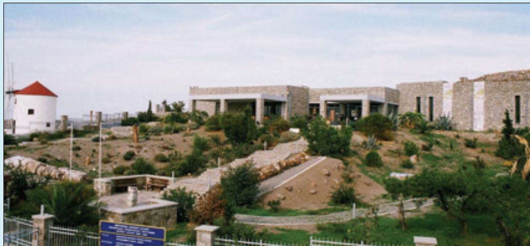
1. Εξωτερική άποψη του μουσείου.

πρώτους μονοκύτταρους οργανισμούς που εμφανίστηκαν στον πλανήτη μας, πριν από 3,5 δισεκατομμύρια χρόνια, μέχρι την εμφάνιση του σύγχρονου ανθρώπου. Παρουσιάζονται οι αναπαραστάσεις των παλαιοπεριβαλλόντων και οι πιο χαρακτηριστικοί ζωικοί και φυτικοί οργανισμοί που εμφανίστηκαν πάνω στη γη την αντίστοιχη γεωλογική περίοδο. Τα εκθέματα περιλαμβάνουν χαρακτηριστικά ευρήματα από όλες τις γεωλογικές περιόδους, από τους αρχαιότερους μονοκύτταρους οργανισμούς (π.χ. στρωματόλιθοι) και απολιθώματα των πιο πρωτόγονων πολυκύτταρων ζωικών οργανισμών (π.χ. τριλοβίτες) που έζησαν στις αρχαίες θάλασσες πολύ πριν εμφανιστούν τα πρώτα φυτά, μέχρι τα πιο χαρακτηριστικά ανεπτυγμένα χερσαία φυτά κάθε γεωλογικής περιόδου, από την εμφάνισή τους στον πλανήτη (πριν από περίπου 400 εκατομμύρια χρόνια) μέχρι το τέλος του Μεσοζωικού αιώνα (πριν από περίπου 65 εκατομμύρια χρόνια).