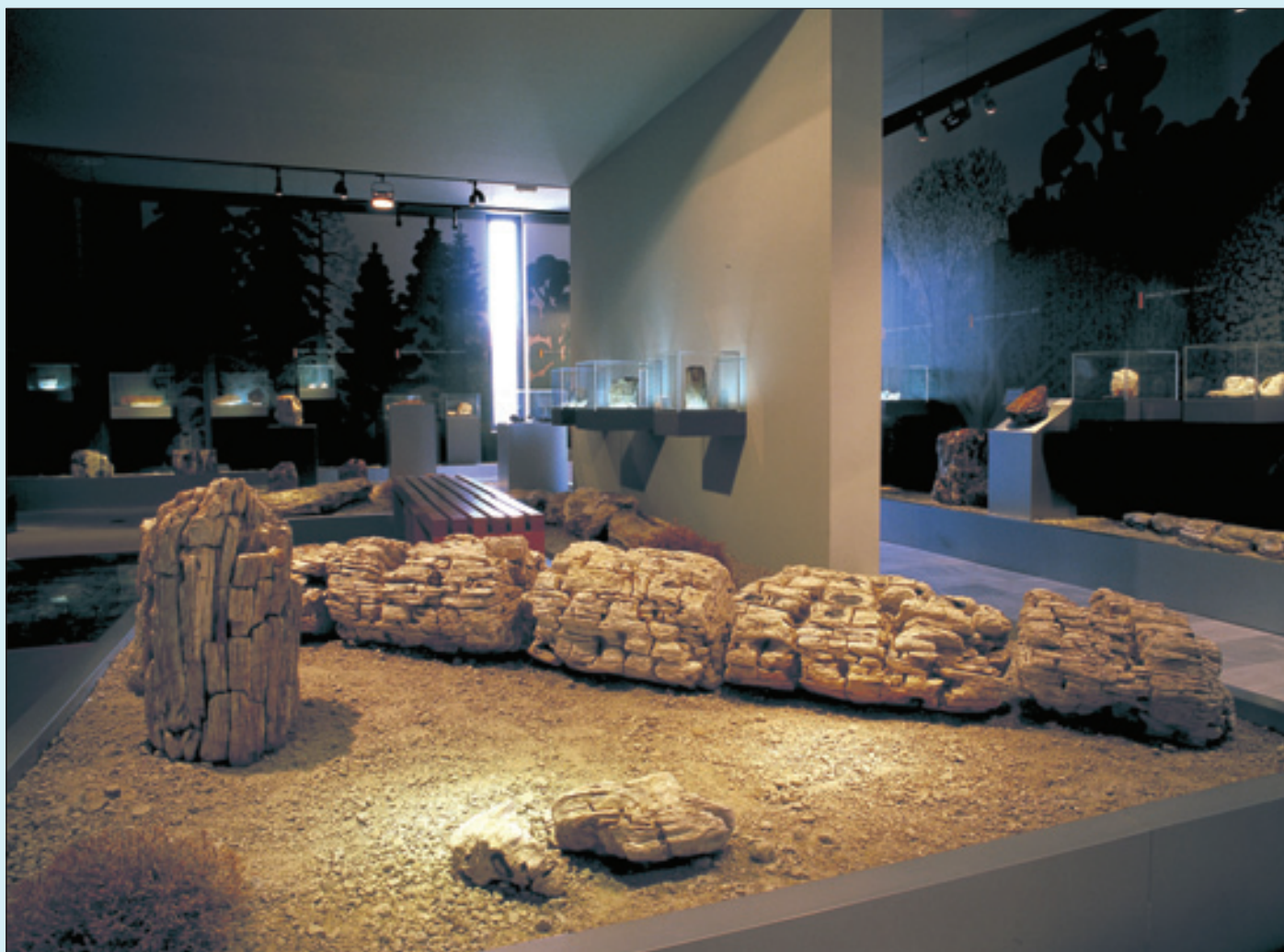
5. Αίθουσα Απολιθωμένου Δάσους: Υποθαλάσσια ευρήματα.

Στον περιβάλλοντα χώρο του Μουσείου έχει κατασκευαστεί πρότυπος ανασκαφικός χώρος, το «Γεώγραμμα», που χρησιμοποιείται κατά τη διάρκεια εκπαιδευτικών προγραμμάτων. Τα παιδιά οδηγούνται στο σκάμμα αυτό και, χρησιμοποιώντας πραγματικά ανασκαφικά εργαλεία, σκάβουν για να βρουν φυτικά απολιθώματα.