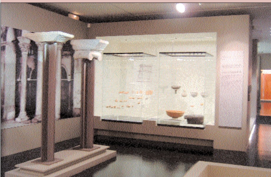
3. Άποψη της αίθουσας που είναι αφιερωμένη στη λατρεία κατά τους παλαιοχριστιανικούς χρόνους.

Στην αίθουσα που είναι αφιερωμένη στον βυζαντινό χώρο λατρείας δεσπόζει, στηριγμένο σε ειδικό ικρίωμα, το μαρμάρινο τέμπλο από το ναό του Ταξίαρχη της Άγναντης (12ος και τέλη 13ου-αρχές 14ου αι.), που ανασυντέθηκε από τα σωζόμενα μέλη του, με βάση πρόσφατη μελέτη. Η ενότητα συμπληρώνεται με τα σωζόμενα αρχιτεκτονικά μέλη από τον κατεστραμμένο σήμερα ναό της Μεταμόρφωσης του Σωτήρος Αλεποσπίτων (12ος αι.).