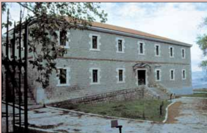
1. Άποψη του αναστηλωμένου κτηρίου των Στρατώνων στην Υπάτη, το οποίο στεγάζει το Βυζαντινό Μουσείο Φθιώτιδας.

Το Βυζαντινό Μουσείο Φθιώτιδας δημιουργήθηκε με πρόθεση να φέρει τον επισκέπτη σε επαφή με τη ζωή που αναπτύχθηκε στην περιοχή κατά τους παλαιοχριστιανικούς και βυζαντινούς χρόνους. Η επιλογή των αντικειμένων και του τρόπου έκθεσής τους έγινε με γνώμονα όχι τη χάραξη μιας αδιάλειπτης ιστορικής συνέχειας, αλλά την τεκμηρίωση του τρόπου ζωής, του επιπέδου τεχνικής κατάρτισης και της ιδεολογίας της κοινωνίας που τα παρήγαγε. Το υλικό προέρχεται από ανασκαφικές έρευνες των τελευταίων δεκαετιών κυρίως στη βασιλική των Δαφνουσίων (Αγ. Αικατερίνη Αρκίτσας) και τα γειτονικά της κτίσματα, στην Υπάτη, το Θαυμακό, την Πελασγία και τον Αχινό, καθώς και από αντικείμενα μικροτεχνίας και αρχιτεκτονικά μέλη που φυλάσσονταν στις αποθήκες της ΙΔ' Εφορείας Προϊστορικών & Κλασικών Αρχαιοτήτων, στο Μουσείο Λαμίας και την Αρχαι-