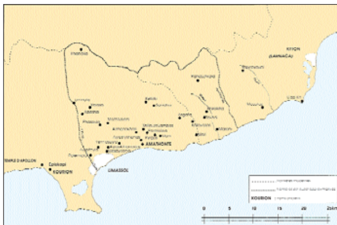
2. Χάρτης του βασιλείου της αρχαίας Αμαθούτος (σχέδιο: V. Anagnostopoulos).

κώδικες RAK του έργου, 3 ενώ προστίθενται στον κώδικα C. 4 Το ίδιο συμβαίνει και με τη γραφή δεκατρείς. Από την άλλη μεριά, ο κώδικας A παραδίδει τη γραφή δεκατρείς ολογράφως, οι κώδικες RK τη lectio ιγ', με το αριθμητικό, ενώ ο κώδικας C δεκαπέντε, σε πλήρη συμφωνία με την προσθήκη του Κούριον και Νέμευος. Αντιλαμβάνεται κανείς ότι υπάρχει πρόβλημα κριτικής αποκατάστασης του κειμένου. 5 Είναι γεγονός ότι υπάρχουν αρκετές περιπτώσεις στις οποίες επιβεβαιώνεται ότι ο κώδικας C προέρχεται απευθείας από το πρωτότυπο του Πορφυρογέννη-