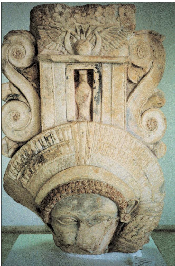
9. Επίκρανο αμφίοπτως παραστάδος με κεφαλή της θεάς Αθώρ που φορά στέμμα και επιστέφεται από την πρόσοψη ενός αιγυπτιακού τύπου ιερού, στη θύρα του οποίου προβάλλει όρθια μια γυναικεία μορφή· δεξιά και αριστερά του πυλώνος αναπτύσσονται καθέτως σιγμοειδείς έλικες τύπου «ιωνικού» κιονόκρανου· στην κορυφή σύμβολα της αιγυπτιακής θρησκείας, και στη ζώνη της άβακος διακοσμητικοί ρόδακες «ασσυριακού-περσικού» τύπου. Χρονολογείται γύρω στο 480 π.Χ. Μουσείο Λεμεσού.

βάρων ειδικά για τον Μαραθώνα. Κι αυτό γιατί η Νέμεσις γεννιέται στα πρώτα χρόνια του Πελοποννησιακού πολέμου και δεν μπορεί να πέρασαν τόσα πολλά χρόνια και να εξακολουθούσε να υπενθυμίζει το γεγονός του 490 π.Χ., πολύ περισσότερο επειδή το άγαλμα αποδόθηκε και στον Φειδία ενώ η «τεχνο-ιστορική» μελέτη των σπαραγμάτων δεν αφήνει καμιά αμφιβολία ότι είναι έργο του Αγοράκριτου του 430-420 π.Χ., όπως μαρτυρούν ο Στράβων, ο Πλίνιος και ο Ιωάννης Τζέτζης. Τίποτα δεν αποκλείει η αρχική ιδέα να οφείλεται όντως στον Φειδία, λίγο πριν μπου οι σκαλωσιές στον Παρθενώνα (447 π.Χ.), όπως αφήνουν να εννοηθεί ο Ζηνόβιος, ο Ησύχιος και η βυζαντινή Σούδα, και η ανάθεση από τον άγνωστο πολιτικό εντολέα να δόθηκε στον Φειδία πριν μεταφερθεί η παραγγελία από τον Φειδία στον Αγοράκριτο. Η ιστορία με τον πάριο λίθο που είχε μεί-