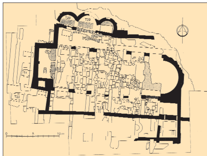
6. Αμαθούνς. Παλαιοχριστιανική Βασιλική του Αγίου Τύχωνος (φάση II).

από το όνομα του Αγίου Τύχωνος και του χωριού τού ίδιου να υποκρύπτεται ένα αρχαίο Τυχαίον των ρωμαϊκών τουλάχιστον χρόνων, όπως εκείνο στην Πάφο. 13