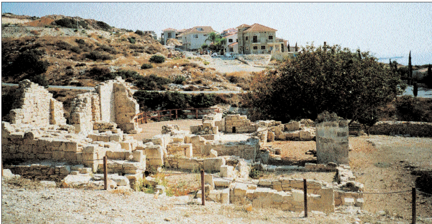
8. Άποψη των ερειπίων της φραγκικής εκκλησίας από τα νότια με θέα προς τη θάλασσα. Διακρίνεται ευκρινώς ο σωζόμενος σε αρκετό ύψος δυτικός τοίχος της φραγκικής εκκλησίας.

όχι, όσο ότι αυτό ακριβώς πίστευαν, γιατί αν ο Ηρόδοτος γνώριζε τους «κυπριακούς λόγους» τότε αυτά τα πράγματα τα γνώριζαν και οι Αθηναίοι του 450 π.Χ. Ο Th. Petit, βασιζόμενος στα «αιγυπτιαζόντα» στοιχεία της Αμαθούντος, προτείνει να ταυτιστούν οι Κύπριοι Αιθίοπες με τους Ετεοκύπριους αυτόχθονες της Αμαθούντος. Δεν βλέπω κανένα λόγο να μην υιοθετηθεί κανείς την ερμηνεία αυτή, εκτός κι αν υπάρχει δεύτερη πρόταση εξίσου καλά τεκμηριωμένη.