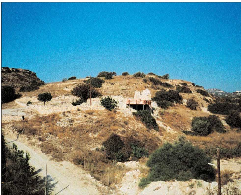
4. Γενική άποψη του χώρου της φραγκικής εκκλησίας του Αγίου Τύχωνος από τα βόρεια. Διακρίνεται το ύψωμα και ξεχωρίζει το στέγαστρο που καλύπτει την αφίδα της παλαιοχριστιανικής Βασιλικής· στα δεξιά της εικόνας η δυτική κλιτύς του λοφίσκου και στα αριστερά ο ευρύτερος χώρος που εξομαλύνθηκε για να κατασκευαστεί άνδρων.

ίερὸν Νεμέσεως, από το οποίο παρήχθη το τελικό μόρφωμα Νεμεσός. Το «λάθος» Νέμευος πρέπει συνεπώς να ερμηνευθεί ως εσφαλμένη αντιγραφή από το πρωτότυπο του αυτοκράτορα Πορφυρογέννητου. Από την άλλη μεριά, αυτό το υποθετικό «ιερόν Νεμέσεως», που θα βρισκόταν κάπου στην περιοχή της Λεμεσού, είναι δύσκολο να μη χρονολογείται στους ελληνορωμαϊκούς χρόνους. Πραγματικά δύσκολο όμως είναι να διαπιστωθεί αρχαιολογικά η παρουσία ενός αρχαίου ιερού Νεμέσεως στην ευρύτερη περιοχή της Λεμεσού χωρίς τη διεξαγωγή επιτόπιας έρευνας. Μόνον ο κατακερματισμός στη δημοσίευση των επιγραφών της Κύπρου δεν έχει επιτρέψει μέχρι τώρα την αξιοποίηση μιας σημαντικής επιγραφικής μαρτυρίας. 8 Η επιγραφή φυλάσσεται στο Μουσείο της Λευκωσίας και θεωρήθηκε από τον πρώτο εκδότη της, Th. Mitford, το 1946 ως αγνώστου προελεύσεως. Πρόκειται για βάση μικρού αγάλματος από πωρόλιθο (ύψος 0,18 μ., πλάτος 0,46 μ., βάθος 0,11 μ.), η οποία στην εμπρόσθια όψη φέρει το κείμενο που παρατίθεται σε παραπομπή. 9