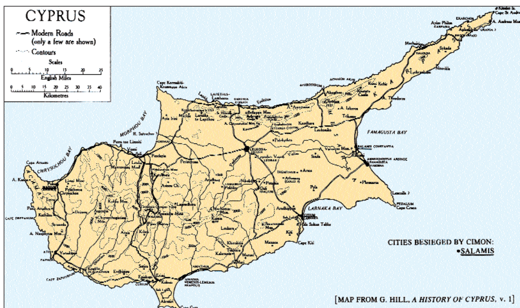
1. Χάρτης της Κύπρου.

Πρώτα απ' όλα πρέπει να εξακριβωθεί ο βυζαντινός τύπος του ονόματος κι αυτό προκειμένου να καθοριστεί η κατώτερη χρονολογία του Νεμεσός . Όπως πιστοποιεί ο Ρετβίσι 2 στο κριτικό υπόμνημα, οι γραφές Κούριον , Νέμεμος παραλείπονται στους