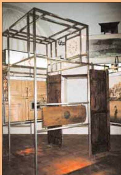
6. Κατασκευή με την έκθεση αντικειμένων της λαϊκής αρχιτεκτονικής (θυρόφυλλα, φεγγίτης, κλειδαριά, κάλυμμα κασέλας).

Η έκθεση της ιστορικής συλλογής Καστελλορίζου αποτελεί συλλογικό έργο της 4ης Εφορείας Βυζαντινών Αρχαιοτήτων του Υπουργείου Πολιτισμού σε συνεργασία με τη Διεύθυνση Νεώτερης Πολιτιστικής Κληρονομιάς, της οποίας η συμβολή υπήρξε πολύτιμη.