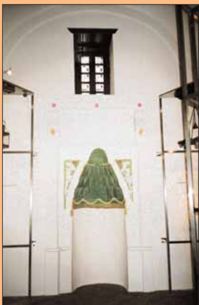
4. Άποψη της κόγχης προσευχής (μιχράμπ).

τότητα να μάθει για την ιστορία του νησιού σε συνδυασμό με την καθημερινή ζωή από το 1912 και μετέπειτα, καταλήγοντας στον υπολογιστή, όπου του δίνονται συμπληρωματικές πληροφορίες για τα τοπικά έθιμα (τραγούδια γάμου, του Πάσχα, μοιρολόγια, νανουρίσματα, παροιμίες, αινίγματα), αλλά και την τοπική κουζίνα με συνταγές φαγητών και γλυκισμάτων.