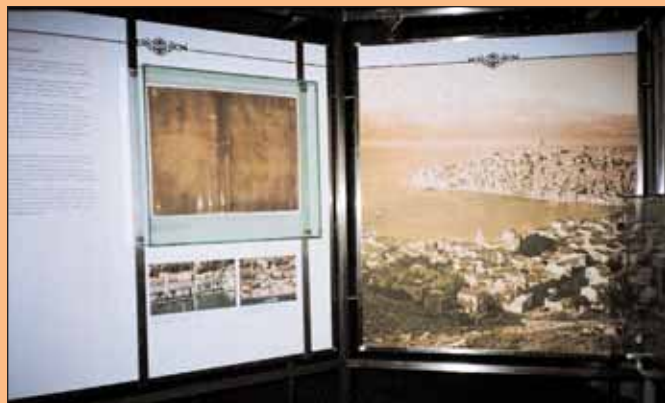
5. Ταμπλώ με στοιχεία σχετικά με τον οικισμό του Καστελλορίζου.

Αν κανείς έχει κουραστεί, μπορεί να αναπαυθεί για λίγο στον κατάλληλα διαμορφωμένο χώρο κάτω από τη μικρή ξύλινη σκάλα που οδηγεί στον εξώστη. Ανεβαίνοντας τη σκάλα μπορεί να απολαύσει το χώρο από κάποιο ύψος, να περιεργαστεί ένα ομοίωμα караβιού που συνόδευε τα κάλαντα των Χριστουγέννων και της Πρωτοχρονιάς, και να διαβάσει τα γνωμικά ή τα μοιρολόγια από τη συλλογή ενός καστελλοριζιού λογίου. Τέλος, στο δυτικό άκρο του εξώστη μπορεί κανείς να καθίσει και να ακούσει σε ατομική ακρόαση μουσική και τραγούδια του νησιού. Η έκθεση ολοκληρώνεται με μία προβολή που περιλαμβάνει τη συγκινητική αφήγηση ιστορικών γεγονότων από έναν εν ζωή Καστελλοριζιό. Για όσους κουράζονται από την ανάγνωση κειμένων ή διαθέτουν λίγο χρόνο ή ανήκουν στη παιδική ηλικία έχει προβλεφθεί και για αυτούς η ολιγόλεπτη ενημέρωση με την τοποθέτηση πέντε φωτεινών επιφανειών, με τις οποίες εξιστορείται η νεότερη ιστορία του νησιού από τον 14ο ως τα μέσα του 20ου αιώνα