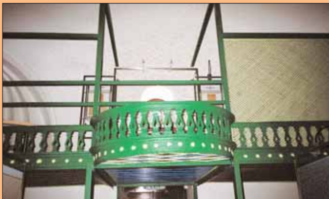
3. Άποψη του εξώστη του γυναικωνίτη.

Στην πορεία αναφέρεται η αρχιτεκτονική του νησιού και η εξέλιξη του οικισμού που συνδέεται άμεσα με τα σπουδαιότερα ιστορικά γεγονότα. Ξεχωριστό τομέα αποτελεί η καθημερινή ζωή στα χρόνια ακμής που σχετιζόταν με τη θάλασσα και το εμπόριο: αφενός σκιαγραφείται με την τοπική ενδυμασία, τις φωτογραφίες γάμου, τα προικοσύμφωνα, τα κεντήματα, αφετέρου ζωντανεύει με την αφαιρετική αναπαράσταση μιας αστικής κατοικίας με την έκθεση ορισμένων αρχιτεκτονικών στοιχείων τόσο της εξωτερικής όψης όσο και του εσωτερικού, όπως είναι τα θυρόφυλλα ενός γκρεμισμένου αρχοντικού, ο πέτρινος φεγγίτης, η προστατευτική σιδεριά παραθύρου, το μεταλλικό πολυκάνδηλο φωτιστικό, το καντήλι, τα σκεύη καθημερινής χρήσης. Επίσης, προβάλλεται ο τομέας της παιδείας που γνώρισε μεγάλη άνθηση στο νησί, με αξιόλογα οργανωμένα σχολεία και την έκδοση περιοδικών ποικίλης ύλης.