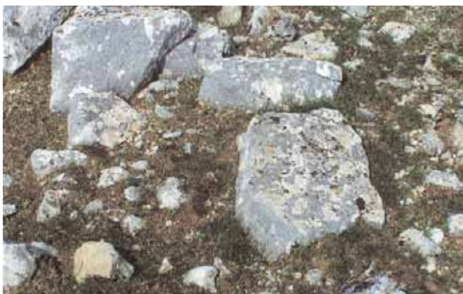
2. Θεμέλιο κτίσματος.

νησί είναι πανοραμική. Υπάρχει άμεση θέα και προς τις δύο άλλες θέσεις που προαναφέρθηκαν.