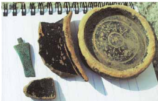
3. Η γραπτή κεραμική και το μεταλλικό αντικείμενο (λόγχη-βέλος;).

Οι υποθέσεις που μπορούν να γίνουν από την επιφανειακή εκτίμηση είναι η ύπαρξη ενός «ιερού κορυφής», πάλι σε θέση του Αη-Λια, και μάλιστα στο βουνό με το όνομα Όλυμπος. Αυτό βέβαια απαιτεί περαιτέρω έρευνα, ίσως την ανεύρεση ειδωλίων και, στην καλύτερη περίπτωση, ανασκαφή. Ίσως η κατά μήκος της πλαγιάς κατασκευή να αποτελούσε αναλημματικό τοίχο διαμορφωμένου επίπεδου χώρου που φιλοξενούσε τα κτίσματα του ιερού. Η κατασκευή