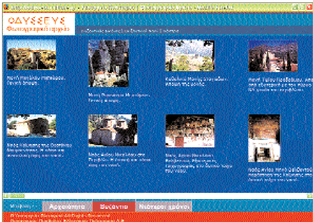
2. Φωτογραφικό αρχείο, ενότητα Βυζάντιο, φωτογραφίες βυζαντινών ναών και μοναστηριών.

και τεχνική=«εμπέιστη», δείχνοντας ότι δεν έχει γίνει συστηματική ευρετηρίαση. Τέλος, η αναζήτηση με «λέξη κλειδί» λειτουργεί στην πραγματικότητα με ελεύθερο κείμενο (τη σειρά των χαρακτήρων μιας λέξης) στα κείμενα μίας ή περισσότερων ενότητων, και όχι με προκαθορισμένες λέξεις, όπως η χρήση του συγκεκριμένου όρου αφήνει να εννοηθεί.