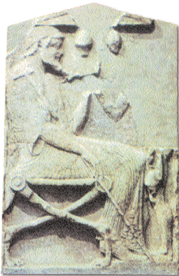
5. Ανάγλυφο που απεικονίζει γιατρό, όπως συμπεραίνεται από τις δύο σκύες (ιατρικά κύπελλα) κάτω από το αέτωμα της στήλης. Τέλος 5ου αι. Βασιλεία, Μουσείο Τέχνης.