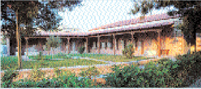
2. Γενική άποψη του Μουσείου.

συγχρόνως και το από ετών αίτημά της για την επισκευή και την ανακαίνιση των εκθεσιακών χώρων του παλαιού κτηρίου του Μουσείου, με έργο του Γ΄ ΚΠΣ, που εκτελέστηκε από τις τεχνικές υπηρεσίες του Υπουργείου (ΔΜΜ και ΔΕΕΜ). Η μεγαλύτερη παρέμβαση στο κτήριο ήταν η κάλυψη της εσωτερικής αυλής με γυάλινη τετράριχτη στέγη. Παράλληλα σχεδιάστηκε η νέα μόνιμη έκθεση, που εγκαινιάστηκε στις 9.8.2004. 3 Από τον Μάρτιο του 2005 λειτούργησε στον Κεραμεικό και εκπαιδευτικό πρόγραμμα, που πραγματοποιήθηκε σε συνεργασία με τη Διεύθυνση Εκπαιδευτικών Προγραμμάτων του Υπουργείου.