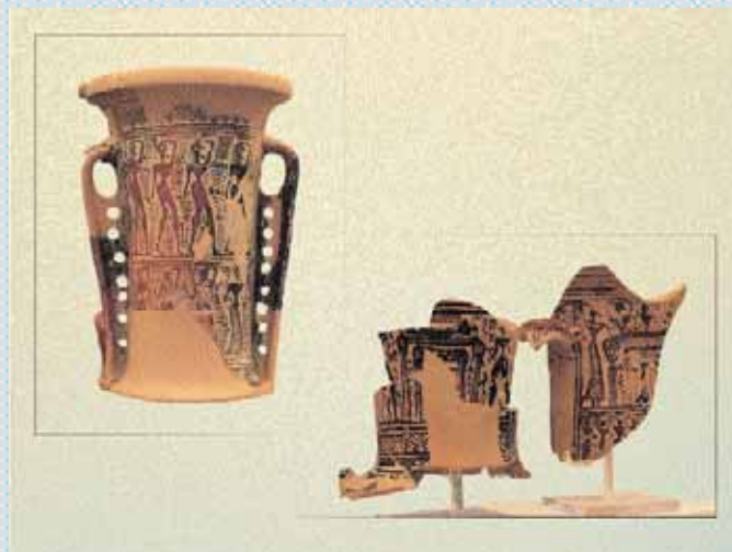
8. Λαιμοί λουτροφόρου και αμφορέων με παραστάσεις θρηνωδών και πρόθεσης νεκρού. 750-700 π.Χ.

Αφήσαμε για το τέλος την παρουσίαση δύο προθηκών με εκθέματα που δεν προέρχονται από τη νεκρόπολη του Κεραμεικού. Πρόκειται για τις προθήκες 10 και 15, στην τελευταία αίθουσα. Η προθήκη 10 φιλοξενεί εκθέματα προερχόμενα από την ανασκαφή της Γ' ΕΠΚΑ που διενεργήθηκε για τις ανάγκες του ΜΕΤΡΟ στη γωνία Ιεράς Οδού και Πειραιώς, ακριβώς στη συνέχεια του αρχαιολογικού μας χώρου. Το σημαντικότερο εύρημα υπήρξε αναμφίβολα ο ομαδικός τάφος των «εν αταξία» θαμμένων 89 ανδρών, γυναικών και παιδιών, ο οποίος συνδέεται με τα γεγονότα των αρχών του Πελοποννησιακού πολέμου και συγκεκριμένα με το λοιμό που ενέσκηψε στην Αθήνα το 430/429 και 427/426 π.Χ. Τα εκθέματα 1-15 επιτρέπουν στον επισκέπτη να «σφυγμομετρήσει» ένα ιστορικό γεγονός και τις συνέπειές του, όπως το περιγράφει ο Θουκυδίδης. Στην προθήκη 15 εκτίθενται τα μόνα αντικείμενα