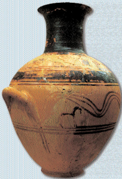
3. Τεφροδόχος αμφορέας με την αρχαιότερη παράσταση ίππου στην αττική αγγειογραφία. 10ος αι. π.Χ.

Εκτός από τον ταύρο στο αίθριο φιλοξενούνται γλυπτά που εκπροσωπούν διαφόρους τύπους της επιτάφιας