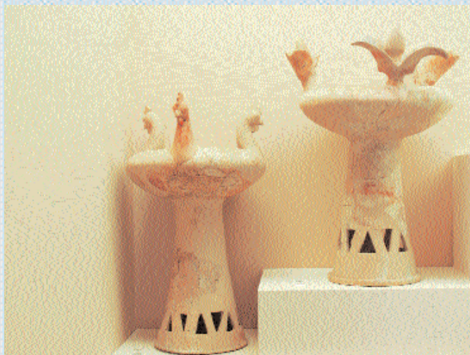
7. Λεκανίδες με ψηλό πόδι και πλαστικό διάκοσμο στο χείλος. 660-650 π.Χ.

Η μελανόμορφη κεραμική της Ύστερης Αρχαϊκής περιόδου (510-480 π.Χ.) και αυτή της Κλασικής εποχής (5ος-4ος αι. π.Χ.) παρουσιάζεται στις προθήκες 9, 11, 12 και 13. Ξεχωριστά αναφέρεται, ως δείγμα εξαιρετικής τέχνης, ο φορμίσκος με την παράσταση πρόθεσης της νεκρής Μυρίνης (προθ. 9/19), καθώς επίσης και οι χαρακτηριστικές του 5ου αι. π.Χ. λευκές λήκυθοι της προθήκης 12 (2, 4, 7-12), ενώ στην προθήκη 13 δεσπόζει ερυθρόμορφη υδρία, έργο του Ζ. Μειδία, με παράσταση της Ελένης και των αδελφών της (18), και ο χους του αγγειογράφου Αίσωνος με παράσταση Αμμυμώνης και Σατύρων (21). Στην τελευταία προθήκη με κτερίσματα των τάφων του Κεραμεικού, στην προθήκη 14, εκτίθενται αγγεία και κοσμήματα της Ελληνιστικής, Ρωμαϊκής και Παλαιοχριστιανικής εποχής που εκπροσωπούν το χρονικό διάστημα από τον 3ο αιώνα π.Χ. έως τον 6ο αιώνα μ.Χ. Τα μελαμβοή εκθέματα με διακόσμηση «δυτικής κλιτύος» (3, 4, 5, 8, 10) και το χρυσό στεφάνι προέρχονται από τους λακκοειδείς κυρίως τάφους της Ελληνιστικής εποχής, ενώ από ρωμαϊκές-παλαιοχριστιανικές ταφές εκτίθενται τα πολλά μυροδοχεία, τα γυάλινα φιαλίδια, οι λύχνοι και τα χρυσά κοσμήματα (24-28).