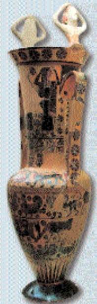
5. Λουτροφόρος με γραπτό και πλαστικό διάκοσμο θρηνώδων. 660-580 π.Χ.