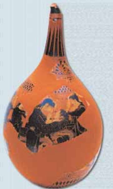
4. Φορμίσκος με σκηνή πρόθεσης νεκρής και θρηνώδους. Περί το 510 π.Χ.