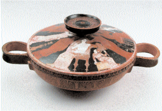
3. Λεκανίδα με κάλυμμα που διακοσμείται με παράσταση προετοιμασίας γάμου. Έργο του ζωγράφου Μαρσύα. 350-325 π.Χ. Περιστέρας Θεσσαλονίκης.

χαν αφήσει εποχή: Η μία ήταν στο Μουσείο Παραδοσιακών και Λαϊκών Τεχνών, με θέμα τον Γαργαντούα και η άλλη στο Κέντρο Πομπιντού για τη Βιέννη του Μεσοπολέμου. Η πρώτη αναφερόταν σε όλες τις διαστάσεις της έννοιας του φαγητού στην εποχή του Ραμπελαί: παρασκευή-κατανάλωση σε όλες τις ταξικές βαθμίδες, τους χώρους και τις περιστάσεις (π.χ. γάμος, πανηγύρι, τελετές κ.λπ.). Η δεύτερη αναφερόταν σε όλα τα ιδιαίτερα χαρακτηριστικά που αναπτύχθηκαν την περίοδο του μεσοπολέμου στη Βιέννη: πολεοδομία, κτήρια, τέχνες, γράμματα, επίπλωση, ντιζάιν γενικότερα, ψυχανάλυση, ζωγραφική, μουσική κ.λπ. Οι τάσεις και στις δύο εκθέσεις ήταν σαφώς αναπαραστατικές. Και στις δύο ο θεατής, χωρίς αυτό να είναι απόλυτο, αφηνόταν υπό το κράτος των εντυπώσεων, έλειπε ίσως η διατύπωση ενός νοήματος. Δεν πρέπει εξάλλου να μας διαφεύγει ότι συγκεκριμένο θέμα αρχίζει να ορίζει ακόμη και εκθέσεις ζωγραφικής, όπως π.χ. πρόσφατη έκθεση ζωγραφικής για τη μελαγχολία (Παρίσι).