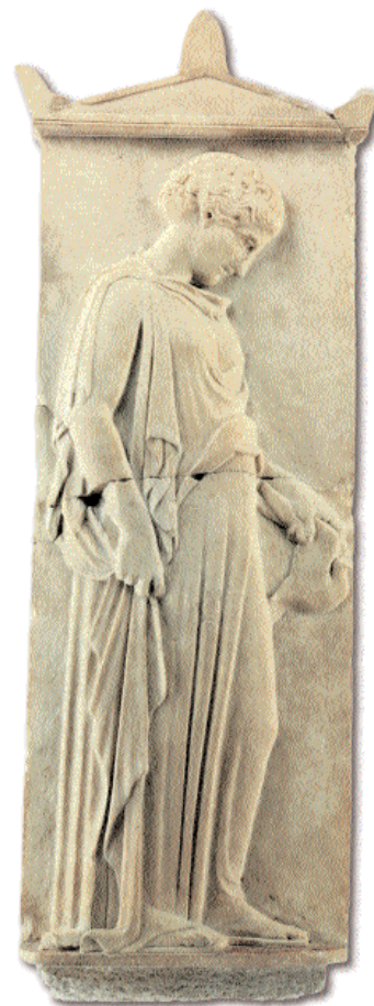
2. Μαρμάρινη επιτύμβια στήλη με ανάγλυφη παράσταση κόρης που κρατά περιστέρι. Γύρω στο 440 π.Χ. Νέα Καλλικράτεια Χαλκιδικής.

Σε τι μεταφράζεται αυτό το χάος; Στο ότι στο επανεκθετικό πρόγραμμα θα έπρεπε να συνδυάζονται τα εξής: 1. Να εξακολουθήσει να υπάρχει, κατά τον άλφα ή βήτα τρόπο, η έκθεση «Ο Χρυσός των Μακεδόνων», δεδομέ-