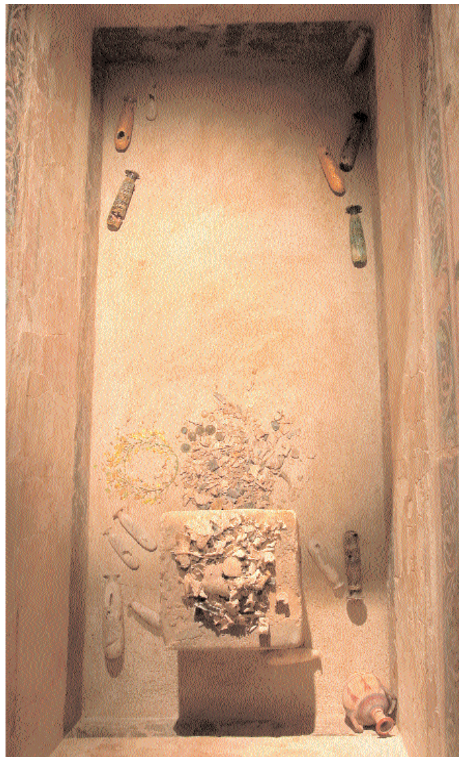
5. Το εσωτερικό τάφου από την αρχαία Αίγεια, περιοχή Μηχανιώνας Θεσσαλονίκης (ενότητα «Ο χρυσός των Μακεδόνων»).

Η τελική εκθεσιακή διάρθρωση κατέληξε ως εξής: 1. Ο χώρος 2. Ο χρόνος. 3. Η κοινωνική και πολιτική οργάνωση (πληθυσμός και κοινωνικές τάξεις, δουλεία, διοικητικό-δικαιο-θεσμοί, ο στρατός, η εκπαίδευση, ο αθλητισμός). 4. Οικονομία και επικοινωνία (αγροικίες, ζωική και φυτική παραγωγή, βιοτεχνική παραγωγή –ο πηλός, τα μέταλλα, το γυαλί, το ελεφαντόδοντο–, μετακινήσεις, εμπόριο, ανταλλαγές). 5. Οικογένεια και ιδιωτική ζωή (οίκος και οικονομία, γνωρίζοντας τις μακεδονικές οικογένειες, η επίπλωση και ο εξοπλισμός του σπιτιού, μαγείρεμα-σερβίρισμα, υφαντική-ένδυση, παιχνίδια, καλ-