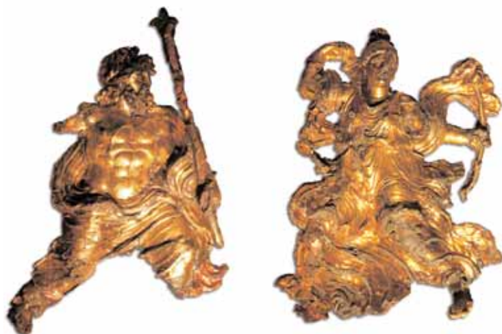
β. Ιδιωτικής, δημόσιας και πνευ-Υ

Ύστερα από όσα προηγήθηκαν, η έκφραση «μουσειακό έκθεμα», που αναφέραμε στην αρχή, εξακολουθεί άραγε να έχει την «απαξίωτική» σημασία που της αποδόθηκε και της αποδίδεται ακόμα και όταν βρίσκεται σε ένα εκσυγχρονισμένο μουσειακό περιβάλλον ανάλογο με αυτό που περιγράψαμε; Καταρχήν θα θέλαμε να τονίσουμε ότι η σύγχρονη θεματολογία της έρευνας στη Μακεδονία, έτσι όπως αποτυπώνεται στις θεματικές μας ενότητες, υποστηρίζεται τόσο από σύγχρονες κοινωνιολογικές έρευνες που ήδη αναφέραμε, όσο και από τη σχολή των Annales αλλά και τη μεταμοντέρνα άποψη για την –εκτός των άλλων– συμβολική και νοηματική συγκρότηση του κόσμου. 4 Κάθε έκθεμα, επομένως, εντάσσεται σε μια θεματική ενότητα, που με τη σειρά της εντάσσεται σε μια συγκροτημένη ομάδα από ενότητες, οι οποίες συνιστούν κατά το δυνατόν το σύνολο της