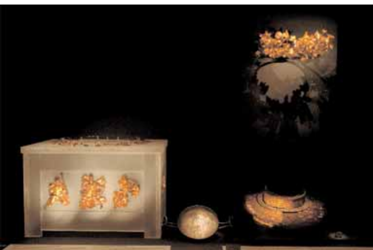
7α. Αργυρή επίχρυση διακόσμηση λάρνακας που ήταν κατασκευασμένη από ξύλο και δεν διατηρήθηκε. Νεκροταφείο Πύδνας, Μακρύγιαλος, β. Μορφή Δία, γ. Μορφή Άρτεμης.

ουργίας σε ένα «μουσείο», κατέληξαν να κάνουν οι ίδιοι αυτό που ανέκαθεν ήξεραν καλά: την αντιγραφή κειμένων. Η επανεκτίμηση των σημερινών (ενός αγρότη ή ενός τεχνίτη), ή των προ δεκαετιών δεξιοτήτων του επισκέπτη αναπτυγμένων σε ένα αστικό ή αγροτικό περιβάλλον, του χαρίζει σίγουρα αυτοδικαίωση και περηφάνια για το ατομικό του παρελθόν και τον προτρέπει σε μια κριτική στάση απέναντι στα πράγματα. Την εντόπισα κατά κόρον αυτή τη συμπεριφορά στην έκθεση για τις Αρχαίες Αγροκίες που αναφέραμε, έκθεση που αποτέλεσε έναν από τους πολλούς πυρήνες αυτής της επανέκθεσης. Θα συνειδητοποιήσει τέλος ο επισκέπτης ότι ο τεράστιος και δύσβατος κόσμος των αρχαίων κειμένων δεν συνιστά τον μοναδικό και ουσιαστικό τρόπο της γνωριμίας του με τον αρχαίο κόσμο.