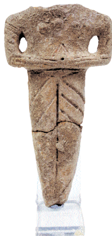
4. Πήλινο ανθρωπόμορφο ειδώλιο με εγχάρακτη και πλαστική διακόσμηση. Νεότερη Νεολιθική. Οικισμός Σταυρούπολης Θεσσαλονίκης.