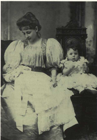
8. Η συγγραφέας Πηνελόπη Δέλτα (Αλεξάνδρεια, 1874 - Αθήνα, 1941).

Όσο για τον Συκουτρή, ο λόγος που δεν εγκατέλειψε τη γυναίκα του όσο ο ίδιος ζούσε ήταν επειδή δεν άντεχε να την πληγώσει στη σκέψη ότι εκείνη του είχε φερθεί καλύτερα κι από μητέρα –λόγος που δεν στάθηκε τελικά ικανός να τον εμποδίσει να υποκύψει στα θέλητρα του θανάτου, με την ιδέα ότι κάπου εκεί ψηλά τον περίμενε η ψυχή του Πλάτωνα.