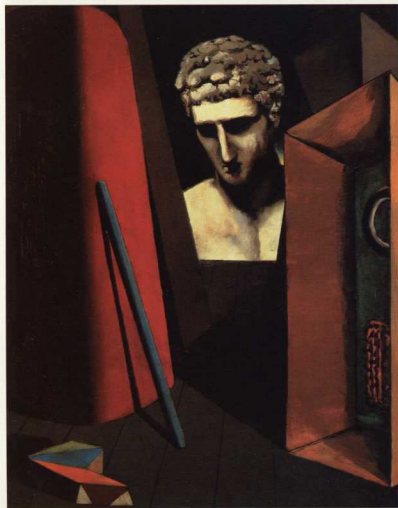
3. Giorgio de Chirico, «Ερμητική μελαγχολία», 1918-1919, λάδι σε καμβά, 62 x 49,5 εκ. Musée d'Art moderne de la Ville de Paris.

Ο Τέλλος Άγρας, που είχε την ατυχία να πάει από θάνατο «βλακώδη για τον άνθρωπο», από μίαν αδέσποτη σφαίρα στο πόδι που κακοφόρμιζε και τον σκότωσε κατά τη διάρκεια των Δεκεμβριανών, τότε που κι εγώ παρά λίγο να χάσω τη ζωή μου με τρόπο εξίσου βλακώδη—αλλά καλύτερα—as μν ξύνουμε παλιές πληγές—είχε στο νου του τον Καρυωτάκη και τον Λαπαθιώτη όταν μιλούσε έτσι και θα μπορούσε κανείς εύλογα να συμπεριλάβει τον Περικλή Γιαννόπουλο και τον Συκουτρή. Και στις δύο αυτές περιπτώσεις ο θάνατος προβάλλεται ως ένα ιδεώδες που γεμίζει την ψυχή και τη σκέψη ενός φιλοσοφημένου ανθρώπου, ο οποίος ξέριε ότι η αλήθεια είναι πέρα από τους συμβιβασμούς, τις αυταπάτες