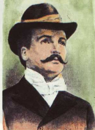
4. Ο Περικλής Γιαννόπουλος (Πάτρα, 1869 - Σκαρμαγκάς Αττικής 1910), πεζογράφος, μεταφραστής και δοκιμιογράφος.

νεότερων λογοτεχνών, ποιητών κυρίως, και όχι μόνο μιμητών του Καρυωτάκη, δεν αντιστοιχεί υποχρεωτικά στην ιδέα της αυτοκτονίας. Όπως στην περίπτωση του Άμλετ, ο απολογητής του θανάτου δεν έχει συνήθως την πρόθεση να αυτοκτονήσει, αν και θα μπορούσε κανείς να υποθέσει ότι σε κάποιο συνειδητό ή ασυνείδητο επίπεδο διέπεται από μια αυτοκαταστροφική διάθεση ή επιθυμία. Χαρακτηριστική είναι η περίπτωση του Ίωνα Δρακούμη, επιστήθιου φίλου δύο αυτοκείρων της ελληνικής λογοτεχνίας –του Περικλή Γιαννόπουλου και της Πηνελόπης Δέλτα– στον οποίο, αν πιστώσουμε τα λόγια του, η ιδέα του θανάτου ασκούσε μεγάλη γοητεία –εκείνος, όμως, όπως ο Άμλετ, προτιμούσε να πάει από άλλο κέρι, όπως και συνέβη. Είναι επίσης σημαντικό το γεγονός ότι δύο κάθε άλλο παρά πεισιθάνατοι μέζοντες ποιητές της εποχής του Περικλή Γιαννόπουλου, ο Παλαμάς και ο Σικελιανός, είδαν τον εβελούσιο θάνατό του σαν κάτι το ηρωικό, ενώ σε μεταγενέστερες εποχές, ακόμα και στις ημέρες μας, η αυτοκτονία αντιμετωπίζεται επικριτικά είτε ως αμαρτωλή πράξη είτε ως συνέπεια ψυχιατρικής αρρώστιας και αποκρύπτεται ή αποσιωπάται.