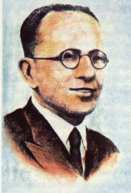
9. Ο Ιωάννης Συκουτρίης, κορυφαίος κλασικός φιλόλογος (Σμύρνη, 1901-Ακροκόρινθος, 1937).

κρίσιμη στιγμή για ένα ναρκισιστικό άτομο όπως ο Περικλής Γιαννόπουλος ή ο Ναπολέων Λαπαθιώτης είναι η μέση ηλικία, όταν ο άνθρωπος αναγνωρίζει πάνω του τα σημάδια της παρακμής, όταν βλέπει μια μέρα το είδωλό του στον καθρέφτη της αυταρέσκειας να θαμπάνει και, αρχίζοντας να συναισθάνεται το κενό που υπάρχει λανθάνον μέσα του, τρομάζει. Ο Καρυωτάκης και ο Συκουτρίης δεν χρειάστηκε να μεγαλώσουν περισσότερο για να καταλάβουν πως είχαν ψυχικά, αν όχι και σωματικά, γεράσει. Η ιδέα της παρακμής και της αποτυχίας, ενισχυμένη από το αίσθημα της αδικίας που προκαλούσαν οι επαγγελματικές τους δυσκολίες, ήταν εξίσου έντονη και στους δύο. Και μαζί με το αίσθημα της αδικίας, ο θυμός που, όταν δεν μπορεί ν' αλλάξει τα πράγματα ή να μεταλλαχτεί δημιουργικά, στρέφεται εναντίον των ενδοψυχικών αντικειμένων, εναντίον του εαυτού μας. Η σάπια και η ειρωνεία του Καρυωτάκη γίνονται αυτοσαρκασμός και μήνυμα θανάτου, η επιθετικότητα και η πολυπραγμοσύνη του Συκουτρίη γίνονται αυτοτιμωρία και παραισία. Υπάρχει η εντύπωση ότι τόσο ο Καρυωτάκης όσο και ο Συκουτρίης είχαν φτάσει στο τέλος της δημιουργικότητάς τους. Και αυτό θα μπορούσαν να το διαισθάνονται και οι ίδιοι. Και πιο σίγουρα, το ίδιο θα μπορούσε να πει κανείς για τον