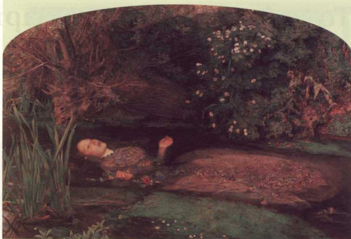
2. John Everett Millais, «Οφελία», 1851-2, λάδι σε καμβά, 76,2 x 111,8 εκ. Tate Gallery, Λονδίνο.

Όπως σημειώνει ο Ανδρέας Εμπειρφόκος στον διάλογο αυτόν, ακόμη και ένας μη πεισιθάνατος ποιητής όπως ο Άγγελος Σικελιανός έτρεφε ένα βαθμό θανατοφιλίας. Ο Μ.Ζ. Κοπιδάκης αναλύει το σονέτο του Σικελιανού «Η αυτοκτονία του Ατσειβάνο» (1937), το οποίο ουσιαστικά μνεί τη φανταστική ιστορία της ηρωικής αυτοχειρίας ενός Βουδιότη μοναχού. Η φιλολογική αυτή αναστομία αποδεικνύει την εξαιρετική συνύφανση λόγων και δημηδών στοιχείων, συμβόλων και συνυποδηλώ-