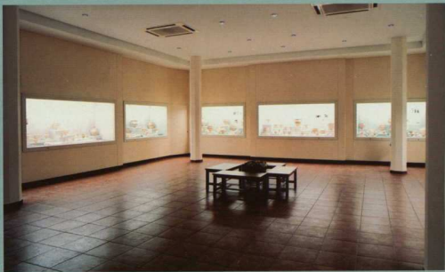
4. Αίθουσα 2, προθήκες με μυκηνναϊκά ευρήματα.

χουν πολλές και διαφορετικές απόψεις. Έτσι, η ομηρική Ιθάκη ταυτίζεται από άλλους με τη σημερινή Ιθάκη, από άλλους με τη Λευκάδα, ορισμένοι την τοποθετούν στις απέναντι ακαρνανικές και αιτωλικές ακτές, ενώ πολλοί είναι εκείνοι που θεωρούν ως ομηρική Ιθάκη την Κεφαλονιά. Στις τοπικές κοινωνίες, ιδίως σε αυτές της Ιθάκης και της Κεφαλονιάς, η ταύτιση της Ιθάκης του Οδυσσέα έχει αναχθεί σήμερα σε ύψιστης σημασίας ζήτημα. Η διαμάχη που έχει ξεσπάσει υποδαυλίζεται έντονα και από ιστοριοδίφους, αλλά δυστυχώς και από τοπικούς παράγοντες, ορισμένοι από τους οποίους φθάνουν στο σημείο να αμφισβητούν τα πορίσματα της επιστήμης και να απειλούν με μινύσεις επιστήμονες που εκφράζουν αντίθετες απόψεις από τις δικές τους. Το πράγμα, αν δεν είναι επικίνδυνο, είναι το λιγότερο κωμικό, αφού παραγνωρίζεται το γεγονός ότι μόνο υποθέσεις μπορούν να γίνουν, μια και δεν πρόκειται να βρεθούν σύγχρονες του Οδυσσέα γραπτές μαρτυρίες που θα τις επιβεβαιώσουν. Αρκεί οι υποθέσεις να είναι σοβαρές και να στηρίζονται σε αρχαιολογικές ενδείξεις, και όχι στην προσαπείθεια απόδοσης των γεωγραφικών περιγραφών του Ομήρου σε συγκεκριμένους τόπους των παραπάνω περιοχών, διότι οι περιγραφές είναι αφενός μεν ποιητικές, αφετέρου δε τόσο γενικές, ώστε μπορούν με μεγάλη ευκολία να ταυριάζουν σε πολλούς χώρους. Το βασικό επιχείρημα για την ταύτιση της Κεφαλονιάς με την ομηρική Ιθάκη είναι, κατά τον Σπ. Μαρινάτο, το γεγονός ότι στην Κεφαλονιά έχουν