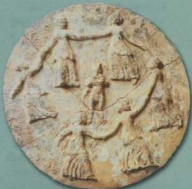
7. Πήλινος δίσκος τέλους 4ου-αρχών 5ου αι. π.Χ., με ανάγλυφη παράσταση Νυμφών, που χορεύουν υπό τους ήκους της σύριγγας του Πανός. Βρέθηκε στο σπλήσιο της Μελισσιάνης ανάμεσα στη Σάμη και την Αγ. Ευφημία.

Χαρακτηριστικά ευρήματα της Κεφαλληνιακής Τετράπολης, αλλά και μεμονωμένων θέσεων, από τα κλασικά έως και τα ρωμαϊκά χρόνια εκτίθενται στις τρεις προθήκες της τελευταίας αίθουσας (εικ. 7), πήλινα και γυάλινα αγγεία, χρυσά κοσμήματα, πήλινες κεραμώσεις, ειδώλια, ανάγλυφα πλακίδια, λίθινα αρχιτεκτονικά μέλη, επιγραφές, μικρό ψευδοτώ δάπεδο από το Ιερό του Ποσειδώνα στη Βάλτσα του Ληξουρίου και χάλκινη κεφαλή του αυτοκράτορα Γαλλίνου (εικ. 6).