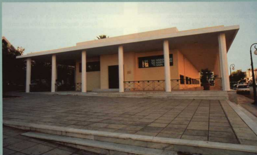
1. Το Μουσείο Αργοστολίου.

Τ ο Αρχαιολογικό Μουσείο του Αργοστολίου (εικ. 1) βρίσκεται στο κέντρο της πόλης, στη μεγάλη πλατεία με το άγαλμα της Ειρήνης, τα Δικαστήρια και το θέατρο Κέφαλος. Πίσω από το θέατρο βρίσκεται το Ιστορικό Μουσείο της Κεφαλονιάς, που ίδρυσε η οικογένεια Κοσμετάτου. Το Αρχαιολογικό Μουσείο στεγάζεται σε σύγχρονο κτήριο που κτίστηκε το 1957, ύστερα από την καταστροφή του πρώτου Μουσείου στον φοβερό σεισμό του 1953, κατά τον οποίο, εκτός από τις ανθρώπινες ζωές, απώλεστηκαν και πολλά αρχαία αντικείμενα, που προέρχονταν από παραδόσεις και από τις πρώτες συστηματικές ανασκαφικές έρευνες στην Κεφαλονιά του Π. Καββαδία και του κεφαλλονίτη αρχαιολόγου Σπ. Μαρινάτου. Οι έρευνές τους, τις οποίες είχε χρη-