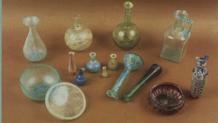
5. Γυάλινα αγγεία από το ρωμαϊκό νεκροταφείο της Σάμης.

Βρεθεί πολλές μυκηναϊκές θέσεις, σε αντίθεση με τη σημερινή Ιθάκη, όπου τα μυκηναϊκά ευρήματα είναι ελάχιστα, και επομένως δεν θα μπορούσε να είναι η έδρα ενός τόσο σημαντικού μυκηναϊκού βασιλείου, όπως ο Οδυσσεύς. Βεβαίως, με τις συστηματικές έρευνες των τελευταίων χρόνων, τα μυκηναϊκά ευρήματα της Ιθάκης πολλαπλασιάστηκαν, ιδίως στην περιοχή του Πίω Αετού, όπου πραγματοποιείται συστηματική ανασκαφή από τον καθηγητή Σ. Συμεωνίδη. Αλλά και στην Κεφαλονιά, στο νοτιότερο τμήμα της, κοντά στον Πόρο, ανασκάφηκε μεγάλος θολωτός μυκηναϊκός τάφος, ο οποίος θεωρείται βασιλικός από τον ανασκαφέα του Λ. Κολώνα.