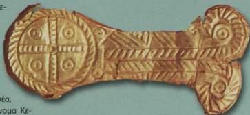
3. Χρυσό κάλυμμα καθρέφτη ή λαβής ξίφους από το μυκηνναϊκό νεκροταφείο της Λακκίθρας, ΥΕ IIIA2-F περίοδος, 1390/70-1060/40 π.Χ.

πρώτη φορά η ονομασία Κεφαλληνία απαντά στον Ηρόδοτο, ενώ ο Όμηρος αποκαλεί το νησί Σάμη ή Σάμο και Κεφαλλήνες όχι μόνο τους κατοίκους του, αλλά και αυτούς των γειτονικών νησιών, που ήταν υπόκοι του Οδυσσέα, Βασιλιά της Ιθάκης. Το όνομα Κεφαλληνία το έλαβε, κατά την παράδοση, από τον Κέφαλο, γιο του Διονέως, που έφθασε εκεί φυγάζ από την Αθήνα, ύστερα από τον ακούσιο φόνο της συζύγου του Πρόκριδος, θυγατέρας του Ερεχθέως. Μαζί με τον Αμφιτριώνα ξεδιώξαν τους παλαιότερους κατοίκους, τους Ταφίους ή Τηλεβόες. Ίσως το όνομα των Ταφίων έχει επιβιώσει στο νοτιοδυτικό τμήμα του νησιού, όπου βρίσκεται η Μονή Ταφίου. Οι Κεφαλλήνες πιθανώς διαπεραιώθηκαν στο νησί κατά τη Μυκηνναϊκή περίοδο. Κατά τον Πλίνιο, έως τότε ονομαζόταν Μέλαινα, από την ποιικιλία της μαύρης αυτοφρούς ελάτης που καλύπτει το μεγαλύτερο βουνό του νησιού, τον Αίνο. Από τον Στρά-