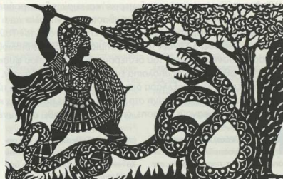
7. «Ο Μέγας Αλέξανδρος και το καταραμένο φίδι», 1983. Κοφτό χαρτόνι, 94 x 65 εκ. Μουσείο Γαλιούρη.

Η ψυχή του αυτοδιδακτού καπετάνιου του χρωστήρα είναι παντού και μας θυμίζει τη ρήση του καλού του φίλου Πήτερ Ουστίνωφ «Να γίνεις δάσκαλος του εαυτού σου κι εκείνος θα σε κάνει μαθητή του», συμβολή που ακολούθησε πιστά στην «ποιητική» του Ασκητική.