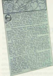
3. Χειρόγραφο, 1985. Σινκίλι, 40 x 28 εκ. (Κέντρο Ελληνικής Παράδοσης).