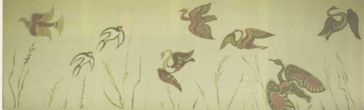
1. Υδρόβια πουλιά και χελιδόνια, 1977. Χαμένη τοιχογραφία. Village Inn, Πόρτο Καρράς.