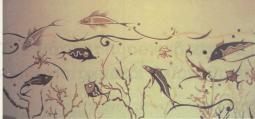
4. Θαλάσσιος ρυθμός, 1977. Χαμένη τοικογραφία. Village Inn, Πόρτο Καρράς (φωτοθήκη Μουσείου Γαλιούρη).