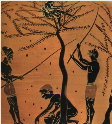
7. Δούλοι σε αγροτικές ασκολίες.

απαντά στο εύλογο ερώτημα γιατί δεν εξεγέρθηκαν ποτέ οι αθηναϊκοί δούλοι, με φωτεινή εξαίρεση, που βέβαια συνιστά ιδιόζουσα περίπτωση, το 413, μετά την κατάληψη της Δεκέλειας από τους Σπαρτιάτες, την απόδραση 20.000 δούλων από τις μοναδικά –για τα αθηναϊκά δεδομένα– επαχθείς συνθήκες του Λαυρίου (Θουκυδίδης 7.27.3-5). Αντιθέτως, οι Λακεδαιμόνιοι, υποδουλώνοντας τους ντόπιους κατοίκους, γνώριζαν ότι «έσπεραν ανέμιους για να θερμόσιν θύελλες». Οι ειλώτες είχαν κοινή καταγωγή και άσβεστο πόθο να κερδίσουν την ελευθερία τους σε ομαδικό επίπεδο, ο οποίος υποδαυλιζόταν και από την κακομεταχείρισή τους από τους Σπαρτιάτες, κάτι που οι Αθηναίοι και οι Κρήτες δεν συνήθιζαν, πιστεύοντας στα θετικά αποτελέσματα της καλής μεταχείρισης. Ένας επιπλέον παράγοντας, που ενίσχυε τη δυνατότητα των ειλώτων να εξεγερθούν, αποτελούσε το γεγονός ότι λόμβαναν, έστω και υποτιμωδώς, στρατιωτική εκπαίδευση και μο-