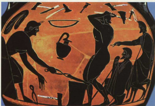
5. Δούλος που εργάζεται σε σιδηρουργείο.