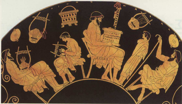
3. Παιδαγωγός (ο ηλικιωμένος άνδρας με το μπιστούλι στα δεξιά) που συνοδεύει το αγόρι στο σχολείο.

και ο πατέρας του ρήτορα Λυσία Κέφαλος –ο οποίος φαίνεται ότι ασχολούσε 120 δούλους στο εργοστάσιο ασπίδων του– συνιστούν ακραία παραδείγματα’.