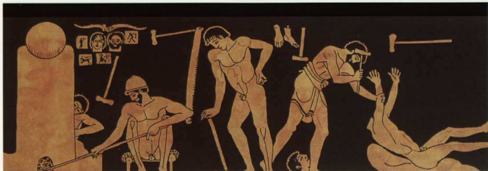
6. Δούλοι που εργάζονται σε εργαστήρι χαλκοπλαστικής.

θα υπηρετούσαν στο στρατό του, υπόσχεση η οποία τηρήθηκε. Τούτο, αν και ουσιστά σποραδικά γεγονότα, δεδωμένους ότι οι Αθηναίοι δεν συνήθιζαν να εμπιστεύονται σε δούλους την άμυνα του κράτους (ακόμα και στις ιδιαίτερα πειστικές συνθήκες του Πελοποννησιακού πολέμου μόνο προς το τέλος χρησιμοποιήθηκαν αναγκαστικά κάποιιοι δούλοι ως κωπηλάτες), εντούτοις αποτελεί μια από τις μοναδικές ομοιότητες με την πόλη-κράτος της Σπάρτης, όπου, όπως θα αναλυθεί παρακάτω (στο βαθμό που είναι εφικτό, δεδομένης της αποσπασματικότητας των πηγών), το καθεστώς της δουλείας ήταν, για ποικίλους λόγους, πολύ διαφορετικό.