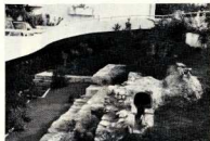
Προς το περιοδικό ΑΡΧΑΙΟΛΟΓΙΑ

Σας γράφω γιατί νομίζω πως από τήσ απλές του περιοδικού σας πρέπει να άκουσεί τό ΜΠΡΑΒΟ για τον τρόπο αναδείξης των αρχαίων που βρίσκονται στη γωνία τής Λεωφ. Βασ. Σοφίας και Πανεπιστημίου, μπροστά στό καινούριο ένδοσώμιο «Λατρώ» τής Έθνικής Τράπεζας.