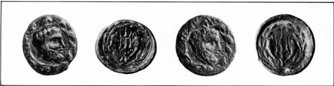
Τα δύο μοναδικά νομίσματα της πόλης της Έλικης που βρίσκονται στο Βερολίνο (Staatliche Museen zu Berlin, αρ. 27611 και αρ. 8923).

373/2 π.Χ. κατέστρεψε, με σεισμό, την πόλη. Πέντε μέρες πριν από το σεισμό τα διάφορα ζώα άρχισαν να εγκαταλείπουν την Έλικη. Την τρομερή αυτή νύχτα ένας κομήτης έκανε την εμφάνισή του στον ουράνο της Άχαϊας.