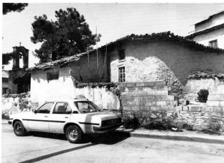
1. Τυρνάβος, Άγιος Νικόλαος τού Τουραχάν, από Ν.Α. Η εξωτερική μορφή τού ιερού μαρτυρεί τόν χρόνο κατασκευής του.

Ο Θεσσαλικός Τυρνάβος είναι γνωστός στους ιστορικούς και έρευνητές τής νεότερης ελληνικής ιστορίας σάν ένα άπ' τά πρωιμότερα έλλαδικά κέντρα στά όποια αναπτύχθηκε άνθούσα βιοτεχνία καί συνακόλουθα προσοδοφόρο έμπόριο. Τά σουλτανικά προνόμια πού τού είχαν παραχωρηθεί μέ τή μεσολάθηση τού Τουραχάν Βέη — τού κατακτητή τής Θεσσαλίας (1423) — συντέλεσαν στήν οικονομική ανάπτυξη του, πού κράτησε ώς τό τέλος τού 18ου αϊ. Τά προνόμια αυτά όί Τούρκοι τά έκχωρούσαν σέ πόλεις πού είχαν ύποταχθεί σ' αυτούς χωρίς ένοπλη αντίσταση καί άποβλέπαν στό νά παρακινήσουν τούς ύποτελείς ν' άσχοληθούν, έκ νέου, μέ τή βιοτεχνία - έμπόριο καί νά αναπτύξουν γενικά παραγωγικές δραστηριότητες γιά τήν τόνωση των οικονομικών τού νεοσχηματιζόμενου κράτους, άφοϋ όί ίδιοι, σάν πολεμικός λαός, ήταν άπασχολημένοι μέ έπεκτατικούς πολέμους'.