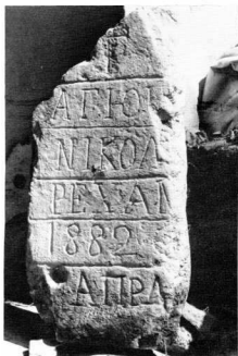
2. Τυρνάβος. Ἡ ἐγχάρακτη ἐπιγραφή τῆς ἐκκλησίας Ἁγίου Νικολάου τοῦ Τουραχάν, γιὰ τοὺς Τυρνάβιτες Ρεχάν ἢ Ρχάν.