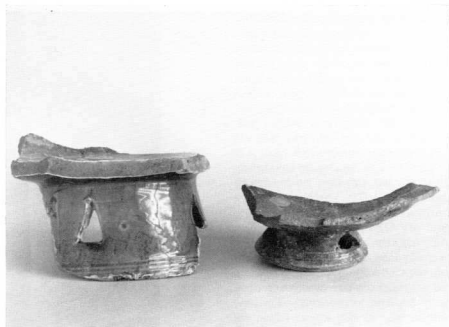
3. Βυζαντινὰ πύραυλα (chafing-dishes γιὰ τοὺς ξένοὺς ἐρευνητές). Εἶναι τὸ «κλιδάνιον: πηλινὸν ἀγγεῖον ἀνωθεν περιφερές, κάτωθεν δὲ τρήματα ἔχον». Μαγειρικὸ σκεῦος ποῦ ζεσταίαν τὰ φαγητὰ τους οἱ βυζαντινοὶ (βλ. Φ. Κουκουλές, τομ. Β', σ. 98).

Ἐπικράτησε ἡ γνώμη τοῦ Κωνσταντίνου Κούμα (1777-1836), μεγάλου τοῦ γένους δασκάλου, ποῦ στηριζόμενος σὲ θρύλο, θεωροῦσε τὸν Τουραχάν Βέη θεμελιωτὴ τοῦ Τυρνάβου. Ἀναφέρομε ὁλόκληρο τὸ χωρίο ἀπὸ τὰ γραπτά τοῦ Κ. Κούμα γιὰτὶ ἔχει μεγάλη σπουδαιότητα στὴ διερεύνηση τοῦ θέματος. Γράφει: «Ὁ Τουραχάνης οὗτος ὑπόυργος (=ὑπέρτερος) καὶ τὸν Σουλτάνον Μουράτ Β', ὁπότε ὑπέταξε τὴν Λάρισα. Εἶναι θεμελιωτὴς τῆς τρεῖς ὥρας ἀπεχούσης ἀπὸ τὴν Λάρισα πόλεως Τυρνάβου. Ἐκεῖ ἐστρατοπέδευσε ὁ Τουραχάνης, ἐνῶ ἐπιολόρηκε τὴν Λάρισα, διὰ τὸ ὑγιεινὸν τοῦ τόπου,