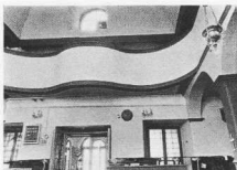
6. Ο γυαικανίτης τού ναού τής Παναγούσσας ή Γοργεπητός.

Οι ναοί αυτοί αποτελούν μιá ομάδα μονεϊσμών μέ ιστορική και αρχιτεκτονική ένότητα και έξαιρετική φυσιογνωμία. 'Ανήκουν στον τύπο τής τρικλιτης Ξυλόστεγης βασιλικής που επικράτησε, όπως είναι γνωστό, στον έλληνικό χώρο κατά τόν 18ο και 19ο. 'Η επικράτηση αυτή του τύπου έρμηγυέτηκε από όρισμένους μελετητές σαν προσπάθεια αναβίωσης παλαιохριστιανικών προτύπων και σχετίστηκε μέ τή δράση του Πατριάρχη Καλλίνικου τού Δ'. 'Η καθολική όμως