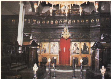
Τό ζωγραφιστό τέμπλο του ναού της Ύπαναντης.

Ένας μεγάλος αριθμός φορητών εικόνων από τη Θεσσαλονίκη από τα καλύτερα παραδείγματα του είδους, άδημοσίευτες για την ώρα, δεν μπορεί να καλύψει την έλλειψη της μνημειακής ζωγραφικής στην πόλη. Εξάλλου η δράση δύο ζωγραφικών εργαστηρίων με χαρακτηριστικά «οικογενειακή παράεα» που έχουν έπισημανθεί στα περίχωρα της Θεσσαλονίκης, τó ένα στη Γαλάτιστα (τέλος του 18ου - άρχές του 19ου αιώνα) και τó άλλο στην Κολακία 17 (Χαλάστρα 19ος αιώνας) πλουτίζουν τις γνώσεις μας για τή ζωγραφική της περιοχής και βοηθούν στην κατανόηση τού προβλήματος.