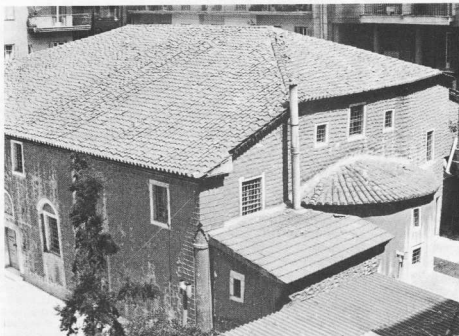
1. Ναός Ἁγίου Ἀθανασίου, νοτιοανατολική πλευρά.