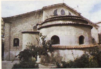
4. 5. Ναός Άγιου Μηνά, α. πάνω μέρος της πρόσοψης, β. Εξωτερική όψη της κόγχης του ιερού.