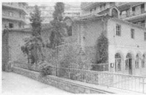
2. Νεὸς Παναγοῦδας ἡ Γοργοπηκκοῦ, βορειοδυτικὴ πλευρὰ.

Στὰ τέλη τοῦ 18ου καὶ στὴν ἀρχὴ τοῦ 19ου αἰῶνα ἡ ἐθνικοβηρκαϊκὴ συνείδησι τοῦ πληθυσμοῦ τῆς Θεσσαλονικῆς ἀλλάζει. Οἱ Μουσουλμάνοι (Τούρκοι, γενίταροι, Ντονωμεδες, Ἀλβανοὶ) ἀνέρχονται εἰς 30 χιλιάδες, οἱ Ἕλληνες εἰς 16 χιλιάδες καὶ οἱ Ἑβραῖοι εἰς 12 χιλιάδες. Παρόλο ὅμως ποὺ στὸ χῶρο τῆς οἰκονομίας καὶ