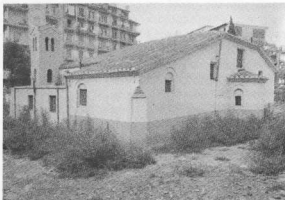
3. Νεὸς Παναγίας Λαγυδιανῆς ἡ Λαγυδιῆσαι, νοτιοδυτικὴ οἰκὴ μετὰ φαλτοσυγνῆ.

προπαντὸς στὸ ἐμπόριο, ἀρκετοὶ Ἕλληνες τῆς Θεσσαλονικῆς ἀρχίζουν νὰ διακινῶνται καὶ νὰ σχηματίζουν περιουσίες, γεγονότα ὅπως οἱ ἐξισλαμισμοὶ καὶ ἰδιαίτερα τὸ παιδομαζωμὸ ἔχουν ἐξαιρετικὰ δυσμενεῖς δημογραφικὲς ἐπιπτώσεις γιὰ τὸν Ἑλληνομῆτι τῆς πόλης. Ἡ Θεσσαλονικὴ, τόπος συνάντησης ἀνάμεσα σ' Ἀνατολὴ καὶ Δύση, θὰ παραμείνῃ μιὰ δεσποζουσα κυριαρχικὴ πόλι στὰ νότια Βαλκάνια - σταυροδρόμι καὶ ἀντανάκλαση πολιτικοῦ καὶ στρατιωτικῆς περιφέρειας μετὰ τὴν Τουρκοκρατία. Ἐδρὰ σαντζακιοῦ, δηλαδὴ μιᾶς μικρῆς στρατιωτικῆς περιφέρειας μετὰ ἀνυπακοῆς τουρκικοῦ ἐξωμωτοῦχου θὰ δεχτεῖ καὶ θὰ αισθανθεῖ τὴν τουρκικὴν καταπίεσι καὶ σκληρότητα περισσότερο ἀπὸ ἄλλες ἐλληνικὲς πόλεις. Γνωστὴ εἶναι ἡ συμφορὰ ποὺ ἐπλήξε τὸς Θεσσαλονικεῖς μετὰ τὴ ναυμαχία τῆς Ναυπάκτου (1571), ἀλλὰ καὶ οἱ σφαγῆς καὶ οἱ λεηλασίες ποὺ ἀκολούθησαν μετὰ τὴν ἀποτυχία τῆς ἐπανάστασης στὴ Χαλκιδική.