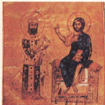
10. Αλέξιος Α Κομνηνός (1081 - 1118) οργανώνει από τήν Θεσσαλονίκη τούς πολέμους κατά τών Νορμανδών.