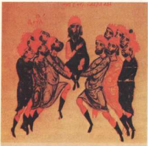
9. Ο Πέτρος Ντελιάν (Δελεσάνος) ανακηρύσσεται βασιλέας της Βουλγαρίας (χρονογραφία Ι. Σκυλιτζή). Εν τώ μεταξύ ο Άλουσιάνος, γιος του Ίων. Βλαδιλάδου πού ζει στη Κωνσταντινούπολη, δραστηρεύει κι εντάσσεται στο στρατό του Ντελιάν. Μετά την ήττα τους στη Θεσσαλονίκη, ο Άλουσιάνος αιχμαλωτίζει τόν Ντελιάν και τόν παραδίδει στους Βυζαντινούς. Γι' αὐτήν τήν πράξη του παίρνει τόν τίτλο του μαγίτηρου.