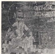
11. Ευστάθιος Θεσσαλονίκης (περίπου 1125 - 1194). Τοιχογραφία τού 14ου αι. στή Μονή Γκρατσόστας τής Σερβίας. Γίνεται μητροπολίτης Θεσσαλονίκης τό 1175. Κοινωνιστοπολιτική είχε ως τότε σταδιοδρομεί ως μάστορ τών ρητόρων, είχε γραφεί τó αρχάλο στόν Όμηρο, Πιθάρου και Αριστοφάνη. Ανθρώπινης, φιλελεύθερου πνεύμα, δέν άσολήθηκε μέ τή δογματική αλλά μέ τήν αναμόρφωση τής Εκκλησίας.

“Άλπεων», ή άγορά γινόταν έξω από τά δυτικά τείχη, οι σκηνές τών έμπορων τοποθετημένες ή μία δίπλα στήν άλλη σχηματίζουν κάθετους και όριζόντιους δρόμους, όπως στά παζάρια τών σημερινών ανατολικών πόλεων. Τά προϊόντα φθάνουν από τήν Βοιωτία, Πελοπόννησο, Ίταλία, Φοινίκη, Αίγυπτο, Ίσπανία, Ήράκλειες Στήλες, Ό Βενιαμίν Τουδέλης, τό 1160, αναφέρει ότι υπάρχουν 500 τεχνίτες τής έθραϊκής κοινοτήτας.