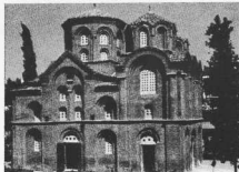
8. Ν. ὀψη τῆς Παναγίας τῶν Χαλκεῶν. Ὁ νοὸς εἶναι ἀποκτομένος τὴν τεχνικὴ τῆς κρυσμένης πλίνθου, δηλ. ἐπῶλληες σειρὲς πλίνθων, καθὲ δεύτερη σειρὰ καλυπτεται μὲ τὸν ἄρμω ὡστε ἡ ὀψη τῆς τοιχοδομίας νὰ εἶναι σειρὰ πλίνθων καὶ σειρὰ ἰσοπαχων ἄρμων.

Μετὰ τὸν θάνατο τοῦ Βασιλεῖος Β' (1025), ἡ αυτοκρατορία ἐξερκολεῖται νὰ εἶνε στιγμῆς μεγαλειού, σπριγμένη κυρίως στὴν καλὴ διοικητικὴ καὶ διεύθυνση τῶν προβλημάτων ἀπὸ τοὺς προηγούμενους αυτοκράτορες. Ἡ πραγματικὴ γίνεται ὅσο ποτὲ ἄλλοτε τὸ κέντρο τῆς ζωῆς καὶ τοῦ μεγαλειού τῆς αυτοκρατορίας, ἐνῶ ἡ ἐπαρχία παραμελεῖται. Ἡ Θεσσαλονίκη εἶναι ἰσως ἡ μόνη ἀδύνατη πόλη ἐκτός ἀπὸ τὴν πρωτεύουσα.