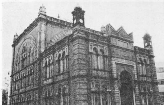
4. Τό Γενί Τζαμί, τό τζαμί τών ντονμεδών, στην Θεσσαλονίκη, όπου κυριαρχούν μορφολογικά στοιχεία Άναγέννησης και Μπαρόκ, ενώ ένν βυζαντινές, ισλαμικές και νεοκλασικές επιδράσεις.

Άπό τό 1880 πού κτίζεται, διατηρείται μέχρι σήμερα άνέπαφη από τίς πυρκαϊές ή περιοχή τών «λαδάδικων», ανάμεσα στην θάλασσα και