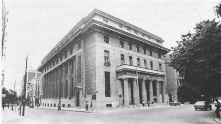
10. Ἡ Τράπεζα τῆς Ἑλλάδος, ὁργανωμένη μὲ αὐστηρὸ νεοκλασικὸ ρυθμὸ.