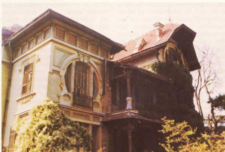
7. Η οικία Φερνάντες — «Καζα Μπάνκα» — σε νεογοτθικό ρυθμό μέ στοιχεία Art-Nouveau.