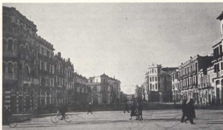
6. Η πλατεία Αγ. Σοφίας στα 1928, χαρακτηριστικό δείγμα άρχιτεκτονικού συνόλου τής έκλεκτικιστικής περιόδου τής Θεσσαλονίκης τήν δεκαετία του '20.

Χαρακτηριστικά παραδείγματα άποτελούν: Τό Όρφανοτροφείο «Μέλισσα» — έπαυλη του Τούρκου έμπορου Όσμαν Άλή Μπέη (1897), ή Βίλλα Μορντώχ — κτισμένη τό 1905 γιά τόν Τούρκο μέγαρχο Σειφουλιά πασά, έργο του άρχιτέκτονα Ξ. Παιονίδη, ή οικία Μιχαηλίδη — έπαυλη του