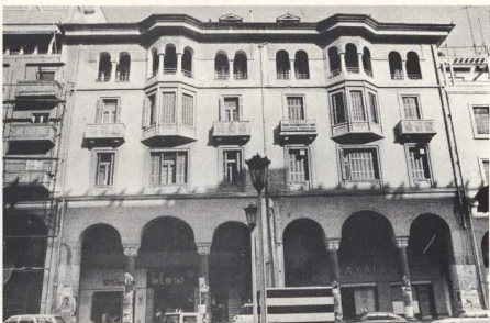
8. Κτίριο τής οδού Αριστοτέλους μέ τήν χαρακτηριστική όργάνωση σε νεοβυζαντινό ρυθμό.