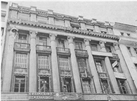
11. Κτίριο τῆς ὁδοῦ Βενιζέλου 3.