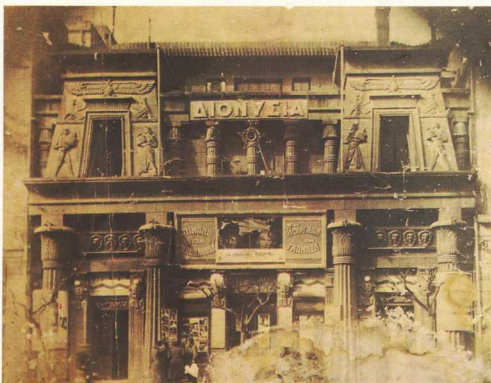
Ο κινηματογράφος Διονύσια, σε νεοαιγυπτιακό ρυθμό (κατεδαφίστηκε).