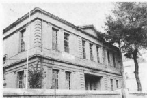
1. Η Μεγάλη Αστική Σχολή της ελληνικής κοινότητας της Θεσσαλονίκης, κτισμένη σε νεοκλασικό ρυθμό.