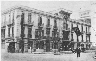
5. Τό Ξενοδοχείο Ματζετίτι, σέ νεομαρκ ρυθμό. (Έχει καταφασίσει).