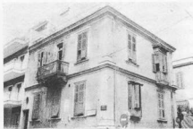
2. Οικία στην οδό Σπάρτης — περιοχή Αγ. Τριάδος — όπου οι έξωτερικές σφίξες οργανώνονται με έλεγχο νεοκλασικών και παραδοσιακών στοιχείων (ξύλινων «ασχισιών»).