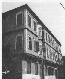
3. Το σχολείο της οδού Κριστου σήμερα, στην πάνω πώλη χαρακτηρίζεται για τον νεοκλασικό διάκοσμο των έξωτερικών όψεων, ενώ ή όλη τυπολογία και μορφολογική δομή παραμένει ή γνωστή του παραδοσιακού θολοκκοικού σπιτιού.

Άλλες τράπεζες είναι ή άυτορροισμαρλιτική Χίρς, ή τοπική Ισραηλιτική τράπεζα της Θεσσαλονίκης των Άλλατινί, ή τράπεζα της Άνατολής, άποτέλεσμα της συνεργασίας της Γερμανικής Τράπεζας και της Έθνι-