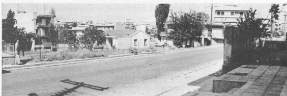
1, 2. Προϊστορικοί οικισμοί Σταυρούπολης.

Οι προϊστορικοί οικισμοί που εντοπίστηκαν στη Θεσσαλονίκη βρίσκονται έξω από την κατοικημένη, σ' όλες τις εποχές, πόλη, δηλαδή έξω από τό χώρο που ορίζουν τα βυζαντινά τείχη. Παρόλη τη διαρκή αναμόχλευση των χωμάτων, ή πιθανότητα να βρεθεί προϊστορική θέση και μέσα στην πόλη δεν πρέπει θέβαια να αποκλεισθεί.