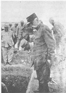
5. Ο στρατηγός Σαράγι κατά τη διάρκεια των γαλλικών άνασκαφών (άπό τό βιβλίο του Rey).