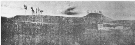
7. Ο προϊστορικός οικισμός Βαρδάρφτσα - Άξιοχωρι (άπό τό βιβλίο του Rey).