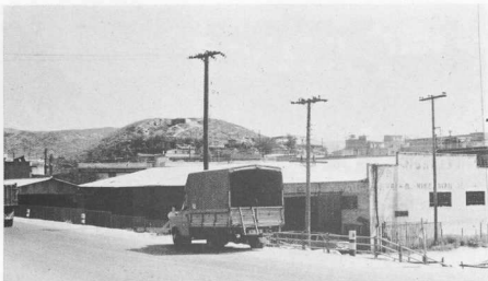
3. Προϊστορικός οικισμός Λεμπέτ.

Στό σημείο αυτό ίσως ή άναγνώστης έκφράσει την έξηξ εύλογη άπορία: Καλά όλα αυτά: και ή έλληνική πλευ-