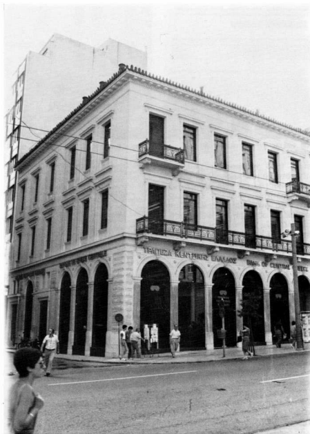
Τραπεζα Κεντρικής Ελλάδος.

σάν δυναμικό χαρακτηριστικό της. Το κτίριο υπέστη μία «διαφανοποίηση» συγχρόνως με την αλλοίωση της κάτοψής του που ίσως ταιριαίζει στη «σύγχρονη αντίληψη» της αρχιτεκτονικής των Τραπεζών, καταστρατηγεί όμως κατάφωρα την ιστορική οντότητα του κτιριακού παραδοσιακού οργανισμού.