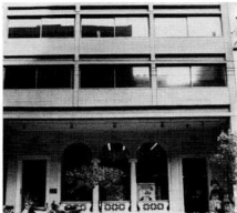
Όδ. Φιλελλήνων, όπου το πρώην Μέγαρο Κοσδώνη