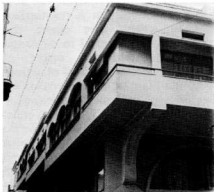
Εμπορικό Κέντρο Πλάκας.