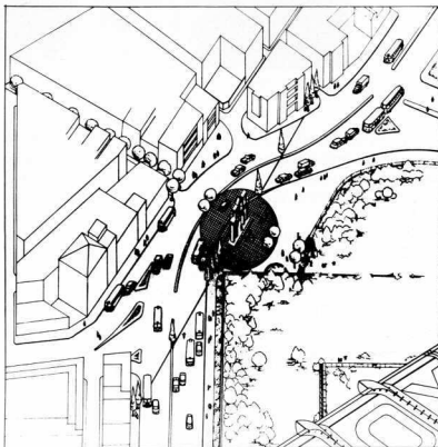
Είσοδος του Όλυμπιου στόν άξονα τής οδού Λυσικράτους.