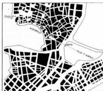
Στό σχέδιο, φαίνεται ή σχέση τής Πύλης με τήν παλιά πόλη τού Θησέα και με τήν νέα τού ‘Αδριανού.