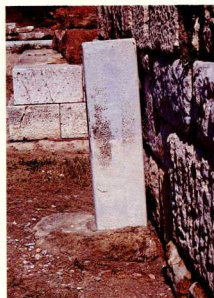
4. «Όρος Κεραμεικού», δίπλα στό τείχος της πόλης.