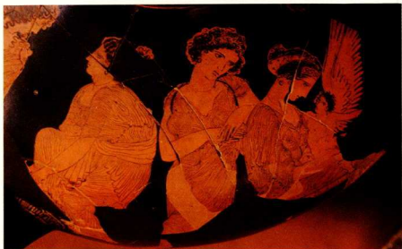
6. Ύδρια του ζωγράφου του Μειδία από έναν τάφο στην Ίερα όδο.