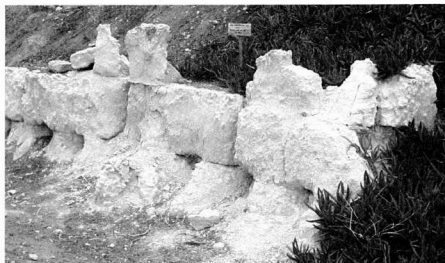
9. Κατεστραμμένοι πυλώριθοι ενός τείχους.