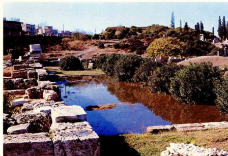
2. Ο ‘Ηριδανός και η ‘Ιερά οδός εμπρός από την ‘Ιερά Πύλη.

Τώρα πιά ήταν ζήτημα χρόνου και φυσικά και χρηματικών πόρων, για νά βρεθούν και τά άλλα μνημεία και κτίσματα που ήταν γνωστά από τις ιστορικές πηγές στην περιοχή των