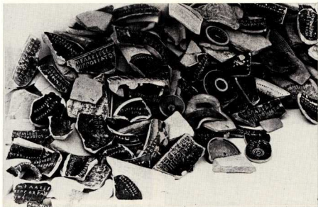
7. Ώστρακα από την όστρακογραφία κατά του Μεγακλή.

άλλά και νά δοθεί στους ενδιαφερόμενους μελετητές μία εικόνα της ζωής στην Αρχαιότητα, — προσπάθεια που είναι αυτόνοστη γιά κάθε αρχαιολόγο και ύλοποιείται μέ διάφορους τρόπους. Σημασία έχει νά δοθεί στους επισκέπτες μία εύσυνωπτη εικόνα των εύρημάτων, αλλά και νά άποκατασταθούν στην άρχική τους κατάσταση τά άγγεια: επίσης νά τακτοποιηθεί γενικά ό χώρος των άνασκαφών. Φυσικά, στην κατανόηση βοηθά και ή σωστή και σαφής έκθεση των εύρημάτων όσο τό δυνατό πλησιέστερα στον τόπο που άνακαλύφθηκαν. Άν μάλιστα ένα τέτοιο μουσείο στεγάζεται μέσα σ' ένα επί τόπου κατασκευασμένο κτίριο — άναπαράσταση του άρχαίου κτιρίου — όπως συμβαίνει μέ τή Στοά του Άττάλου που άνοικοδομήθηκε από τους Άμερικανούς άνασκαφείς της Άγοράς μέ μεγάλες δαπάνες, τότε ή παραστατικότητα είναι ίδανική.