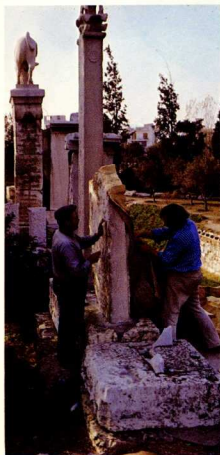
11. Αντίγραφο τής επιτύμβιας στήλης τού Κορραλλίου στη νότια πλευρά

'Από τό 1957, με την κατασκευή αντίγραφων τού επιτύμβιου μνημείου