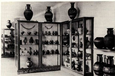
5. Μουσείο Κεραμεικού, έκθεση γεωμετρικών κτερισμάτων από τις ανασκαφές.