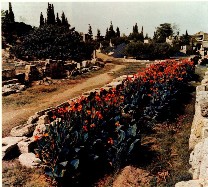
8. Σύγχρονα φύτεμα μιάς περιοχῆς τοῦ Κεραμεικοῦ.

εἰσδύουν μέσα στά κενά και κατορθώνουν στό τέλος νά σπάσουν και τή σκληρότερη πέτρα. Αὐτή ἡ ἀνεξέλεγκτη βλάστηση εὐκόλα ἀπλώνεται στη λεκάνη τοῦ Κεραμεικοῦ, ἀπ' ὅπου περνά ὁ Ἡριδανός, και ὅπου σήμερα, σέ σύγκριση μέ τήν Ἀρχαιότητα, ἡ στάθμη τών ὑπογείων ὑδάτων εἶναι πολύ ψηλότερη. Γι' αὐτούς τοὺς λόγους, ὁ περιορισμός τής βλάστησης εἶναι ἀπαραίτητος και ἀποτελεῖ μόνιμο καθήκον. Ἡ χρήση ὁμως χημικῶν μέσων γιά τήν καταπολέμηση τών ζιζανίων σέ μιά περιοχή γεμάτη ἀπό μικρά ζῶα ὅπως χελῶνες, βατράχους, πουλιά και ψάρια εἶναι ἀνεπιτρεπτή. Ἐπιπλέον, ἡ ἐπίδραση τῶν χημικῶν οὐσιῶν στίς ἀρχαίες πέτρες εἶναι ἀκόμα ἀγνωστή. Ἐπομένως τά ζιζάνια πρέπει νά ἀπομα-