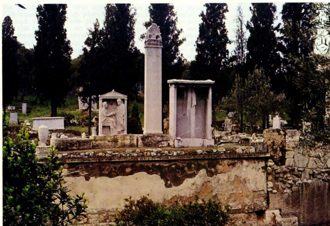
1. Νότια πλευρά - Ταφική οδός, τάφος του Αγάθωνα από την Ήρακλεια.

Τό 1913 ή έλληνική κυβέρνηση παραχώρησε στό Γερμανικό Άρχαιολογικό Ίνστιτούτο τό δικαίωμα τής διενέργειας άνασκαφών στά δυτικά όρια τής τότε Άθήνας, πού είχε άρχίσει νά έπεκτείνεται σιγά σιγά. Ήταν ή περιοχή πού οι έρευνες τής έν Άθήναις Άρχαιολογικής Έταιρείας είχαλ ηδη άναγνώρισει ώς τόν Κεραμεικό (εικ. 1).