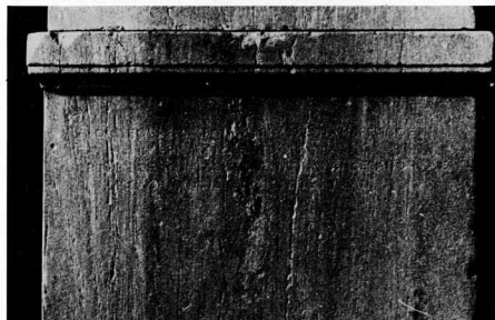
10. Έπιγραφή μιάς επιτύμβιας στήλης της Πρεσβείας των Κερκυραίων, α. Φωτογραφία του 1910, β. Φωτογραφία του 1970