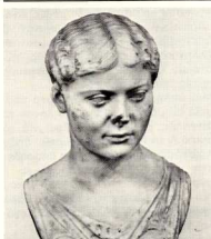
— Ρωμαϊκή μαρμαρίνη προτομή νεαρού κοριτσιού, Μουσείο του Neuchâtel.