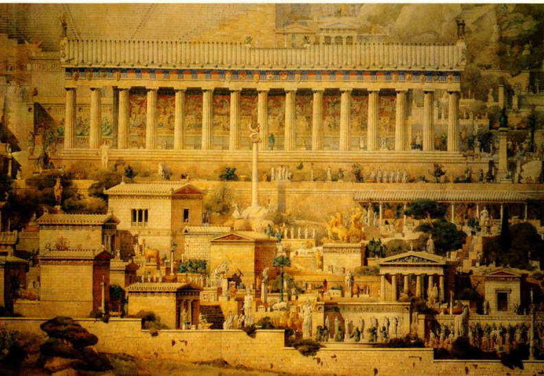
6. Δεξιόφ., Ἱερά ὁδὸς καί ναὸς τοῦ Ἀπόλλωνα, λεπτομέρεια τῆς γενικής ἀνασκόπησης ἀπὸ τὸν A. Tournaire (1894).