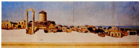
1. Ναός του Διδυμίου Ἀπόλλωνα, τομή τῆς ἀνασκαφῆς ἀπὸ τὸν Α. Thomas (1875).

Στὸ τελευταῖο τέταρτο τοῦ 19ου αἰώνα μία ἔντονη ἀνάγκη ἀνανέωσης γίνεται αἰσθητὴ τόσο ἀνάμεσα στοὺς ἀρχιτέκτονες ὅσο καὶ στοὺς ἀρχαιολόγους, πού ἀπομακρύνονται ἀπὸ τὴν Ἀττικὴ πηγαίνοντας πρὸς τὴν Πελοπόννησο, τὶς Κυκλάδες ἀκόμα καὶ τὴ Μικρὰ Ἀσία. Ποτέ, μέχρι τότε, ἡ συνεργασία ἀρχιτεκτόνων καὶ ἀρχαιολόγων δὲν ὑπῆρξε τόσο στενὴ, ὅσο στὴ δευτέρῃ αὐτῇ περιόδῳ. Ἔτσι εἶναι πολὺ δύσκολο νὰ πεῖ κανεὶς ποῖς — ὁ ἀρχιτέκτονας πού κέρδισε τὸ Βραβεῖο τῆς Ρώμης ἢ ὁ ἀρχαιολόγος — εἶναι αὐτὸς πού προσδιορίζει τὴν ἐπιλογή καὶ τὶς θέσεις πού υἱοθετοῦνται. Ἡ συμβῶσις εἶναι ἀναμφισβήτητη καὶ πρέπει οἱ σημερινοὶ ἀρχιτέκτονες νὰ λαμβάνουν ὑπόψη τους τὸ γεγονὸς αὐτό, ὅταν ἐκφέρουν κρίσεις, συχνὰ αὐστηρές, γιὰ τὸ ἔργο τῆς ἐποχῆς ἐκείνης.