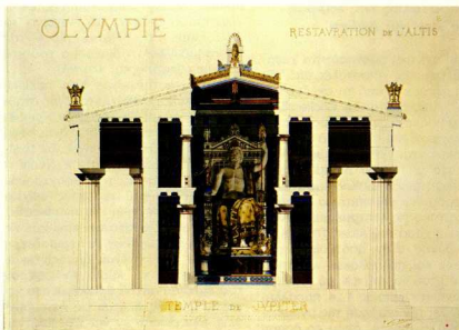
4. Ναός του Δία στην Όλυμπια, τομή αναπαράστασης του V. Laloux (1883).

Λίγο άργότερα, κατά τις άνασκαφές του Καθβαδία, οι ναοί της 'Επιδούρου θά τραδηθούν τήν προσοχή του Defrasse. Άν τό γενικό ύψος της