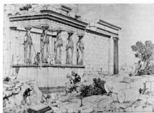
Σχέδιο άνωμυμού. Οι Καρυάτιδες στις άρχές τού 19ου αιώνα (Paris, Bibl. Nationale, Cabinet des Estampes).

'Ενώ περίμεναν, μέσα σ' ένα κλίμα αστήχυτου συντηρητισμού, την έπισημη άδεια γιά τ' ταξίδι στην 'Ελλάδα,