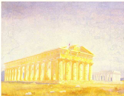
Προοπτική ἀποψη τῶν ναῶν τῆς Ποσειδωνίας τοῦ R. Mirland, 1915 (Παρίσι, ENSBA).

Πολλές πρόσφατες ἐργασίες, ἀνάμεσα στίς ὁποῖες ξεχωρίζει ἐκείνη τῆς Φ. Μ. Τσιγκάκου μέ τόν τίτλο «Ἀνακαλύπτοντας τήν Ἑλλάδα» (1981), ἀποκαλύπτουν τό ἐνδιαφέρον πού ἔχουν, γιά τήν ἱστορία τῆς ἑλληνικῆς ἀρχαιολογίας, οἱ μελέτες καί τά σχέδια τοῦ 19ου αἰώνα. Ἀπό καιρό εἶναι ἤδη γνωστή ἡ συμβολή τῶν Ἀγγλων καί τῶν Γερμανῶν στόν τομέα αὐτόν, ἐνώ παραμένει στό σκοτάδι ἡ ἀντίστοιχη δουλειά μιᾶς ὁμάδας Γάλλων, πού ἐργάστηκαν, στό διάστημα 1845-1937, γιατί εἶναι ἀκόμα ἀδημοσίευτη ἡ ἐλάχιστη γνωστή ἀπό βιβλία μεγάλου σχήματος (in folio) μέ ἡλιογραφίες. Οἱ ἐργασίες αὐτές πρωτοπαρουσιάστηκαν στό Παρίσι, στήν Ἀνωτάτη Σχολή Καλῶν Τεχνῶν (ENSBA), πρόσφατα δέ ἤρθαν καί στήν Ἀθήνα, πρὶν ἐκτεθοῦν στίς Ἡνωμένες Πολιτεῖες. Ἀξίζει λοιπόν νά ἀφιερῶσουμε μερικές σελίδες στήν παρουσίασή τους.