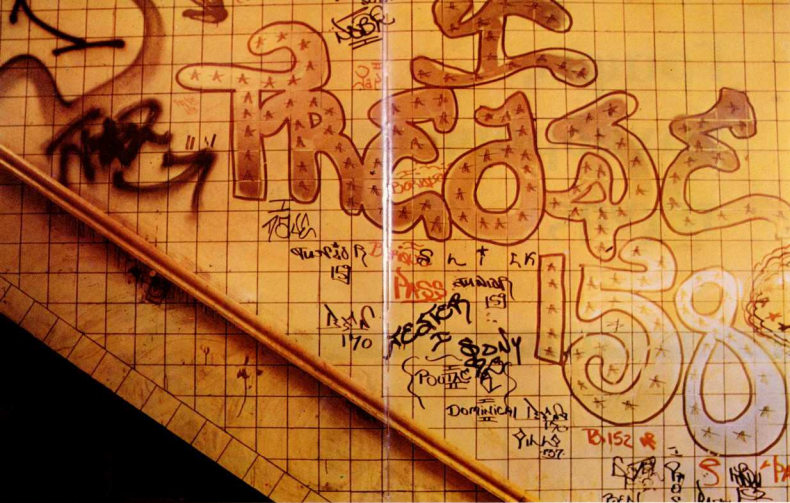
Από το βιβλίο «Η θρησκεία των γραφίτι», κείμενο N. Mailer, Η.Π.Α. 1974.