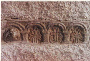
Το «Μικρασιατικόν θέμα»

Εγχάρακτο «πλοίο» σε εξωτερική δομική λίθο της μεσαιας κόγχης του ιερού του εκκλησιδίου Αρχάγγελος – Χορτοκόπι. Το εκκλησίδιο, με την ιδιόρρυθμη αρχιτεκτονική και τα καλλιπαστικά στοιχεία αρχαίων και μεσαιωνικών χρόνων, ανήκει στη Μονή Γαλατάκι – (περιοχή ευβοϊκών Αιγών του Ποσειδώνος) και απέχει 16 χλμ. από το σημερινό Ελύμνιο – Λίμνη.