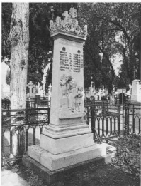
1. Τάφος οικογένειας Ταρβάκα. Στη βάση της στήλης η επιγραφή: Γ. ΜΑΛΑΚΑΤΕΣ ΕΠΟΙΕΙ ΕΝ ΑΘΗΝΑΙΣ (φωτ. Μ. Βερνάρδος, 1973). 2. Τάφος Ελένης Σκουτερλή. Χαρακτηριστικό έργο του Ιωάννου Μολακάτ. Η επιγραφή στην κορυφή της στήλης: ΕΝΘΑΔΕ ΚΕΙΤΑΙ ΕΛΕΝΗ Π. ΣΚΟΥΤΕΡΛΗ ΓΕΝΝΗΘΕΙΣΑ ΕΝ ΒΟΛΩ ΤΗΝ 17 10ΒΡΗΟΥ ΤΟΥ ΕΤΟΥΣ 1852 ΑΠΟΒΙΒΑΣΑ ΤΗΝ 16 7ΒΡΗΟΥ 1873 (φωτ. Μ. Βερνάρδος, 1973).