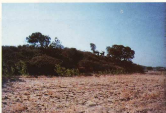
4. Ο λόφος του Αγίου Φιλώρου με τον προϊστορικό συνοικισμό.