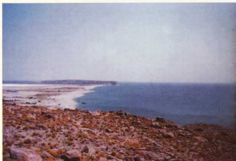
2. Πύργος Αλυκής, γενική άποψη.