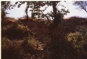
5. Ώστρακα αγγείων και Ιθίβιον εργαλεία από τον Αγ. Φιλώρο.

Ίμβρου και Τενέδου. Οι περιηγητές και οι αρχαιολόγοι που επισκέφθηκαν την Ίμβρο δεν αναφέρουν αρχαιολογικές θέσεις με λειψάνα παλαιότερα της κλασικής εποχής. Πρώτος ο αρχιμανδρίτης Βαρθολομαίος Κουτλουμουσιανός όχι μόνο υπέθεσε ότι το σμηρικό άστυ της Ίμβρου βρίσκεται στη νότια ακτή του νησιού, την πιο προσιτή σε όσους έρχονταν από τα μυκηναϊκά κέντρα της νότιας Ελλάδας, αλλά και θεώρησε πιθανή την ταύτισή του με τα ερείπια που είχε εντοπίσει στη θέση Πύργος, αμέσως δυτικά της Αλυκής 7 . Η θέση προσφέρεται επειδή βρίσκεται δίπλα στη θάλασσα, πάνω σε χαμηλό ύψωμα κατάλληλο για την εξυπηρέτηση των αναγκών ενός οχυρωμένου προϊστορικού συνοικισμού (εικ. 1, 2). Πράγματι, το καλοκαίρι του 1990 διαπιστώσαμε ότι πάνω στο συγκεκριμένο λόφο, όπως επίσης και στον απέναντι, ανατολικό της Αλυκής, σώζονται τμήματα τείχους (εικ. 3), θεμέλια οικοδομών και κομμάτια πήλινων αγγείων που χρονολογού-