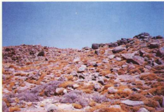
3. Πύργος Αλυκής, τμήμα του τείχους.