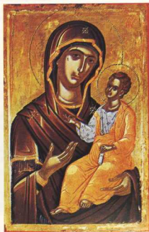
Βρεφοκρατούσα (Μονή Σταυρονικήτα).