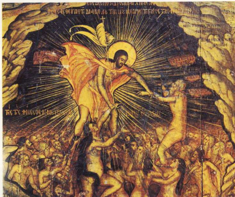
Η κάθοδος στον Άδη. Ο Χριστός τείνει το χέρι τόσο στον Αδάμ όσο και στην Εύα (μεταβυζαντινή εικόνα).

Από την κρίση θγαίνει ο άνθρωπος δεχόμενος ως ισότιμα τα δύο φύλα.