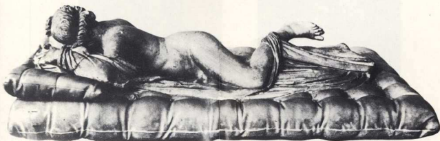
Ελληνιστικό γλυπτό Ερμαφρόδιτου.

Ο Δορυφόρος (αντίγραφο έργου του Πολύκλειτου, 5ος π.Χ. αι.). Πρόκειται για τον γνωστό «κανόνα».