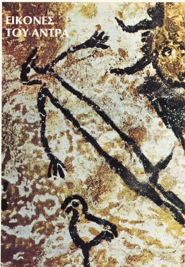
Σπήλαιο του Λασκώ, Γαλλία. Ίσως μυθολογική σκηνή, στην οποία βλέπουμε άντρα ξαπλωμένο μπροστά σε θίσονα (15.000 π.Χ.).