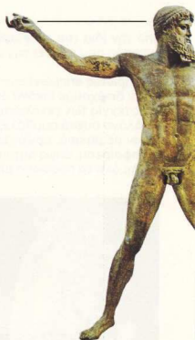
Ο Ποσειδώνας είναι θεός της θάλασσας