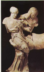
Ανάγλυφο από το δυτικό αέτωμα του ναού του Διός στην Ολυμπία, 5ος π.Χ. αι. Τμήμα από τη μάχη Κενταύρων και Λαπίθων.

Η γυναίκα είναι η «γονιμότητα», είναι η «μητέρα». Αυτή δίνει τον καρπό, αυτή γεννά τους άντρες.