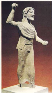
Ο Δίας κρατά τον κεραυνό (Κύπρος, βος π.Χ. αι.).