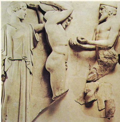
Μετάφη της ανατολικής πλευράς του ναού του Δία στην Ολυμπία, 5ος π.Χ. αι. Ο Ηρακλής κρατά τον ουρανό ενώ ο Άτλας του προσφέρει τα μέλα των Εσπερίδων.

Άντρας στηρίζει τη γη και τον ουρανό, είτε είναι ο Άτλας είτε ο Ηρακλής, που τον αντικαθιστά για λίγο.