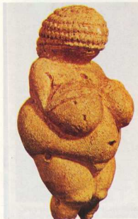
Η Αφροδίτη του Βιλέντορφ. Βιέννη. Έργο της παλαιολιθικής εποχής.

Τα κρανία των παλαιολιθικών ανθρώπων που έχουν βρεθεί μαρτυρούν αναλογίες όμοιες με τις δικές μας γιατί λοιπόν να υποθέσουμε ότι οι άντρες είχαν διαφορετική μύτη, ενώ οι γυναίκες ήταν σαν κι εμάς σήμερα;