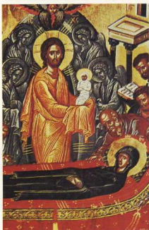
Κοίμηση της Θεοτόκου (Μονή Σταυρονικήτα).

Σήμερα που διανύουμε τη Χριστιανική εποχή, είδαμε ξανά τον άνθρωπο στην πνευματική του υπόσταση. Δεν υπάρχει πια διαμάχη ανάμεσα στα δύο φύλα, αφού είναι ισότιμες ποιότητες που εκφράζονται διαφορετικά.