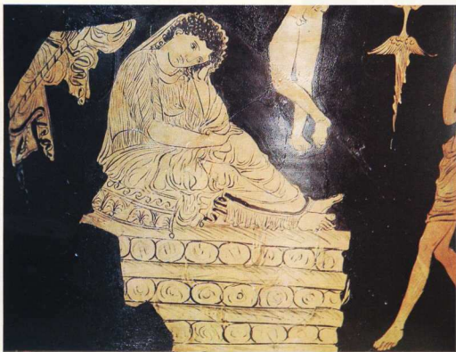
Ο Αμφιτρώων είχε ως σύζυγο την Αλκμήνη. Πριν επιστρέψει από την εκστρατεία του εναντίον του Πτερέλαιου, ο Δίας πήρε τη μορφή του και ξεγελώντας την Αλκμήνη ζευγάρωσε μαζί της για να γεννηθεί ο Ηρακλής. Όταν επέστρεψε ο αληθινός Αμφιτρώων έμαθε τι είχε συμβεί από την ίδια την ανυποψίαστη Αλκμήνη. Τότε άναψε πυρά για να την κάψει... (Ερυθρόμορφος κρατήρας του 5ου π.Χ. αι.).