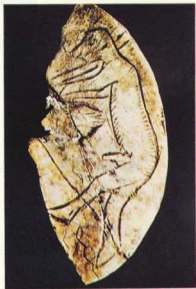
Mas-d'Azil, Γαλλία: κόκαλο, 7 εκ. Εδώ παριστάνεται όρθιος άντρας που κρατά μακριά αντικειμενο ακουμπισμένο επάνω στον ώμο του.

Στις πρώτες απεικονίσεις του ανθρώπου λιγοστές είναι εκείνες που παριστάνουν άντρα. Όταν δε έχουμε εικόνα άντρα, το πρόσωπο στερείται νατουραλισμού, κι αυτό δεν είναι κακοτεχνία των εκτελεστών αλλά, όπως έγραψε ο A. Leroi-Gourhan, γίνεται από πρόθεση. Το άλογο συχνά συμβόλιζε το αρσενικό στοιχείο, γι' αυτό το πρόσωπο του άντρα εικονιζόταν με μακριά, οριζόντια μύτη, που του προσέδιδε ζωώδη-αλογίσια μορφή. Πρόκειται για αφαίρεση, όπως αυτή που θα δούμε, αιώνες αργότερα, στην ελληνική ζωγραφική που ήθελε όλα τα πρόσωπα με «ελληνική» μύτη.