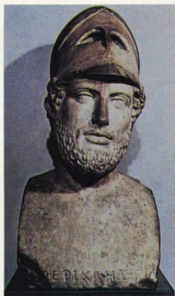
Περικλής, ρωμαϊκό αντίγραφο έργου του Κρησίλα.

Η σύλληψη, ο σχεδιασμός και η δημιουργία έργων είναι αντρικό προνόμιο.