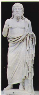
Ηράκλειτος, ρωμαϊκό αντίγραφο.