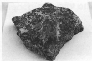
Κορμάτιο πηθάρου με λαθή.