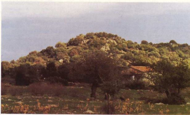
Ύψωμα Αγγουρέλια (καὶ ὁ Αἰ-Γιάννης).

νῶν πόλεων (τῆς πάλαι ποτὲ Αἰολίδας), ἀφοῦ ἡ σκαπάνη τῆς Ἀρχαιολογικῆς Υπηρεσίας ἐβγάλε στο φῶς ὀρισμένες ἐνδείξεις στὴ Μυτιλήνη καὶ στὴ Μήθυμνα. Διάσπαρτα ὅμως στὸ νησί θρῖσκονται ἀπομεινάρια αὐτῆς τῆς ἐποχῆς, ὅπως λίθινα εργαλεῖα καὶ ὄστρακα ἀπὸ αγγεῖα, ποῦ φαίνεται ὅτι ἀνήκαν σε μικρότερες ἐγκαταστάσεις, ὅπως π.χ. σε ἀγροτικὸς οἰκισμοῦς. Χαρακτηριστικά εἶναι τὰ αγγεῖα ἀπὸ τὸ σπήλαιο τοῦ Ἁγίου Βαρθολομαίου στὸ Καγιάνι, οἱ θέσεις Λέπερνα καὶ Ποταμιὰ τῶν Χιδήρων 9 , ἡ Πλάτη τῶν Νέων Κυθωνίων (ὄστρακα), ὁ Κατάπυργος 10 τοῦ Λισθορίου, ὁ Ποδαράς 11 καὶ τὸ Ταβῆρι τοῦ Μεσότοπου, ὅπου παρατηροῦνται ἰχνη προϊστορικῶν οἰκισμῶν. Ἐπίσης στὸν λόφο τοῦ Προφήτη Ἡλία τῆς Ἁγίας Παρασκευῆς 12 καὶ στὴν Ἀντικρινὴ Μόσυνα (εργαλεῖα καὶ ὄστρακα αγγείων). Εἶχε λοιπὸν τὸ νησί ἐκεῖνη τῆ