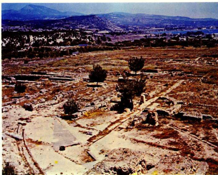
Ίσθμια. Τό στάδιο με τό τριγωνικό σημείο εκκίνησης τών άθλητών. Φαίνεται καθαρά και τό ηηγοδά κι μέσα στό όποιο καθόταν ό άφειτς.