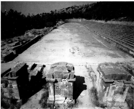
Δελφοί: Το στάδιο στην πλαγία του θουονού

Τό ιερό αυτόν, στό όποιο άπό τό 582 π.Χ. τελούσαν ανά διετία άγώνες, βρίσκεται στην θέση του σημερινού