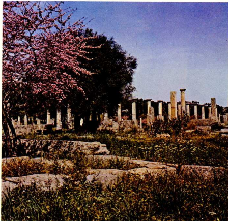
Όλυμπία, τό ιερό τής Ήρας