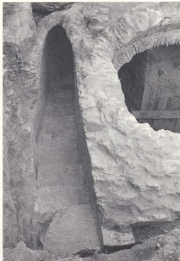
Η σκόλα εισοδού της κινωτέρας.

επέτρεπαν την ολοκλήρωση της ανασκαφής σε σύντομο σχετικά χρονικό διάστημα και η διάνοξη της οδού Ολυμπιάδος στο σημείο εκείνο καθυστέρουσε επί 3 και πλέον χρόνια, αναζητήθηκε λύση που θα συνδύαζε και τη διάνοξη της οδού, αλλά σπρωδίποτε και την ολοκλήρωση της έρευνας του μνημείου και την ανάδειξή του. Έτσι με συνεργασία της αρμόδιας Εφορείας, του Δήμου Θεσσαλονίκης, του Πανεπιστημίου Θεσσαλονίκης και τεχνικού γραφείου της πόλης εκπονήθηκε μελέτη, που έχει ήδη υλοποιηθεί, για την κατασκευή γέφυρας με την πρόνοια να υπάρχει η δυνατότητα ολοκλήρωσης της ανασκαφής μελλοντικά. Στη συνέχεια η αρμόδια Εφορεία ζήτησε την απαλλοτρίωση του γειτονικού οικοπέδου, ένα μέρος του οποίου καταλαμβάνεται από τμήμα της κινωτέρας, με σκοπό την ανάδειξη του μνημείου. Όσον αφορά τις πληροφορίες ότι γκρεμίστηκαν οι θόλοι της κινωτέρας για να γίνει η γέφυρα και ότι «οι ταμεντένιοι πεσσοί της ενώθησαν με τα πέτρινα τείχη της δεξαμενής», δεν ευ-