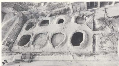
Η οροφή της κινωτέρας με τους καταστραμμένους θόλους, από ΒΑ.