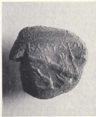
Κάλλιον (Μουσειο Δελφών 14264). Άρτεμις Λαφρία, επιγραφη ΚΑΛΥΔΑ[ΝΙΩΝ]. Η δημόσια σφραγίδα της Καλυδόνος.