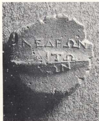
Κάλλιον (ΜΔ 14306). Επιδорatic, επιγραφη ΑΙΤΩΙΩΝΩΝ [ΣΥ]ΝΕΔΡΩΝ. Η δημόσια σφραγίδα του συνεδρίου, δηλ. της Βουλής της Αιτωλικής Συμπολιτείας.