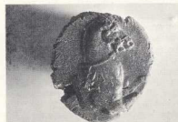
Κάλλιον (ΜΔ 14284). Ημίτομο ίππου, επιγραφη ΦΙΛΑΙΕΙΑ. Η σφραγίδα του επιμελητή του ιερού και της πόλεως των Δελφών (202/1 ή 201/0 π.Χ.). Φιλάεα Μίκκου Ναυπακτίου.