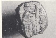
Κάλλιον (ΜΔ 14259). Αιτωλικός ήρωας, επιγραφη ΠΑΛΕΩΝ[Ν]. Η δημόσια σφραγίδα της Πάλης Κεφαλληνίας.

και στα θέματα, καθώς και διαφορών στο υλικό, που δεν είναι σαφές αν είναι τεχνικές ή χρονολογικές, ούτε αν κάποια στυλ αποτελούν επιδιωξεις ή αναβιώσεις όπως προηγήθηκαν. Η Evelyn Klengel-Brandt (Επαναχάραξη και επαναχρησιμοποίηση των αρχαίων σφραγιδοκυκλινδρών στην Εγγύς Ανατολή) εξέτασε τους διάφορους λόγους που οδηγούσαν στην επαναχάραξη, την αλλαγή των επιγραφών ή το σβήσιμο ή τον εμπλουτισμό του σχεδίου των σφραγιδοκυκλινδρών, οι οποίοι σε μετγενέστερους χρόνους χρησιμοποιήθηκαν ως φυλακτά ή αποθησαυρίζονταν λόγω του υλικού τους. Ο Ρ. Borzaevil (Επιεπιγραφές δυτικοσημιτικών κύλινδρων και σφραγίδες: η αρχαία ορολογία) ανέλυσε τους όρους που χρησιμοποιούνται στα σωζόμενα κείμενα και τη σημασία του καθενός απ' αυτούς.