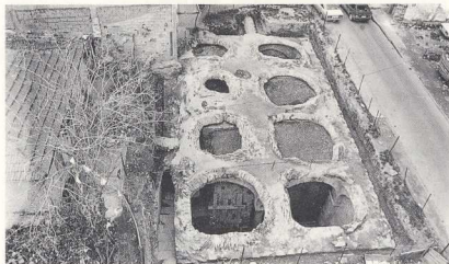
Η οροφή της κινωτέρας και η εισοδός της, από ΝΑ.