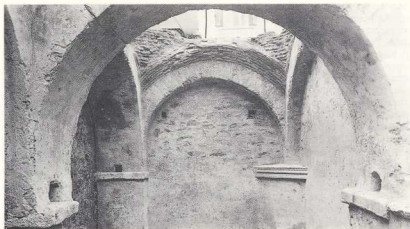
Εσωτερικό της κινωτέρας.