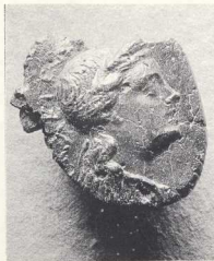
Κάλλιον (ΜΔ 14268). Κεφαλή Απόλλωνος Νασιότα, επιγραφη ΧΑΛΕΙΩΝ[Ν]. Η δημόσια σφραγίδα του Χαλείου (σημερινό Γαλαξειδί).