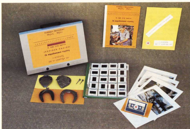
3. Η μουσειοσκη για το επάγγελμα του πεταλωτή.