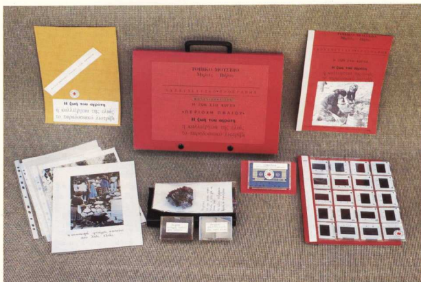
2. Η Μουσειοσκη για την καλλιέργεια της ελιάς.