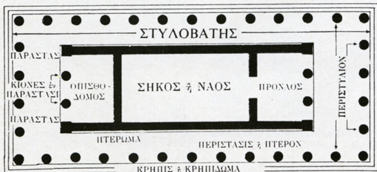
2. Κάτοψη ελληνικού ναού (G. Richter).