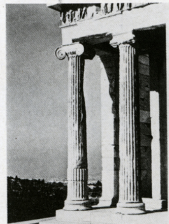
3. α. Δωρικός κίων, β. Ιωνικός κίων.