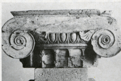
7. α. Δωρικό κιονόκρανο (Ναός της Αφαίας, Αίγινα). β. Ιωνικό κιονόκρανο (Οικία Διονύσου, Πέλλα).