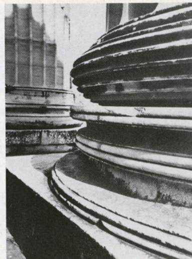
5. Βάση ιωνικού κίονα (ναός Απόλλωνος Βασσών).