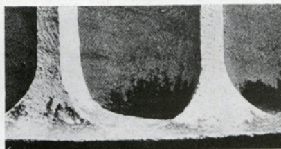
6. Ραβδώσεις α. δωρικού κίονα β. ιωνικού κίονα.