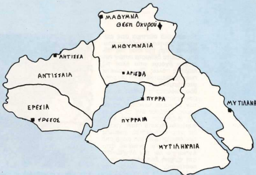
1. Η Λέσθος. Οι επικράτειες και οι αιολικές πόλεις (σύμφωνα με τον Γιάννη Κοντή, δλ. διδασιογρ. 2).

A new scientific discipline, «the Archaeology of Books» has as its object the thorough study of materials and special techniques of book making, mainly of the manuscript. The major pursuit of this new science is the collection and utilization of all information relevant to the book history. At the same time it has set the ambitious objective to compose bit by bit the overall appearance as well as the production of a Mediaeval scriptorium.