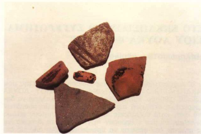
4. Οστρακα από τεφρά και μελαμβοφή αγγεία.

κετά (Δράκος πήδημα, Σκοτεινό, Σέλλες κ.ά.). Στην Πύρρα ένας μικρός αριθμός (Καλογερά, Δαμάνδρο κ.ά.). Στην Αντισσαία τα περισσότερα (Ξηροκαστρινή, Κοτζά-ντάγ, Προφήτης Ηλίας, Κουρατσώνας, Φονιάς και Καστρί κ.ά.).