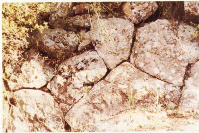
3. Το τείχος με τη λεσβία δομή (N. πλευρά).

μέτρα. Καλλιτεχνικά υπολείμματα της αρχαϊκής κλασικής και μεταγενέστερης οχυρωματικής τέχνης, σπαρμένα στη γη της Αιολίδας, μάρτυρες αδιάφραστοι της πολυποικιλής, άγραφης ιστορίας της.