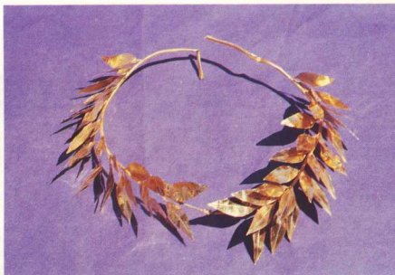
1. Το χρυσό στεφάνι Μ 1082.