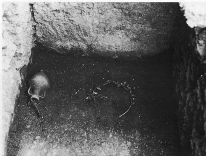
2. Το χρυσό στεφάνι M 1082, όπως βρέθηκε μέσα στον κιβωτίσχημο τάφο που ερευνήθηκε στο ορύγμα του κεντρικού αποχετευτικού αγωγού στην οδό Δημητρίου Αναστασιάδη. Μπροστά στο στόμιο του οξυπυθμένου αμφιρικού διακρίνεται απομεινάρια σιδερένιας σπλεγίδας.

Κατά τον αρχαιολογικό έλεγχο των εκσκαφών για την κατασκευή του τμήματος του αγωγού που διασχίζει την έκταση της αρχαίας πόλης της Ρόδου (δηλαδή από την οδό Παπαλουκά έως λίγο νοτιότερα από τη διασταύρωση της οδού Μεγάλου Κωνσταντίνου με την οδό Γαριβάλλη) επαληθεύτηκε κυρίως η τοπογράφηση ορίων αρχαίων οδών (όπως, για παράδειγμα, του βόρειου και νότιου ορίου της Ρ 38 ή του δυτικού ορίου της Ρ 30) και ερευνηθήκαν αποσπασματικά, μέσα στα όρια του πλάτους του ορύγματος, κατασκευές υποδομής της αρχαίας πόλης, όπως αγωγοί αποχέτευσης, υδρευτικές σωλήνες, λαξεύματα υπέργειων αποθηκευτικών χώρων, αποστραγγιστικά φρεάτια κ.ά. Σε μερικές περιπτώσεις, κυρίως κατά τον έλεγχο του ορύγματος κατά μήκος της οδού Μεγάλου Κωνσταντίνου, επισημάνθηκαν παραβιάσεις αρχαίων δρόμων από μεταγενέστερες επεμβάσεις. Επιπλέον, ερευνήθηκε τμήμα του αρχαίου τείχους που αποτελεί την προέκταση προς τα βορειοδυτικά του μεγάλου σωζόμενου τμήματος στον ακάλυπτο χώρο ο οποίος έχει προβλεφτεί ανάμεσα στις πολυκατοικίες του οικοδομικού τετραγώνου που εκτείνεται στα ανατολικά της οδού Μεγάλου Κωνσταντίνου και στα νότια της οδού Γαριβάλλη. Κατά τις εκσκαφές του ορύγματος για την κατασκευή του κεντρικού αποχετευτικού αγωγού νοτιότερα από την οδό Άννης Μαρίας έως τη Φανερωμένη και