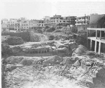
3. Άποψη από βόρεια της έκτασης του ταφικού χώρου που ερευνήθηκε στην περιοχή της Φανερωμένης, διακόπτοντας την πορεία του μεγάλου ορύγματος του κεντρικού αποχετευτικού αγωγού. Δεξιά διακρίνεται ο μεπτονόμος σκελετός του κτηρίου του Αναμορφωτηρίου.

Ο θωμός χρονολογείται στον 1ο αι. π.Χ., ίσως και λίγο αργότερα 3 . Νοτιότερα από τη Φανερωμένη και το Καρακόνερο και ως την απόληξη του αγωγού στο Κέντρο Βιολογικού Καθαρισμού στο ακρωτήριο Βόδι οι εκσκαφές του ορύγματος (που είχαν αρχίσει πολύ νωρίτερα από τις εκσκαφές μέσα στην πόλη) διακόπηκαν σε δυο σημεία όπου φανερώθηκαν σημα-