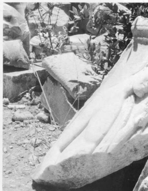
8, 9. Τα δύο κομμάτια της επιτύμβιας στήλης Γ 1640 που διασώληγονται.

σκάμμα για να «πατήσει» το μηχάνημά του σε στέρεο έδαφος και να αρχίσει την κανονική εκσκαφή του ορύγματος στο προβλεπόμενο από τη μελέτη βάθος.