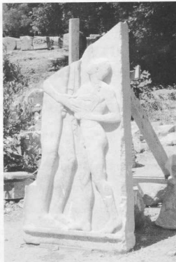
Χουν τις μορφές του νεαρού άνδρα και του μικρού εφήβου στη συμβολική σκηνή της τρυφερής αλ-

χαιολογικό έλεγχο των εκσκαφών για την κατασκευή του κεντρικού αποχετευτικού αγωγού Ρόδου εντάσσεται στο πλαίσιο μιας ευρύτερης αντιμετώπισης των επεμβάσεων που έχουν σχέση με μεγάλης κλίμακας εκσκαφές σε ιστορικά κέντρα. Η αντιμετώπιση αυτή επιδιώκει αφενός μεν την όσο το δυνατόν ακριβέστερη τεκμηρίωση των αρχαίων λειψάνων που αποκαλύπτονται κατά τη διάρκεια των εκσκαφικών επεμβάσεων, αφετέρου δε την εξεύρεση κατάλληλων τεχνικών λύσεων για τη διατήρηση των σημαντικών μνημείων. Για την επιτυχία αυτών των στόχων είναι απαραίτητο να προβλέπεται από την οικονομοτεχνική μελέτη των έργων η οργάνωση πλήρους συνεργείου σωστής ανασκαφικών ερευνών που θα περιλαμβάνει όχι μόνο αρχαιολόγους αλλά και αρχιτέκτονες, μηχανικούς, τοπογράφους καθώς και επαρκές ειδικευμένο εργατοτεχνικό προσωπικό. Επιπλέον, είναι απαραίτητη η συνεργασία ανάμεσα στους αρμόδιους φορείς που έχουν την ευθύνη της πραγματοποίησης των έργων (συνήψεως πρόκειται για την Τοπική Αυτοδιοίκηση) και στην Αρχαιολογική Υπηρεσία για την επίλυση προβλημάτων που θα προκύ-