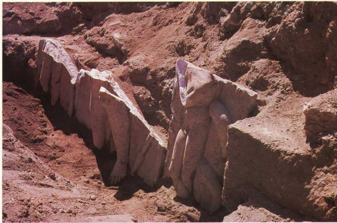
5. Το κατώτερο τμήμα της υστεροελληνιστικής επιτύμβιας σύνθεσης Γ 1499, όπως βρέθηκε in situ μετά τον πρώτο πρόχειρο καθαρισμό του. Δεν έχει ακόμη αποκαλυφθεί η πλήρης όπου «παθεί» η κεντρική μορφή στη μεσαία πλάκα. Επίσης, το κομμάτι που διασώζει την πλίνθο και το κατώτερο μέρος των ποδιών της μορφής στην αριστερή πλάκα είχε μετακινήθει και βρέθηκε βαθύτερα την επόμενη μέρα.

επιτύμβιος, όπως δείχνει το χθόνιο σύμβολο του φιδιού, με προεκτάσεις λατρευτικού αφηρωισμού της κεντρικής μορφής του πολεμιστή. Το έργο, με αισθητές τις επιδράσεις των αναμνησμένων σκοπαδικών κεφαλών στην απόδοση των κεφαλιών των δυο εφηβικών μορφών, μπορεί να χρονολογηθεί στον 1ο αι. π.Χ. 5 . Οι εκπλήξεις όμως που παραμένουν κατά την εσκαφή του ορύγματος του αποχετευτικού αγωγού στο Βόδι δε σταματάνε εδώ... Κατά την επιβλεψη των εργασιών για τη διέλευση του αγωγού ανάμεσα από τους μνημειώδεις αναλημματικούς τοίχους (σύμφωνα με την κατασκευαστική λύση που πρότεινε η Δημοτική Επιχείρηση Ύδρευσης και Αποχέτευσης Ρόδου και αποδέχτηκε η Αρχαιολογική Υπηρεσία), στις 3 Οκτώβρη 1988, βρέθηκαν θαμμένα κάτω από όγκο μπάζων στη δυτική απόληξη του βόρειου αναλημματικού τοίχου (και σε απόσταση 10 περίπου μέτρων από τη θέση όπου βρέθηκε αδιατάρακτο το κατώτερο τμήμα της υστεροελληνιστικής επιτύμβιας σύνθεσης) μεγάλη επιτύμβια στήλη των χρόνων του αυστηρού ρυθμού σε τρία κομμάτια.