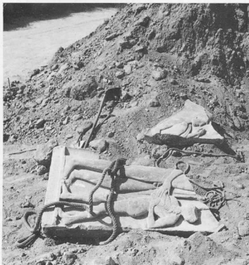
7. Τα δύο κομμάτια της επιτύμβιας στήλης Γ 1640 αμέσως μετά την ανακάλυψή τους και τον πρόχειρο καθαρισμό τους, έτοιμα να φορτωθούν στο φορτηγό της Υπηρεσίας για να μεταφερθούν στην «περβόλα». Το τρίτο μικρότερο κομμάτι βρέθηκε λίγο αργότερα, θαμμένο κάτω από τον ίδιο όγκο χωμάτων.