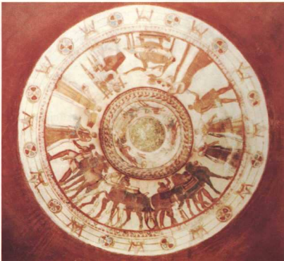
5. Συνολική άποψη της αναπαράστασης της γιορτής στο θόλο του νεκρικού δωματίου.

λωτοί τάφοι στην Ακρόπολη των Μυκηνών, όπως ο θησαυρός του Ατρέως και ο τάφος του Αιγίσθου. Στο επίπεδο της κατασκευής έχουμε την πρώτη διαφορά. Ενώ όλοι οι θολωτοί τάφοι που απαντώνται στον Ελλαδικό χώρο αποτελούνται από ένα μεγάλο εξωτερικό διάδρομο –τον δρόμο– που οδηγεί στο θολωτό νεκρικό δωμάτιο, ο θρακικός τάφος αποτελείται από τρεις χώρους. Ο δρόμος εδώ είναι κλειστός και βρίσκεται πίσω από την πόρτα του τάφου, ενώ ο προθάλαμος (με κατασκευή παρόμοια με αυτή του δρόμου στους ελληνικούς τάφους) είναι ανοικτός. Η ύπαρξη των τοιχογραφιών στους τοίχους του δρόμου και στο θόλο του νεκρικού δωματίου είναι ακόμη ένα διαφοροποιό στοιχείο. Στους ελληνικούς τάφους δεν απαντώνται τοιχογραφίες. Η σύγκριση γίνεται με τοιχογραφίες που βρέθηκαν σε ανάκτορα ή σπίτια στις Μυκήνες, στην Τίρυνθα και αλλού. Η χρήση πέτρας ως οικοδομικού υλικού, για την κατασκευή μόνο του προθαλάμου, και η χρήση τούβλων για την κατασκευή του δρόμου και του νεκρικού θαλάμου, προβληματίζει. Η χρήση του τούβλου θεωρείται χαρακτηριστικό της τεχνικής της φυλής των Θρακών που ζούσαν στην περιοχή. Παρ' όλα αυτά, μόνο εικασίες μπορούμε να κάνουμε πάνω στο συγκεκριμένο θέμα. Η έλλειψη πέτρας στην περιοχή, η οποία