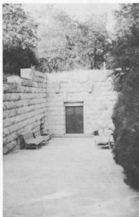
6. Η είσοδος του αντίγραφου του τάφου.