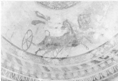
8. Λεπτομέρεια από τις αρματοβόριες στην εικόνα του θόλου του νεκρικού θωματίου.

Γύρω από τον τάφο, σε αρκετά μεγάλη έκταση, έχει φτιαχτεί μεγάλο πάρκο που είναι και ο βασικός τόπος αναψυχής και διασκέδασης των κατοίκων της πόλης όταν αυτοί επιθυμούν μια δόλτα σε ένα ειρηνικό εξοχικό τοπίο.