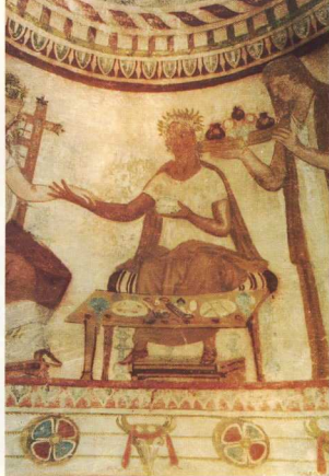
4. Ο άρχων - ευγενής, από την απεικόνιση της γιορτής.

λωτής στέγης του δωματίου καλύπτεται από αγώνες αρμάτων που γινόντουσαν προς τιμή του νεκρού.