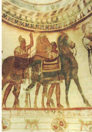
2. Υπηρετές και άλογα –λεπτομέρεια από την παράσταση της γιορτής.

στημονικός κόσμος άρχισε να ασχολείται και πάλι με τον νεοεξερευνηθέντα τάφο. Το 1960 κτίζεται ένα δεύτερο προστατευτικό κτήριο γύρω από τον τάφο και ένα χρόνο αργότερα, το 1961, το σύστημα ελέγχου και προστασίας ολοκληρώνεται με την εγκατάσταση μετεωρολογικών οργάνων ελέγχου και συστήματος κλιματισμού για τη ρύθμιση και τη διατήρηση των εσωτερικών συνθηκών σε επιθυμητά επίπεδα, μέσα στο χώρο του τάφου. Το 1966 η UNESCO, κατά τη διάρκεια μιας Συνδιάσκεψης της στη Σόφια, εκτιμώντας την άριστη κατάσταση των τοιχογραφιών που βρέθηκαν στους τοίχους του τάφου, τον εντάσσει στην Παγκόσμια Λίστα Μνημείων με Ιστορική Σημασία (World Heritage List).