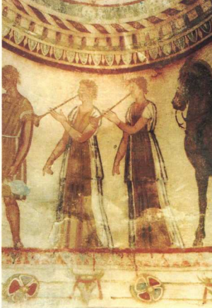
3. Υπνρέτες - μουσικοί κατά τη διάρκεια της γιορτής.