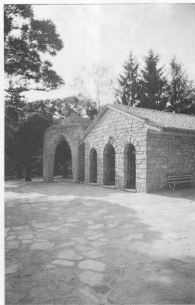
7. Το προστατευτικό κτήριο του πρωτότυπου τάφου και το οθωμανικό κτίσμα.

αποτελείται βασικά από πεδινές εκτάσεις, θα μπορούσε να ήταν ένα στοιχείο για τη χρησιμοποίηση του τούβλου. Η χρήση πέτρας όμως στον προθάλαμο αδυνατεί τον ανωτέρω συλλογισμό. Δεν έχουμε επίσης κανένα στοιχείο που να δικαιολογεί την άποψη για το κτίσιμο του προθαλάμου σε διαφορετική χρονική περίοδο από αυτή των άλλων δύο χώρων. Πάντως την περίοδο κατασκευής του τάφου η χρήση του τούβλου ήταν ήδη διαδεδομένη στη μεσογειακή λεκάνη. Άλλες διαφοροποιήσεις συναντάμε στη χρήση διαφόρων χρωστικών ουσιών,