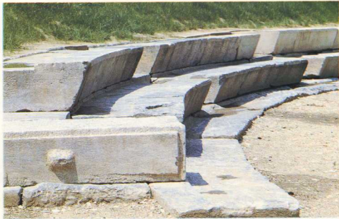
11. Δεύτερο αρχαίο θέατρο. Λεπτομέρεια του κοίλου.

ματα της κλασικής και των παλαιότερων περιόδων. Έτσι οι ερευνητές με τα επιστημονικά αυτά δεδομένα προσπαθούν να αποκαταστήσουν τον πολεοδομικό ιστό της αρχαίας πόλης. Ο ίδιος ο λόφος «Φρούριο», ο οποίος ταυτίζεται με την αρχαία ακρόπολη, είναι στην πραγματικότητα ένας προϊστορικός οικισμός (προϊστορικοί οικισμοί της νεολιθικής εποχής υπήρχαν και άλλοι στον χώρο όπου αναπτύχθηκε η μετέπειτα πόλη). Στις ανατολικές υπώρειες του λόφου διενεργήθηκε μια ανασκαφική έρευνα με συνολικό βάθος 10 μ., η οποία αποκάλυψε επάλληλα στρώματα κατοικήσεων από την πρώτη χαλκοκρατία ως τα ύστερα βυζαντινά χρόνια (εικ. 3). Η πόλη αναπτύχθηκε μόνο νότια και ανατολικά από την ακρόπολη, γιατί θόρεια και δυτικά περιοριζόταν από τον Πηνειό.