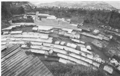
8. Πρώτο αρχαίο θέατρο. Άποψη του κοίλου και του επιθεάτρου.