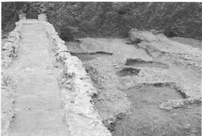
5. Τμήμα δρόμου και κτιστός αποχετευτικός αγωγός.