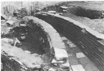
6. Δίκτυο κτιστών αποχετευτικών αγωγών.