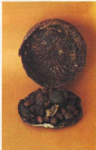
13. Περιεχόμενο πλεκτού καλαθιού.