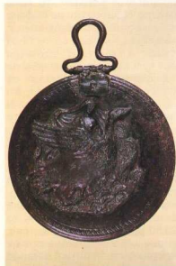
14. Χαλκίνο κάτοπτρο από τάφο του νοτίου νεκροταφείου (2ος αι. π.Χ.).

λογείται η μη διατήρησή τους μέχρι σήμερα. Οι νεότεροι ερευνητές υπέθεσαν ότι τα αρχαία τείχη ακολουθούσαν την πορεία των τούρκικων τειχών και το μήκος τους ξεπερνούσε τα 6450 μ. Τα τούρκικα τείχη σώζονταν μέχρι το Β' Παγκόσμιο πόλεμο και στη συνέχεια εξαφανίσθηκαν κατά τη μεταπολεμική ανοικοδόμηση της πόλης (μαζί με την οχυρωματική τάφρο). Φαίνεται ότι η αρχαία πόλη ήταν πιο περιορισμένη, διότι μέσα στην έκταση που καταλάμβαναν τα τούρκικα τείχη έχουν επισημανθεί και αρχαία νεκροταφεία.