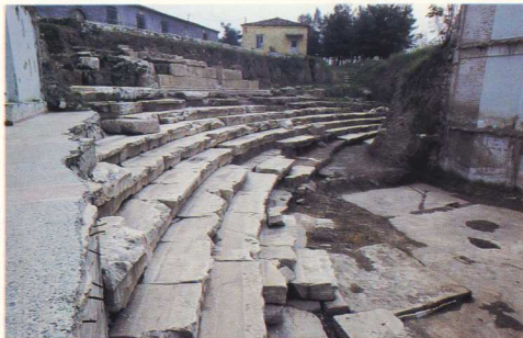
9. Πρώτο αρχαίο θέατρο. Λεπτομέρεια του κοίλου.