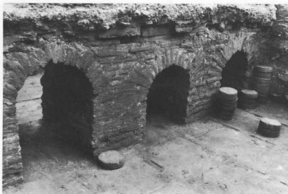
2. Λουτρά ρωμαϊκής εποχής.