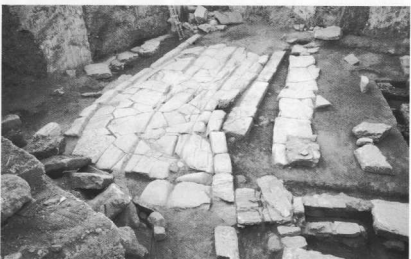
7. Τμήμα πλακοστρωμένου δρόμου ρωμαϊκής εποχής.