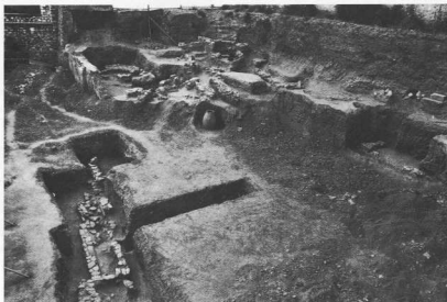
3. Άποψη ανασκαφής στις ΝΑ υπώρειες της ακρόπολης.