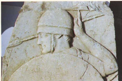
1. Η στήλη του Θεοτίμου.

Από τη μυθολογική παράδοση αναφέρονται ως ταγοί της πρώτης πολιτικής ένωσης των Θεσσαλών οι Λαρισάιοι Ευρύλοχος, Εχεκρατίδης και Αλεΐας ο πυρρός. Ο Αλεΐας ο πυρρός (Ξανθός), γιος του Θεσσαλού και εγγονός του Ηρακλή, ήταν ήρωας και γενάρχης της αριστοκρατικής οικογένειας των Αλευάδων, οι οποίοι συνδέθηκαν στενά με την ιστορία της Λάρισας και διοίκησαν την πόλη τουλάχιστον ως το τέλος του 4ου αι. π.Χ. Επί της ταγείας των Αλευάδων, τον 6ο και 5ο αι., η Λάρισα γνώρισε μεγάλη οικονομική άνθηση και αναδείχθηκε σε πρώτη δύναμη στη Θεσσαλία. Η «χώρα» της περιλάμβανε την εποχή αυτή τη μεγαλύτερη έκταση της Πελασγωτίδας. Για τους μυθικούς πλούτους της «εριβάλακος» Λάρισας μιλούν σχεδόν όλοι οι αρχαίοι συγγραφείς: «Λάρισαν, ευτυχεστάτην πόλιν», την αποκαλεί ο Σκύμνος· ο Οράτιος την ονομάζει « Larissae campis optimaee », ενώ ο Στράβων μας πληροφορεί ότι οι Λαρισάιοι εξουσιάζαν «ευδαιμονέστατα μέρη των πεδίων». Ονομαστότερος Αλευάδης ηγεμόνας ήταν ο Θώραξ (498 π.Χ.), ο οποίος αναφέρθηκε από τον Πίνδαρο σ' ένα πυθνικό του για την ευγενική του ψυχή και τη φιλοξενία του. Αυτός, όπως και τα αδέρφια του Ευρύστολος και Θραουδαίος, ήταν ταγοί της πρώτης πολιτικής ένωσης των