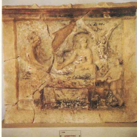
Επιτύμβια στήλη της αρχαίας Δημητριάδας με παράσταση νεκρόδεπνου (3ος αι. π.Χ.).