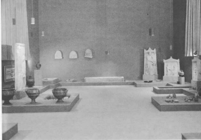
Άποψη της αίθουσας 6 του Μ. Βόλου, όπου εκτίθενται τάφοι και ταφικά ευρήματα από τη Μεσοελληνική περίοδο έως τα ελληνιστικά χρόνια (2η χιλιετία π.Χ. – 3ος αι. π.Χ.).

Στην αίθουσα 3 του Μουσείου Βόλου εκτίθενται αγγεία, κομήματα, εργαλεία και ειδώλια του Νεολιθικού Πολιτισμού μέσα σε κόγχες, πάνω σε ράφια και σε πίνακες ντυμένους με λινότα, που πατούν σε χαμηλά τοιχάρια αργολιθοδομής (εικ. 3). Με τη χρήση υλικών γνώριμων στη Νεολιθική περίοδο, όπως το ξύλο, η πέτρα, το καλάμι, το λινάρι, επιτεύχθηκε η μείωση των δυνατών αντιθέσεων μεταξύ του τράσσιου χώρου των αιθουσών του Μουσείου και των μικρών γενικά προϊστορικών ευρημάτων. Ακόμα ο τεχνητός φωτισμός, με συγκεκριμένη κατεύθυνση φωτεινή δέσμη (spot), ανεδεικνύει τα εκθέματα, απομονώνοντάς τα από τον σκοτεινό περιβάλλοντα χώρο. Αγγεία μονόχρωμα καθημερινής χρήσης και γραπτά της Πρώιμης, Μέσης και Νεότερης Νεολιθικής περιόδου (ρυθμού Ξέσκαλου, ρυθμού Διμηνίου), εργαλεία προσαρμοσμένα σε οστά ζώων, απαραίτητα στις καθημερινές εργασίες, πήλινα ανθρωπόμορφα ή ζωόμορφα ειδώλια με φυσιοκρατική απόδοση των χαρακτηριστικών εκτίθενται πάνω σε πίνακες, μέσα σε κόγχες, Κοσμήματα πήλινα, λίθινα ή οστρίνα, κρεμασμένα με δέρμα, είναι έτοιμα να φορεθούν. Απανθρακωμένοι καρποί μέσα σε αγγεία μιλούν για μια άτυχη στιγμή. Υλικά δομής των κατοικιών, σχέδια και πρωτότυπα ομοιάματα νεολιθικών σπιτιών, συνθέτουν όλα μαζί ένα σύνολο στοιχείων που μιλά για τη συγκεκριμένη πολιτισμική περίοδο με τον πιο εκφραστικό και αυθεντικό τρόπο. Στις αίθουσες 5 και 6 τάφοι και