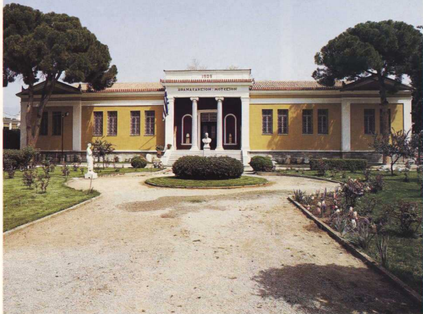
Άποψη του αρχαιολογικού Μουσείου Βόλου.